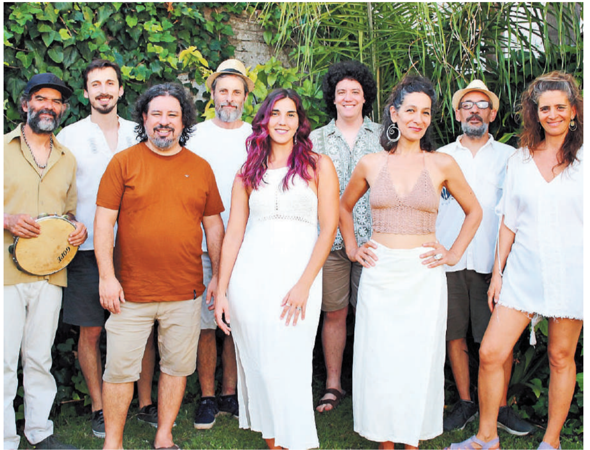
Samba Na Esquina invita a recibir el Año Nuevo en la Plaza Alvear.

Por otra parte, desde la organización adelantaron a EL DIARIO que no habrá servicio de cantina, por lo que aconsejan concurrir con conservadora y con el compromiso de colocar los deshechos en los recipientes para residuos.