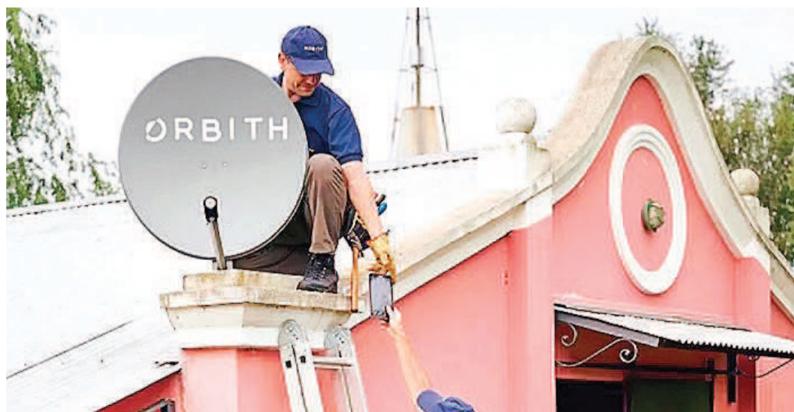
Orbith es una empresa de capitales nacionales que brinda el servicio de internet satelital en el país.

Además, Orbith se encuentra en proceso de fabricar el primer satélite de su propia flota -que será lanzado a finales de 2024- de tecnología MicroGEO, que permitirá brindar servicios de acceso a internet de alta velocidad a decenas de miles de usuarios, tanto residenciales como corporativos.