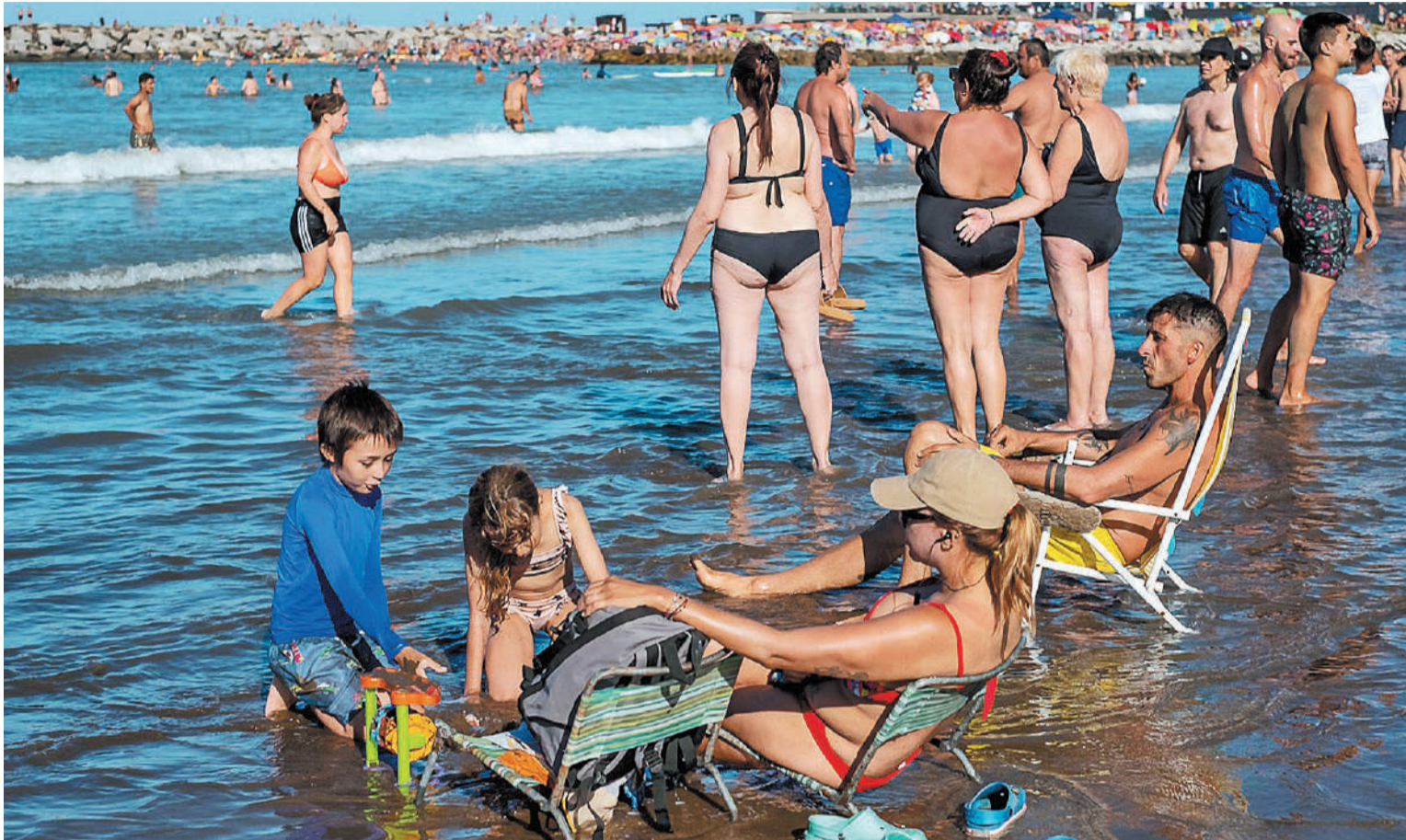
El sharenting consiste en la publicación de información y fotografías de nuestros hijos.