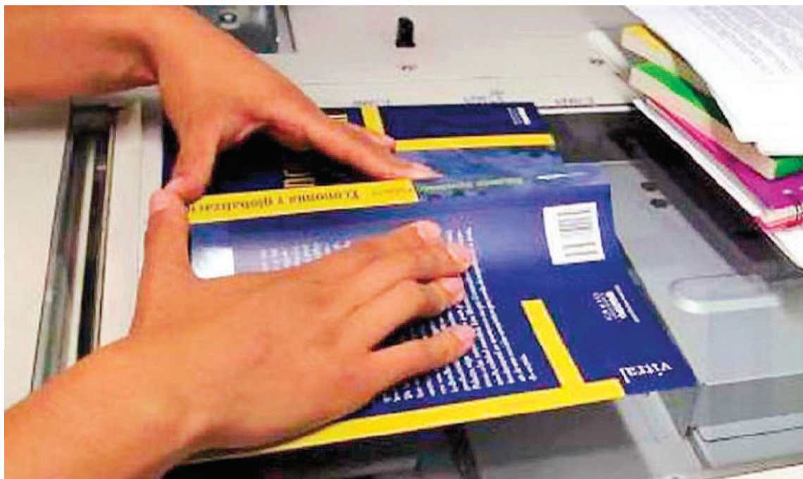
La norma que habilita a la entidad que representa a editores y escritores a cobrar un canon por reproducción digital o analógica de obras resultaría perjudicial, entre otros, para la universidad.

Surgida como una ONG, la entidad podrá finalmente representar a autores y editores de obras literarias, artísticas o científicas para cobrar un canon por las reproducciones en formato digital o analógico de las obras, así como accionar judicialmente contra quienes incumplan la ley, según una normativa firmada por el gobierno saliente.