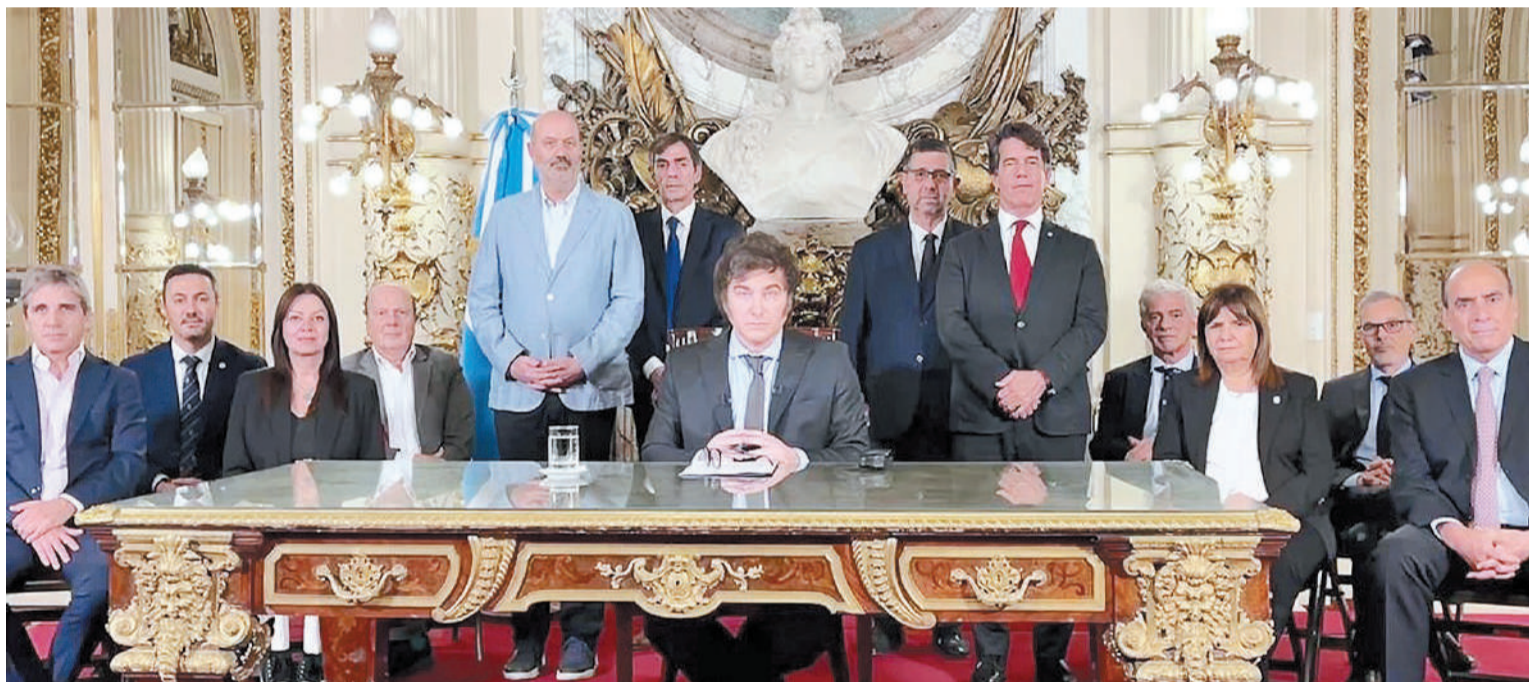
Continúa el rechazo contra el decreto de necesidad y urgencia presentado días atrás por el presidente.

Domínguez, consiste en una "acción declarativa de inconstitucionalidad" contra el Decreto de Necesidad y Urgencia 70/2023, con un pedido de medida cautelar para suspender sus efectos hasta el dictado de sentencia definitiva.