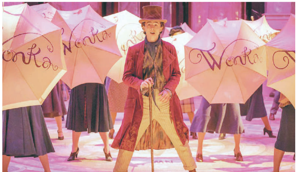
Wonka, diariamente en los cines Círculo y en Sunstar.