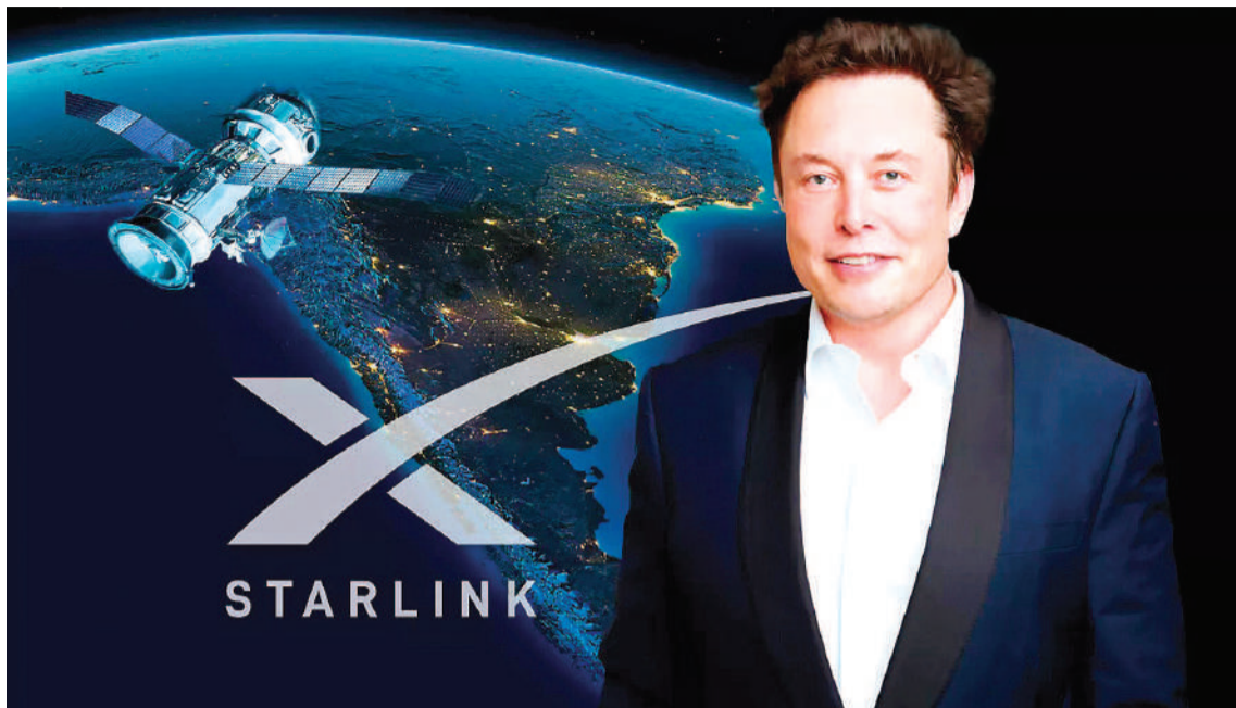
Ya se puede reservar el servicio de Starlink, la empresa de Elon Musk.

de Starlink ya se encuentra disponible la reserva del servicio de internet satelital para la Argentina, con un costo de US$ 9 a depositar en el momento de la operación, según se indica.