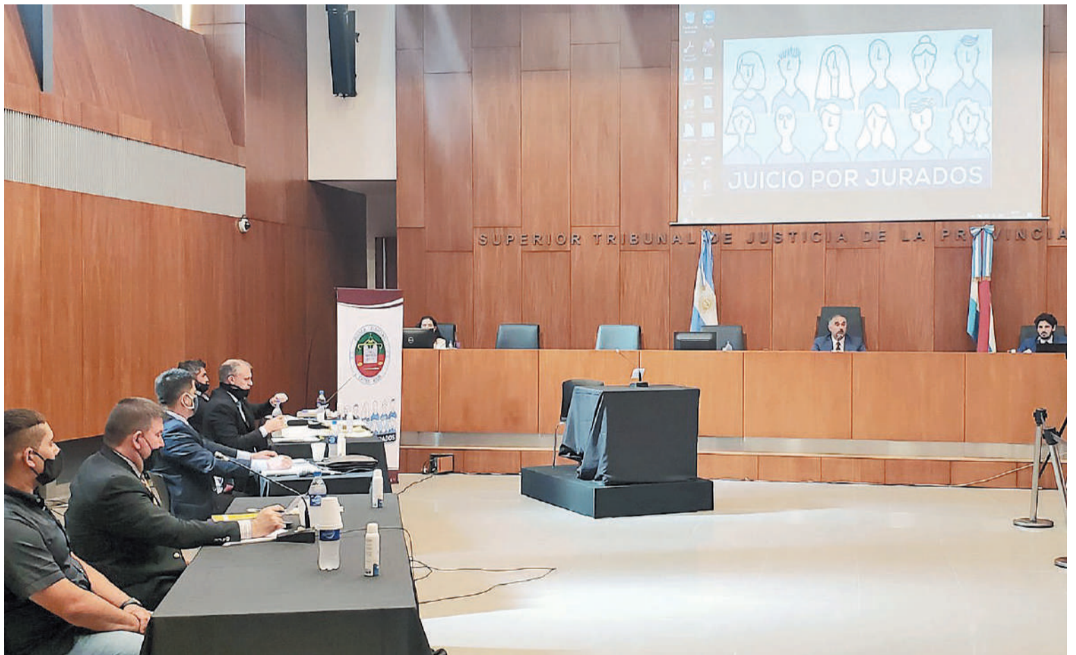
Los juicios se llevaron a cabo en los 17 departamentos de la provincia.

A partir de la entrada en vigencia de ese sistema de juzgamiento penal, hace cuatro años, 1.232 ciudadanas y ciudadanos -616 mujeres y otros tantos varones- integraron los jurados populares y otras 5.390 personas, en igualdad de género, fueron convocadas para las audiencias de selección de jurados.