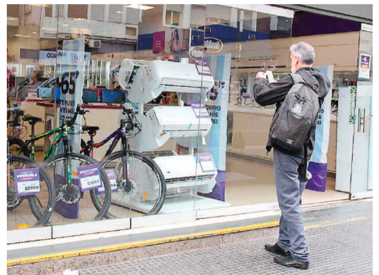
Nuevas tecnologías y modos de compra replantean las estrategias de venta.

De esta manera, las personas esperan que las empresas salgan a su