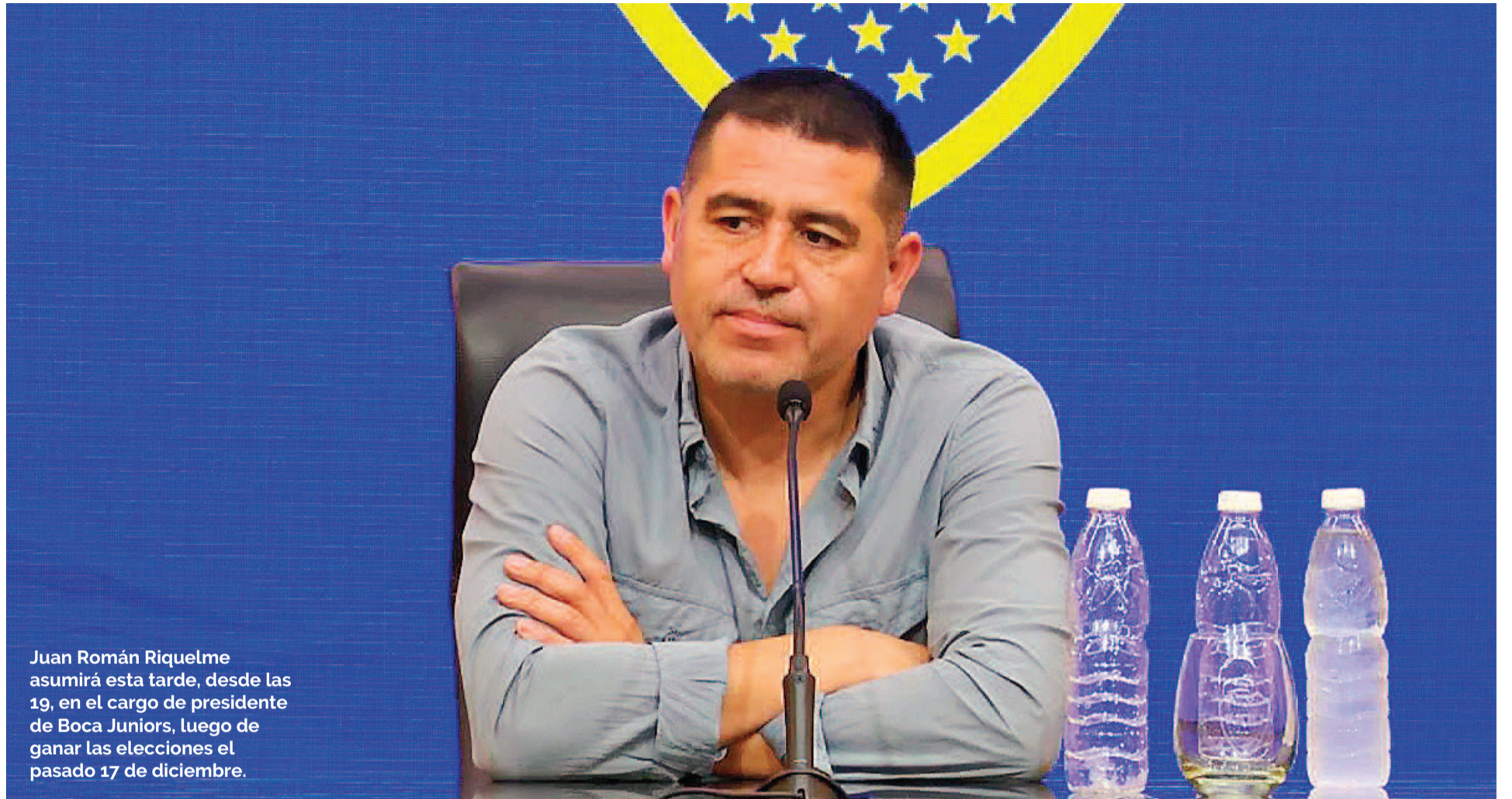
Juan Román Riquelme asumirá esta tarde, desde las 19, en el cargo de presidente de Boca Juniors, luego de ganar las elecciones el pasado 17 de diciembre.