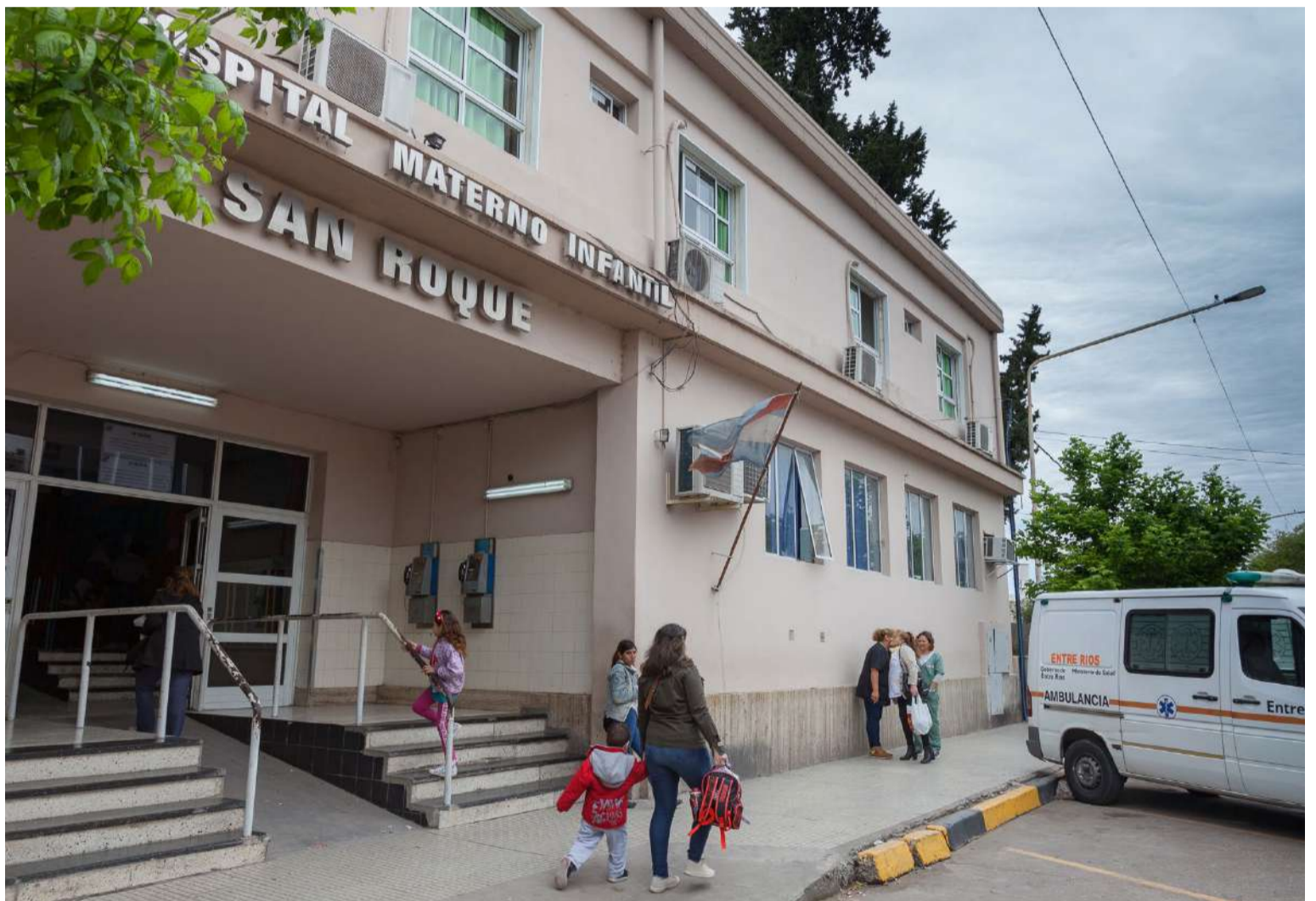
El adolescente fue internado en el Hospital San Roque.