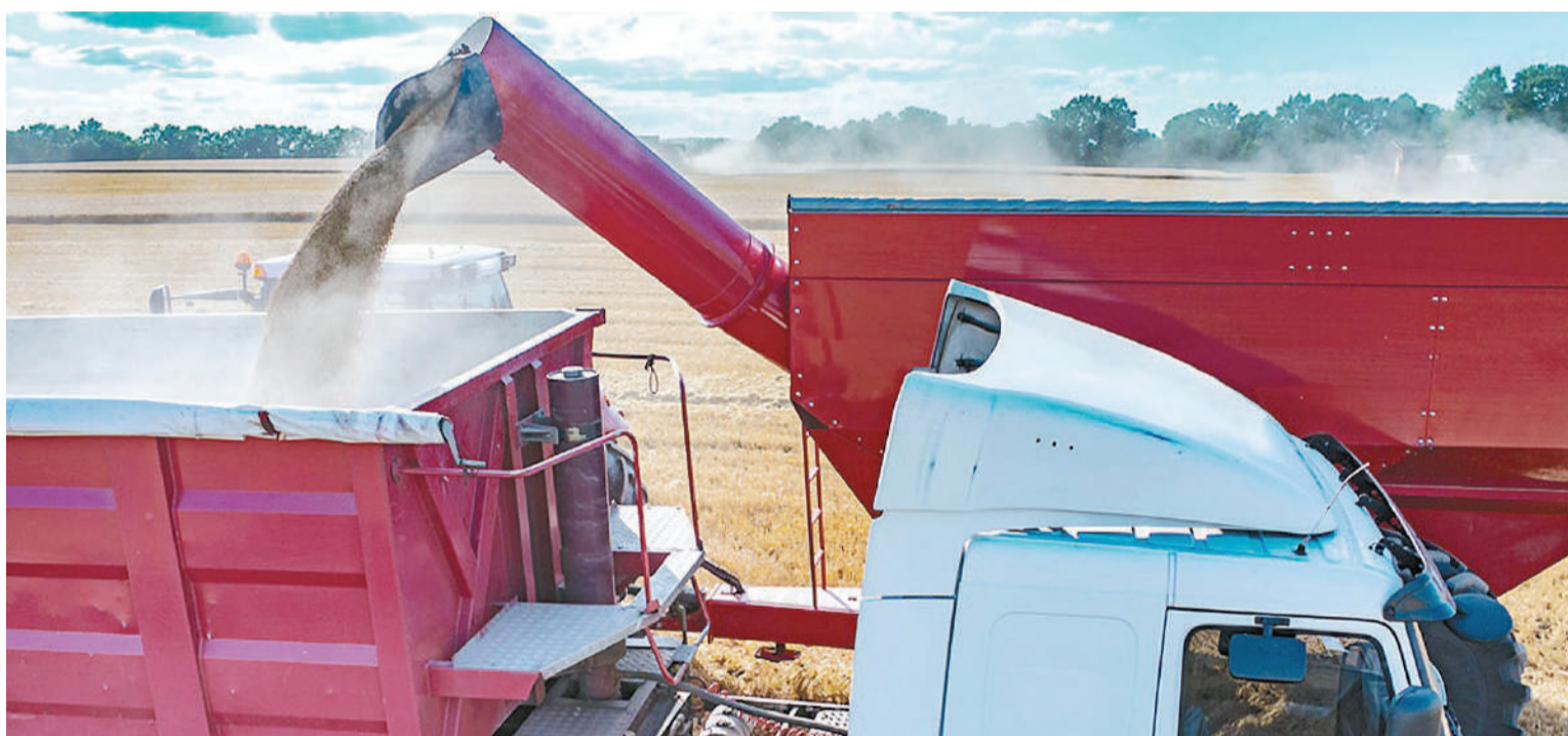
En 2024 habrá mayor producción y rentabilidad para el sector agrícola.