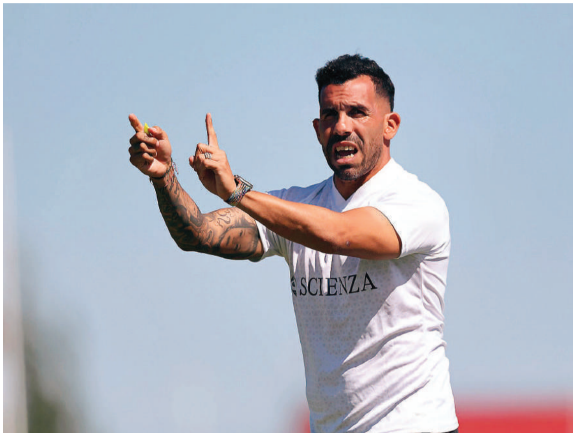
Carlos Tevez arranca una nueva temporada como entrenador en el fútbol argentino.

Carlos Tevez rescató al equipo en la pasada Copa de la Liga cuando la posición en la tabla anual amenazaba con el segundo descenso en la historia de la institución, pe-