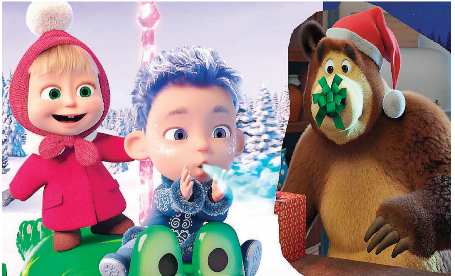
“Masha y el oso”, diariamente en Cine Círculo, Sunstar y Las Tipas.

Wish: 17.50 Patos 3D: 14:15 | 16:10 Aguas Siniestras: 20:20