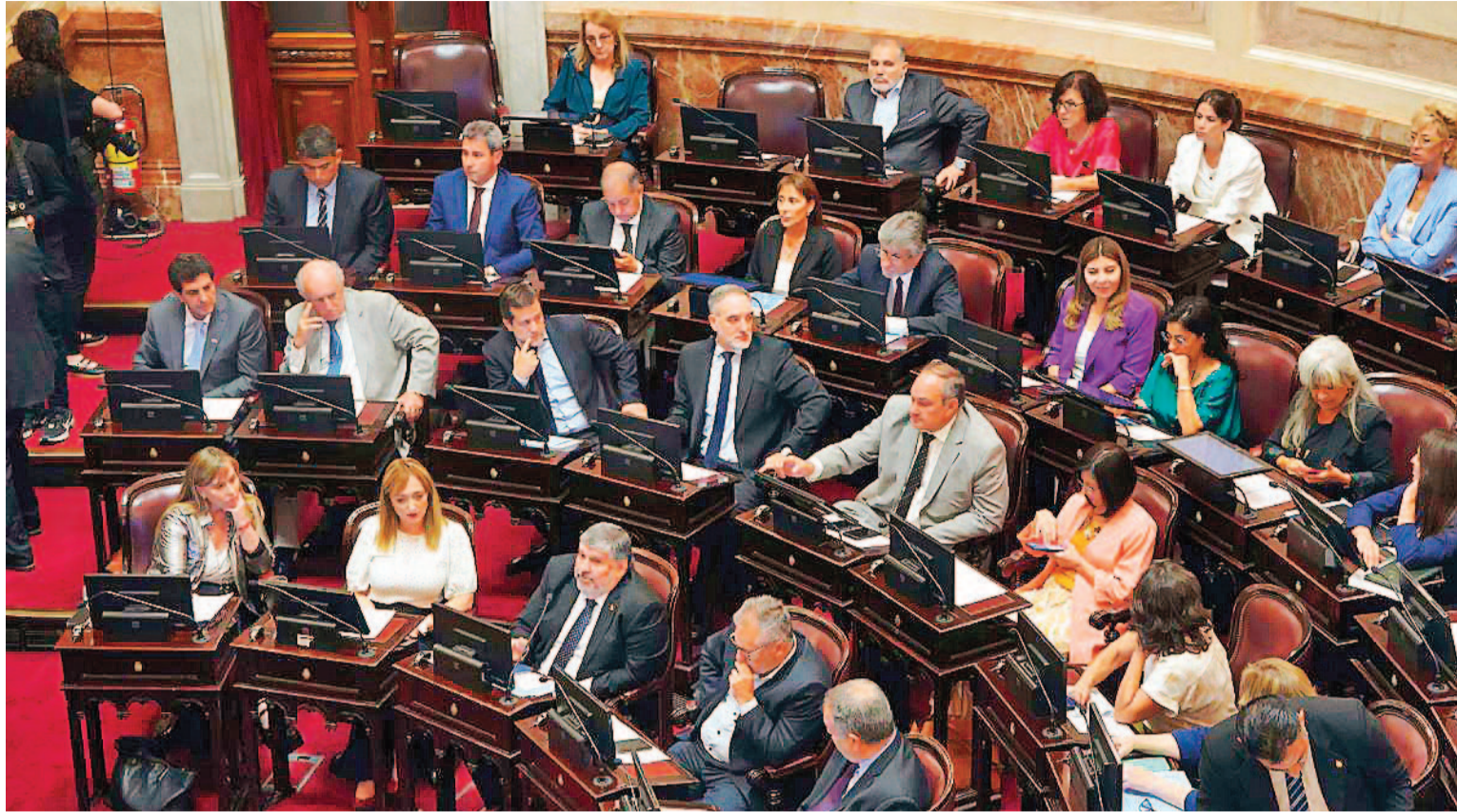
Continúan las negociaciones entre los diferentes bloques para obtener apoyo de cara a la votación que se prevé que será muy reñida.