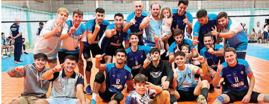
El AEC enfrentará a los santafesinos. Las chicas enfrentarán a Unión y el equipo masculino a Gimnasia y Esgrima. Las entradas serán destinadas para costear los gastos competitivos.

AMISTOSOS PARA EL AEC. Este sábado se realizará una jornada de vóley con dos partidos amistosos en la presentación de los equipos de cara al inicio de la segunda categoría de la disciplina a nivel nacional. El Negro contará con la