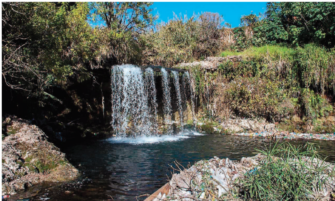
EcoCinema, Ciclo de Cine Ambiental estrena programación hoy a las 20.30, en el patio del Museo de Bellas Artes.

La propuesta cuenta con el apoyo de la Unidad de Vinculación Ecológica que estará a cargo de abrir la conversación sobre temáticas ambientales de una forma artística y cercana. Además, EcoCinema tiene el acompañamiento institucional de la Organización No Gubernamental Hacemos Verde. Esta última ONG tendrá a cargo stands