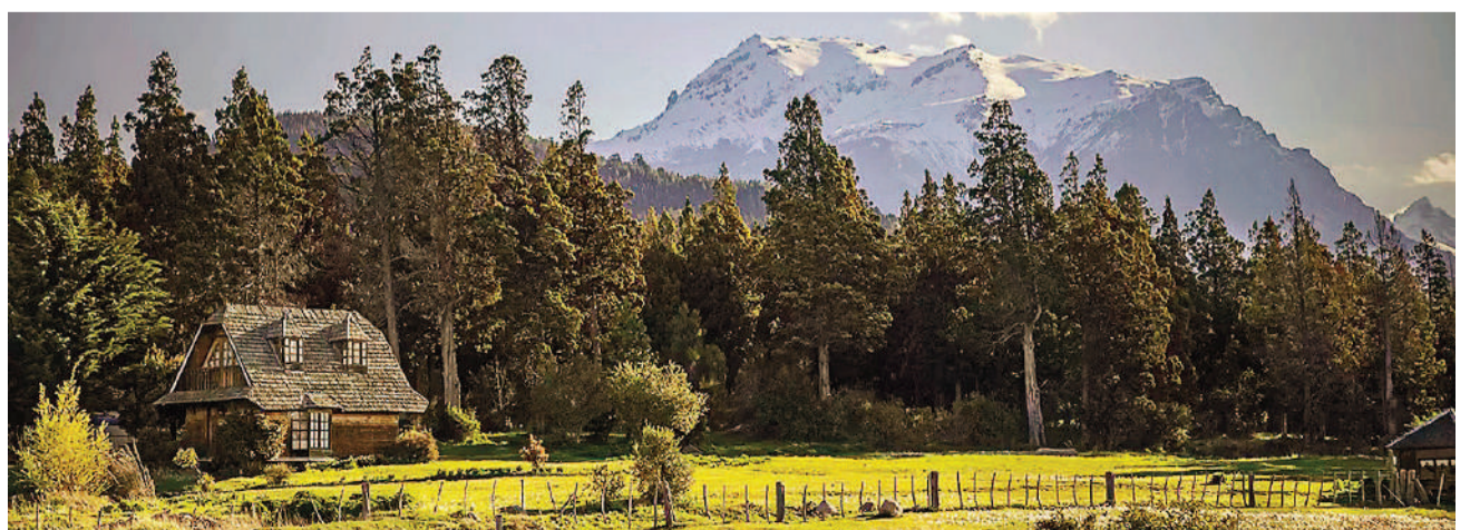
La localidad patagónica de Trevelin, distinguida como uno de los mejores pueblos turísticos del mundo por la Organización Mundial del Turismo.