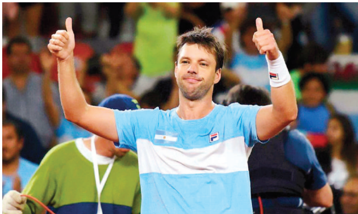
"Vengo arrastrando una lesión en el hombro izquierdo desde la pretemporada. Es mejor que jueguen González-Molteni, que viene bien y están consolidados", declaró Zeballos sobre el cambio.

La Selección Argentina de Tenis ganó el pase a esta instancia en sep-