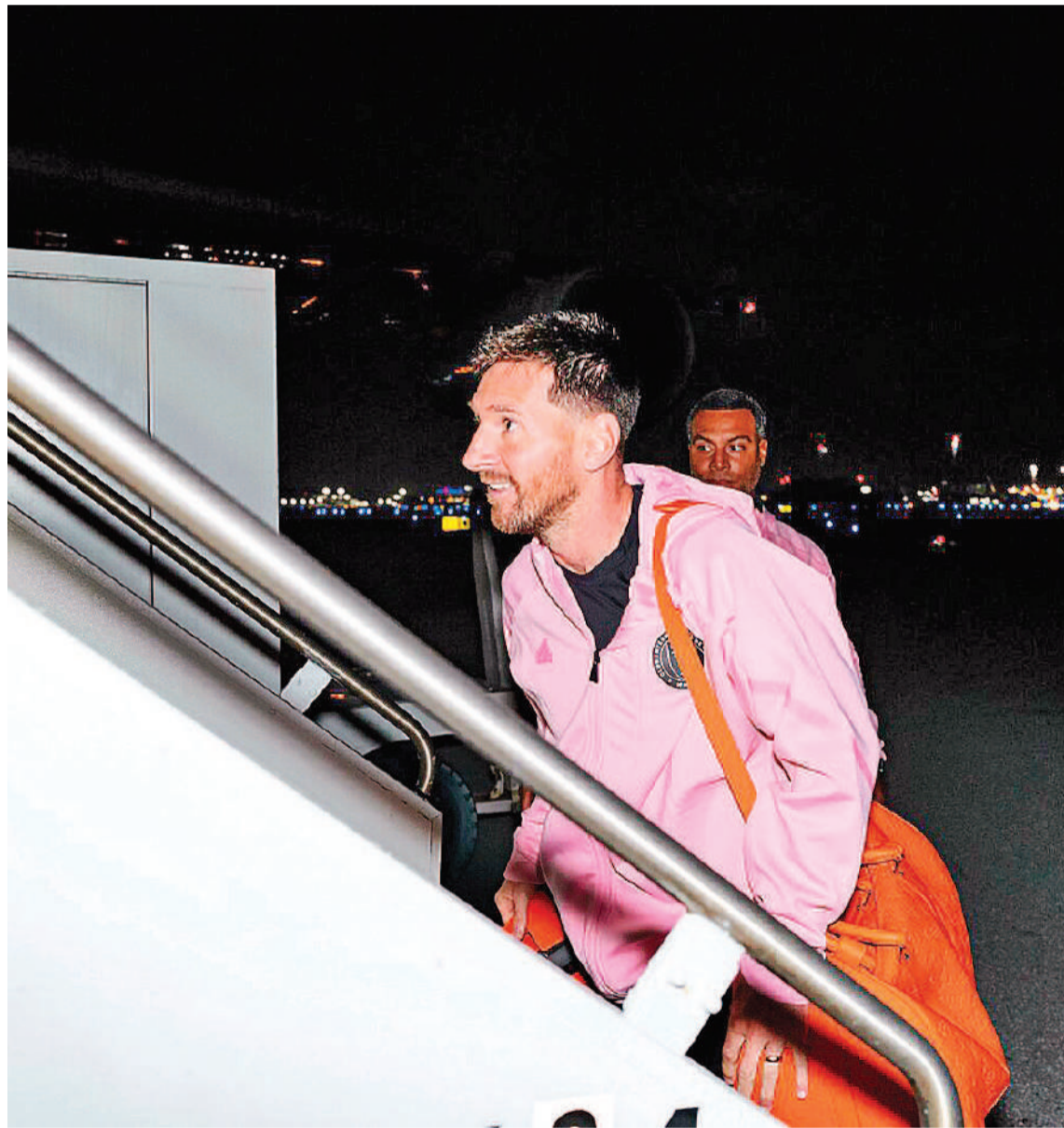
El capitán de la Selección Argentina, Lionel Messi, viajó con el Inter de Miami rumbo a Arabia Saudita.

El capitán de la Selección Argentina partió junto al plantel de "Las Garzas" rumbo a medio oriente, donde continuarán con la preparación para la exigente temporada que dará inicio en el mes de febrero. El equipo de Gerardo "Tata" Martino lleva varios partidos sin ganar.