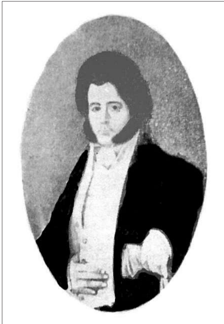
Cipriano de Urquiza, gobernador delegado (1844).

La invasión militar dispuesta por el gobierno de la Nación a Entre Ríos, para dominar la pri-