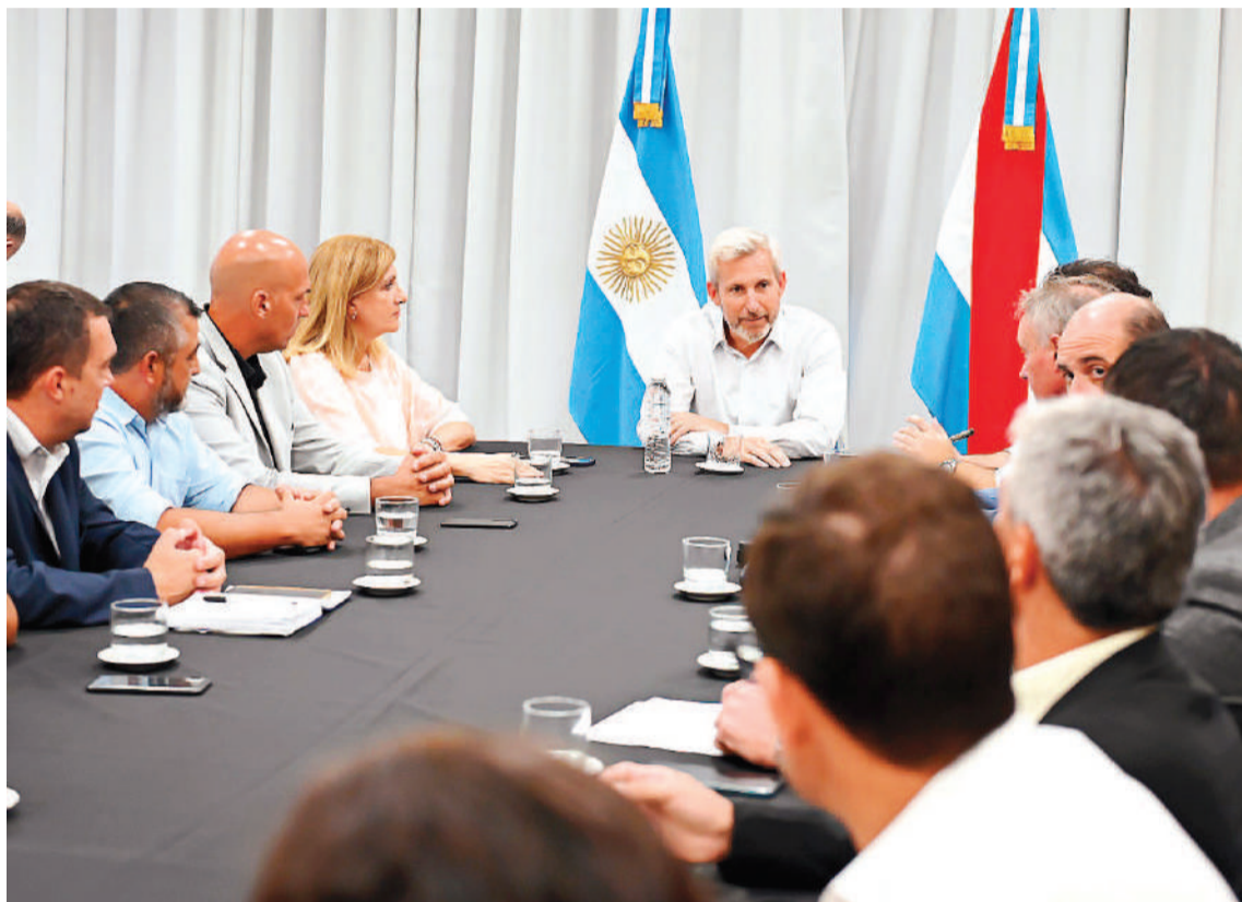
Los intendentes se reunieron con Frigerio.

Del encuentro, que se llevó a cabo en el Centro Provincial de Convenciones (CPC), participaron los