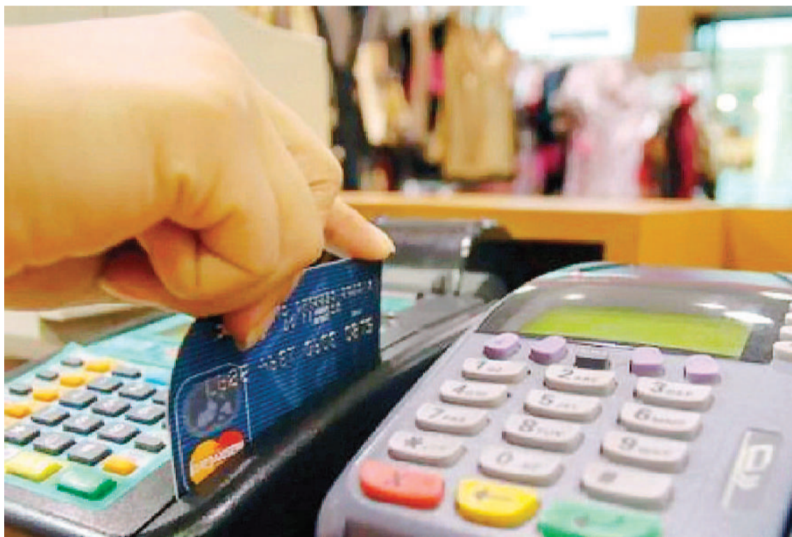
El programa comenzará a regir a partir del 1 de febrero.

Es decir, con el porcentaje subsidiado por el Estado, la tasa de Cuota Simple sería de 93,5%, "la más baja del mercado", según destacaron el Palacio de Hacienda y el área de Comercio. Cabe destacar que, Ahora 12, que finalizará el próximo 30