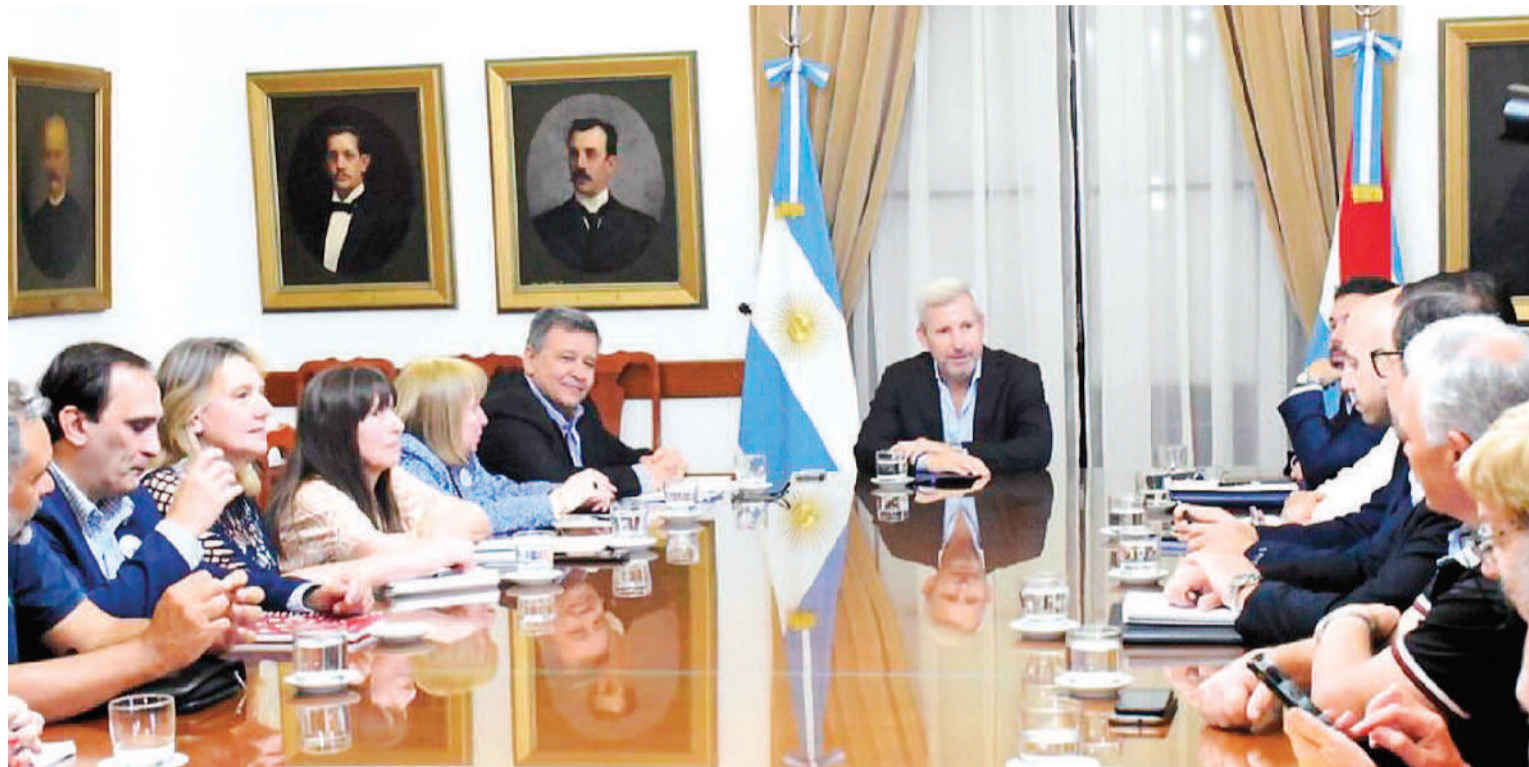
El gobernador recibió a los sindicatos que agrupan a los empleados del Estado provincial.

► LOS EMPLEADOS PÚBLICOS TAMBIÉN RECIBIRÁN UN BONO DE 25.000 PESOS