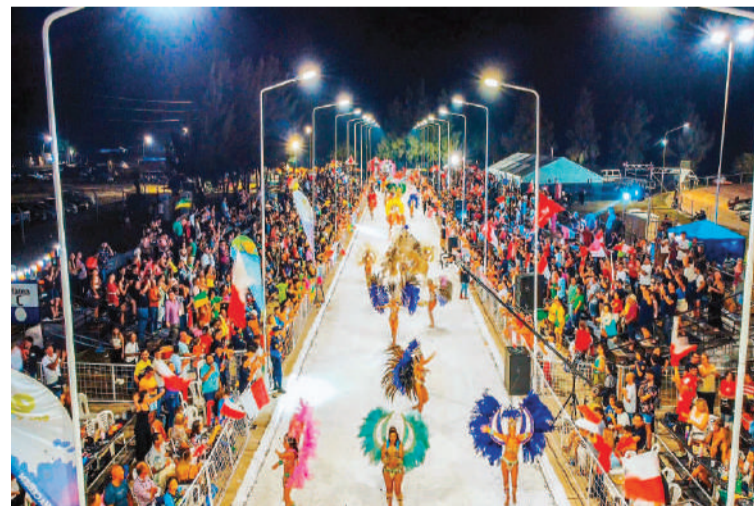
En Entre Ríos ya comenzaron los carnavales.