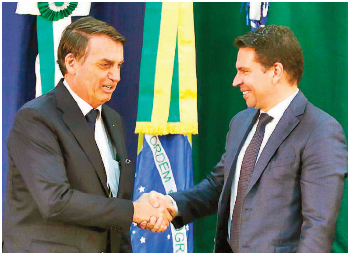
Jair Bolsonaro junto a Alexandre Ramagem.

Además de Mendes y de Moraes, la ABIN habría rastreado ilegalmente los dispositivos móviles del expresidente de la Cámara de Diputados, Rodrigo Maia, y del exgobernador de Ceará y actual ministro de Educación en el Gobierno de Luiz Inácio Lula da Silva, Camilo Santana, revelaron medios brasileños.