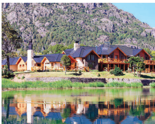
Trevelin, un destino para disfrutar de los paisajes patagónicos.

“Es una joyita de la Patagonia. Representa algo muy importante para la cultura galesa, con su tradicional té galés y un dragón que tira fuego en la plaza, y para la cultura de pueblos originarios, que hace de la localidad un sitio multicultural, además de su vinculación con el Parque Nacional Los Alerces y su proximidad con Esquel”, concluyó el Secretario de Turismo.