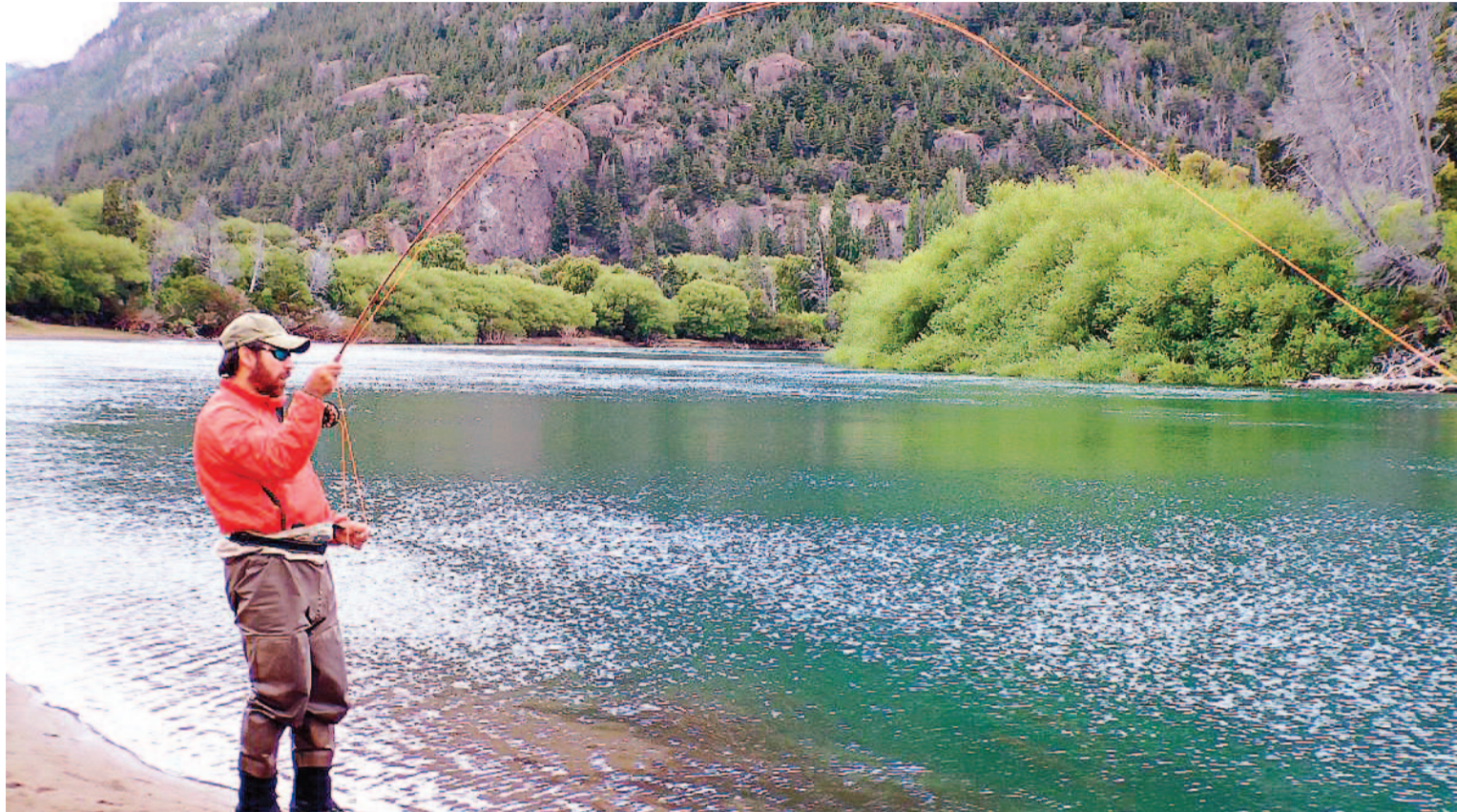
En la zona existen diversidad de especies de peces, como la trucha marrón o el salmón encerrado.