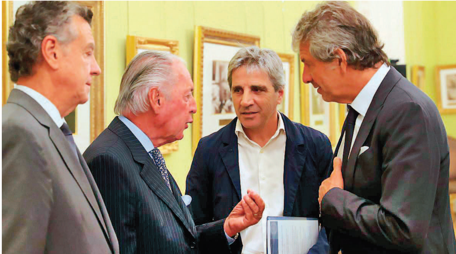
El ministro de Economía, Luis Caputo, junto a autoridades de empresas.