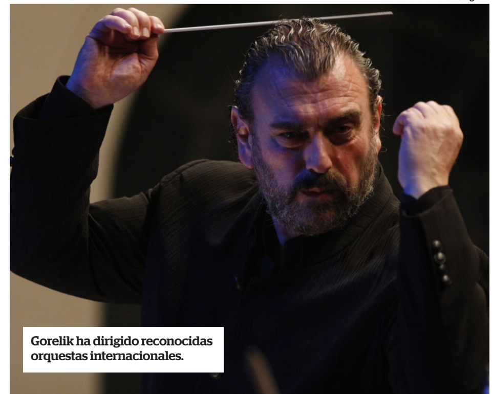
Gorelik ha dirigido reconocidas orquestas internacionales.

Cátedra de Dirección Orquestal en la Universidad Nacional de las Artes (UNA) desde el 2012. “La docencia es otra de mis pasiones. La transmisión de experiencias y conocimientos a las jóvenes generaciones es un proceso que me ha otorgado muchas alegrías y novedosas perspectivas.