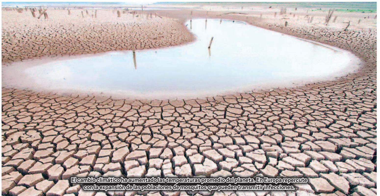
El cambio climático ha aumentado las temperaturas promedio del planeta. En Europa repercute con la expansión de las poblaciones de mosquitos que pueden transmitir infecciones.

MEDIDAS DE PREVENCIÓN. Establecer medidas coordinadas de control de vectores es un elemento clave para la lucha contra las enfermedades transmitidas por mosquitos. De acuerdo al ECDC "será necesario seguir investigando para desarrollar herramientas eficaces