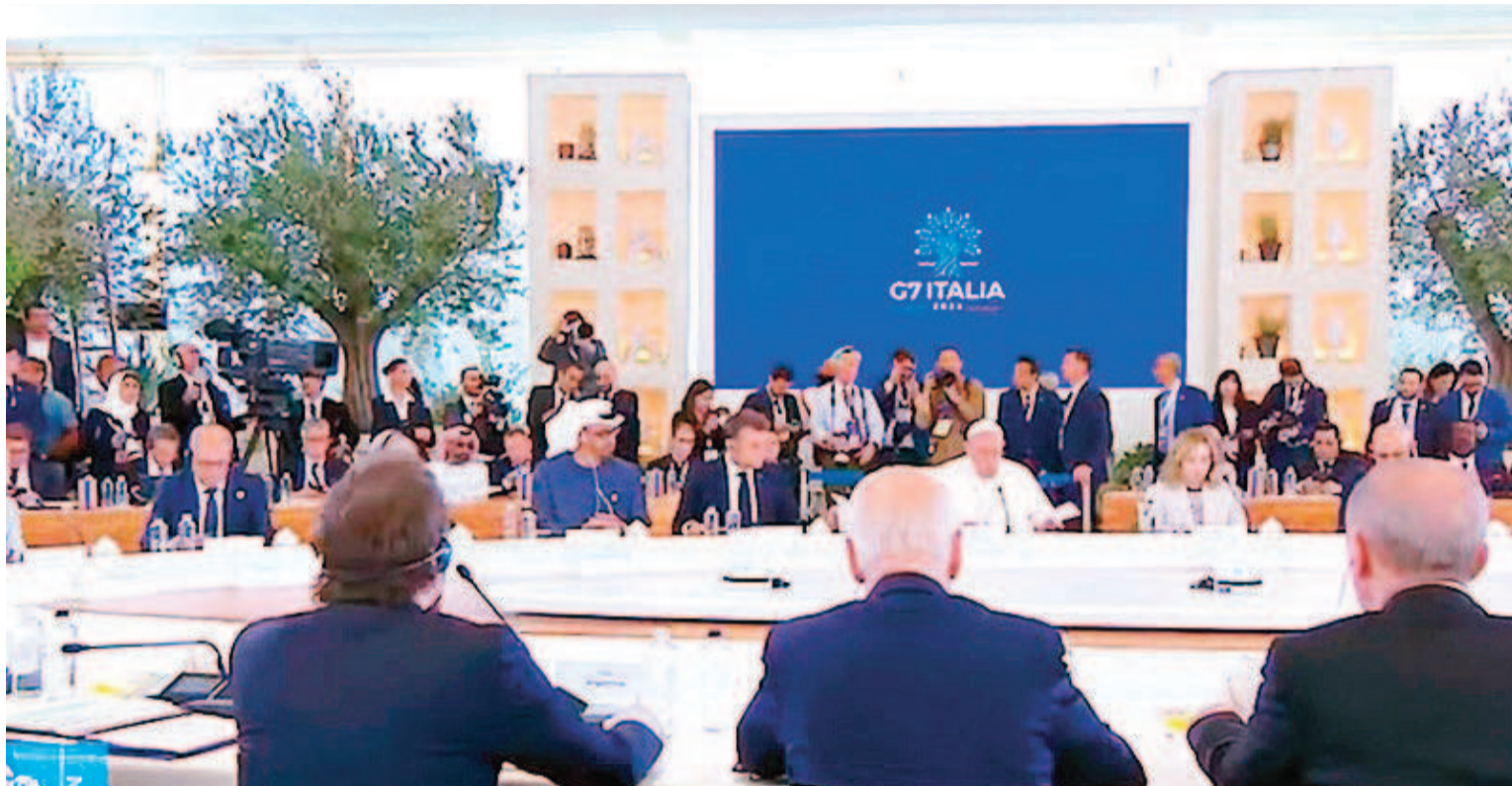
“Ninguna máquina debería elegir jamás poner fin a la vida de un ser humano”, dijo el Papa.

En su discurso, centrado en la necesidad de que el desarrollo de la Inteligencia Artificial (IA) no olvide su compromiso ético, el pontífice afirmó que “ninguna máquina debería elegir jamás poner fin a la vida de un ser humano”.