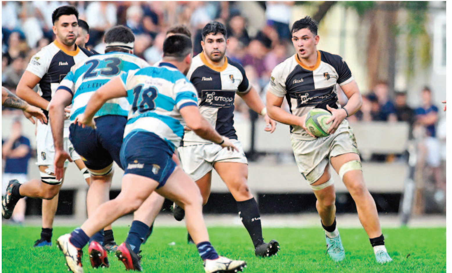
Tras haber caído ante CRAI, la fecha que pasó, el CAE buscará reivindicarse este sábado ante Old Resian.