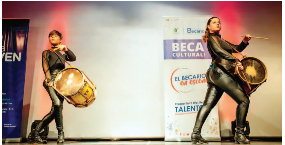
La primera gala del Becario en Escena será en Nogoyá, el 29 de junio.