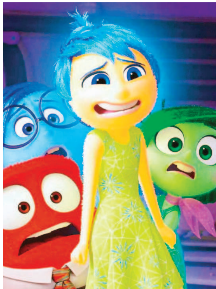
"Intensamente 2", diariamente en cines Círculo y Sunstar.

La muestra se puede visitar en Salas Centrales del museo con entrada libre y gratuita hasta el domingo 23 de junio.