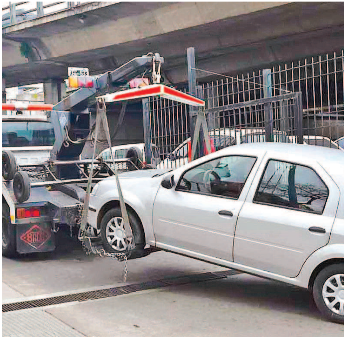
Luego de las presentaciones judiciales, decidieron volver atrás con la medida de prohibir el servicio de auxilio mecánico y grúa.

El primer ítem incluye casos de daño y/o Incendio o robo o hurto, que correrán por cuenta de las aseguradoras, con costos de traslado del vehículo hasta el lugar más próximo al del siniestro o al de su aparición en caso del robo o hurto, donde se pueda efectuar su inspección, reparación o puesta a dis-