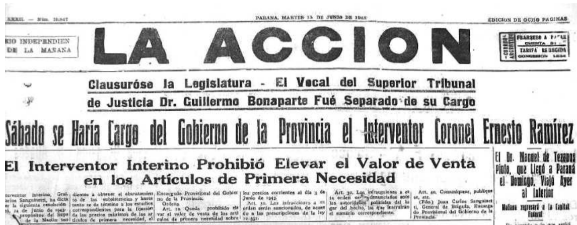
Diario La Acción informa sobre la huelga de estudiantes.