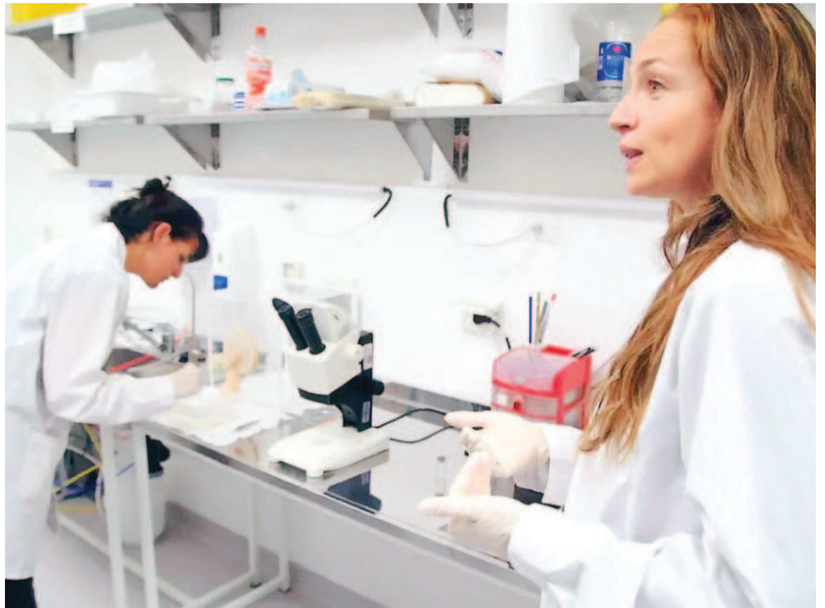
En Europa consideran que hay diferentes medidas para adoptar contra la expansión de los mosquitos y que se necesita más investigación.

"Las medidas de protección personal combinadas con medidas de control de vectores, detección precoz de casos, vigilancia oportuna, más investigación y actividades de sensibilización son primordiales en las zonas de Europa con mayor riesgo", agregó la funcionaria.