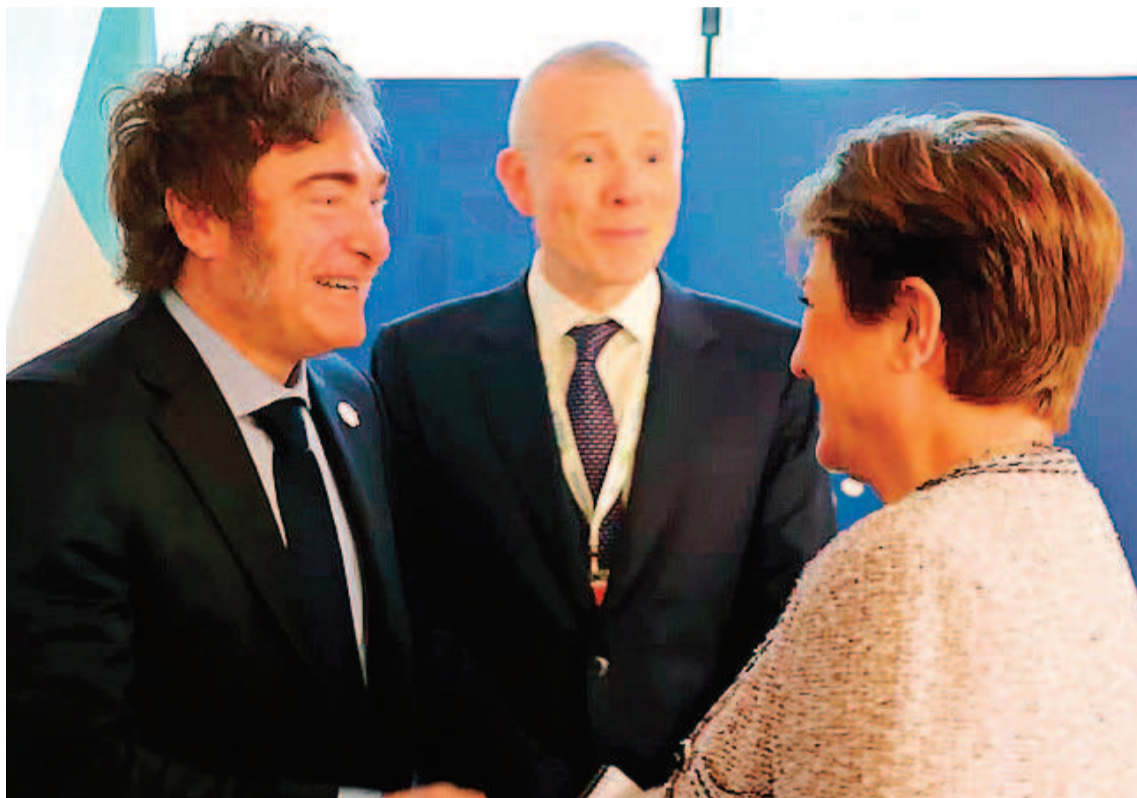
El presidente Javier Milei se reunió con la titular del Fondo Monetario Internacional.

El presidente Javier Milei se reunió con la titular del Fondo Monetario Internacional (FMI), Kristalina Georgieva en el marco de la plenaria de la cumbre del G7, en donde participan líderes de las principales potencias globales