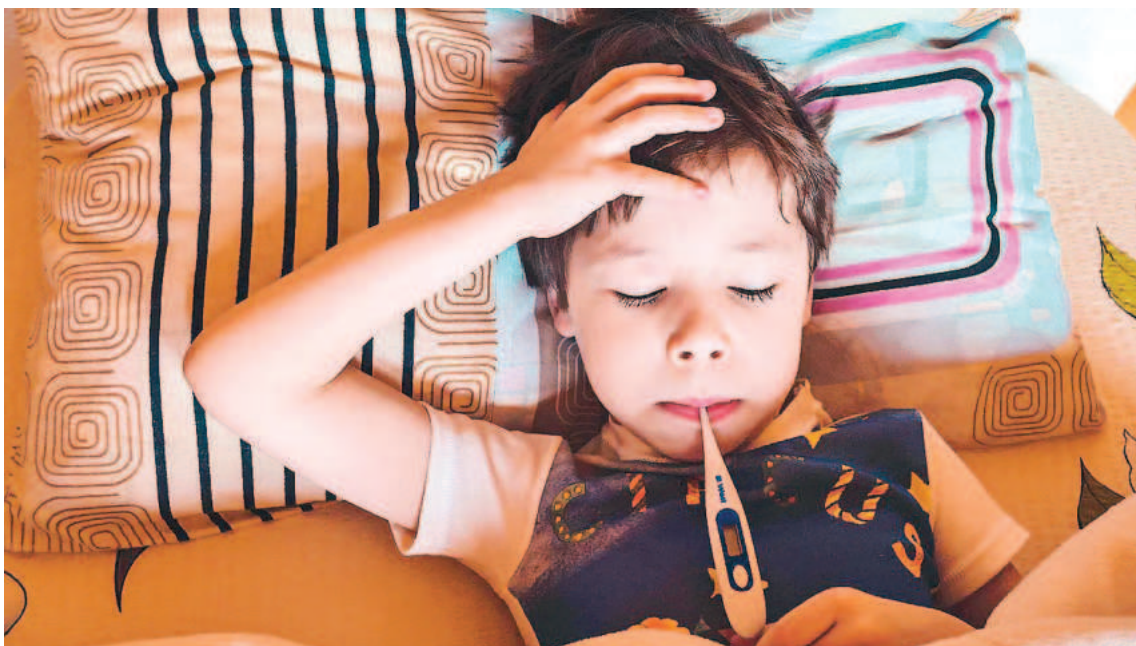
La fiebre súbita es uno de los síntomas de la gripe. Aunque las personas pueden contagiar incluso antes de manifestar síntomas.

La vacuna contra la gripe se puede coadministrar con la vacuna contra COVID-19. Las personas de 65 años o más no requieren indicación médica para recibir la vacuna antigripal.