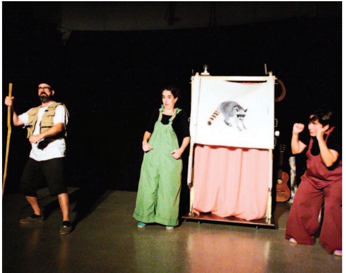
Hoy y mañana se desarrollan las últimas jornadas de Gurisada y Teatro en Sala Saltimbanquis.