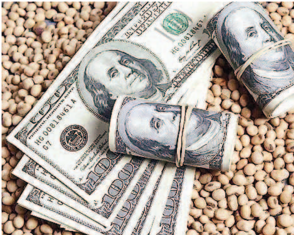
Bajas ventas de soja en junio.

“Las ventas (de los agricultores) en junio cayeron sensiblemente en relación con mayo. Estaremos en junio en 3,8 millones (de tone-