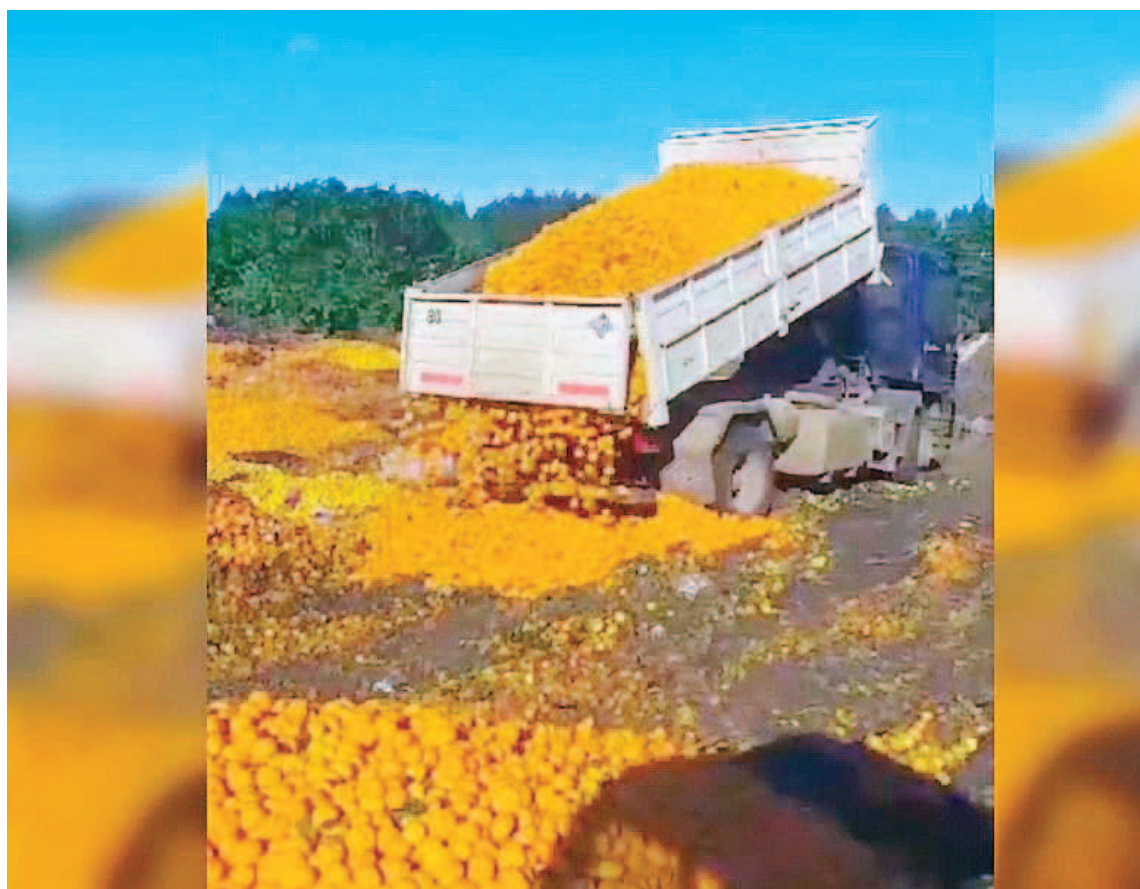
Las mandarinas fueron tiradas en el basural.

SIN MERCADO. Asimismo, el ex presidente de la Federación de Citricultores de Entre Ríos profundizó: “Lo peor que le puede pasar a un productor es ver tirar su producción, porque detrás de cada mandarina hay mucho esfuerzo, mucho sacrificio. No hay salida (hacia el mercado) y se vienen otras variedades, y hay que tirarla. Si tenemos conocimiento de que mucha fruta de esta variedad va a quedar en la planta. Se anuncian heladas el domingo. Creo que seguramente va a ayudar a que se vayan al piso”.