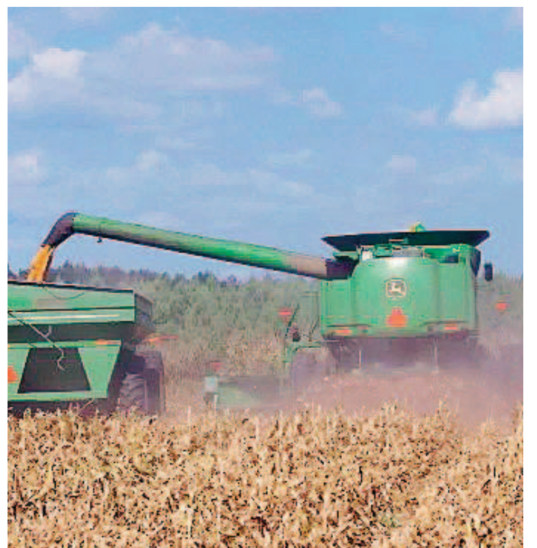
La venta de maquinaria agrícola podría verse potenciada por la decisión del BCRA.

productores para captar la mayor cantidad posible de divisas) sino que además iba en sentido contrario a todas las últimas definiciones que tomó el Ministerio de Economía en materia crediticia. Vale recordar que recientemente se flexibilizaron las normas de crédito para el conjunto de entidades que califican como Grandes Empresas Exportadoras (GEE) y se eliminaron restricciones al financiamiento en moneda extranjera, entre otras medidas que buscan facilitar el redireccionamiento del crédito bancario desde el sector público al sector privado productivo.