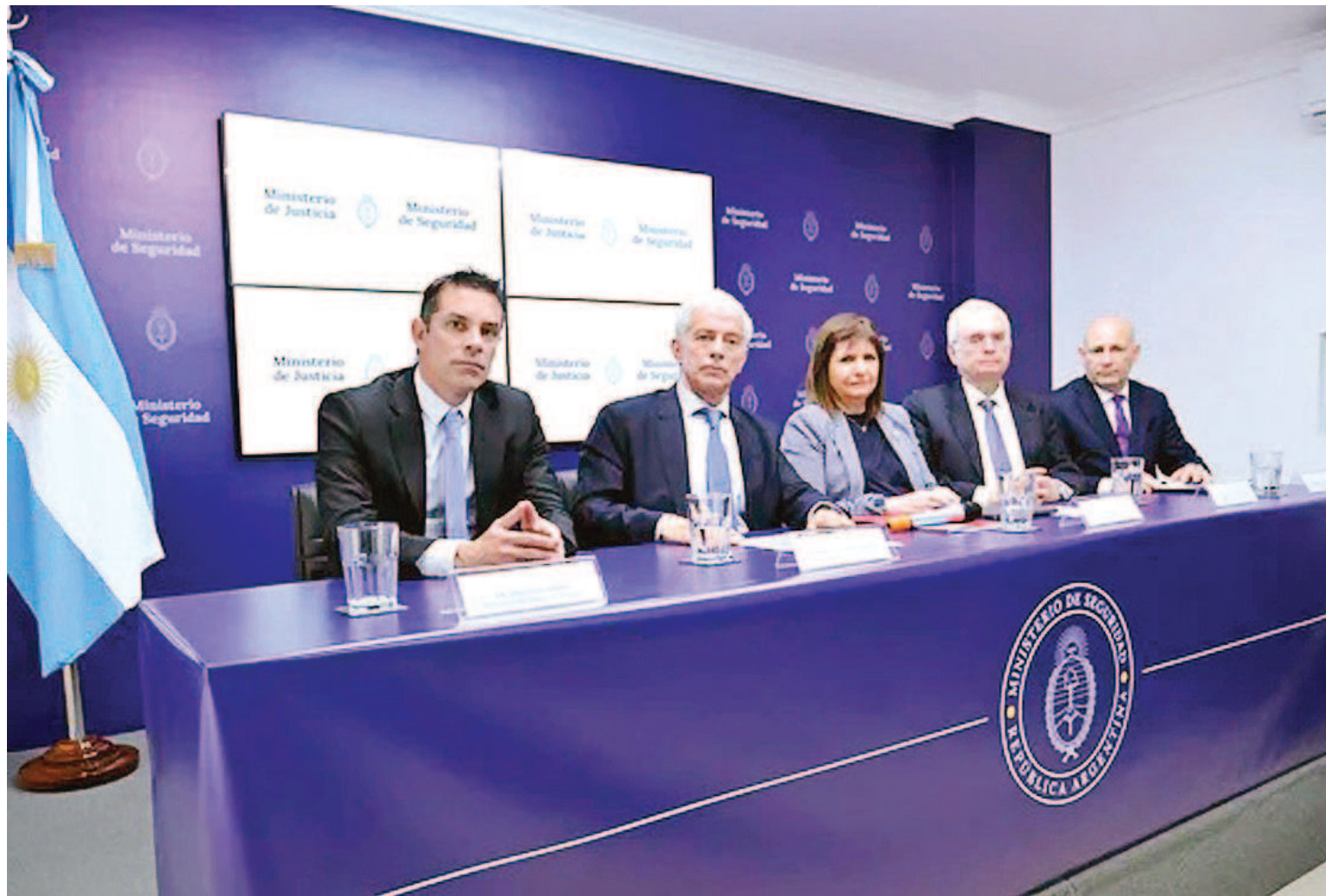
Los ministros de Seguridad y Justicia, Patricia Bullrich y Mariano Cúneo Libarona, respectivamente.