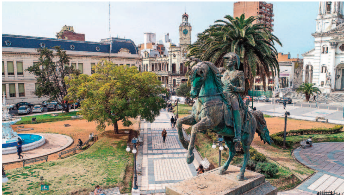
El primer podcast de la serie refiere a sitios aledaños a la Plaza 1 de Mayo, espacio central de la historia paranaense, como el edificio del Senado de la Confederación Argentina.

DETALLES. En la primera temporada, la propuesta se centra en los edificios que se construyeron en el período de Paraná como capital nacional, entre 1854 y 1861. Edificios que fueron luego refuncionalizados y destinados a otras actividades.