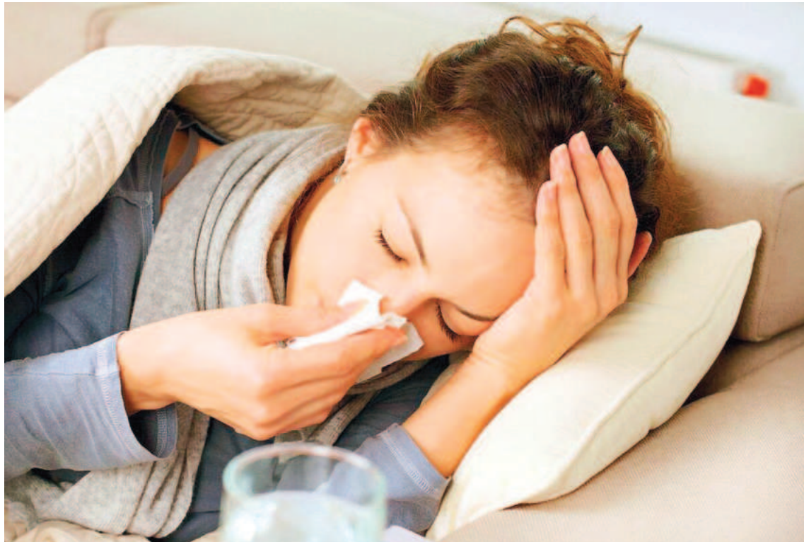
Las personas con gripe pueden dispersar el virus al estornudar o al toser.

Desde inicio de 2024 se han estudiado 577 muestras de pacientes y la mayoría correspondieron