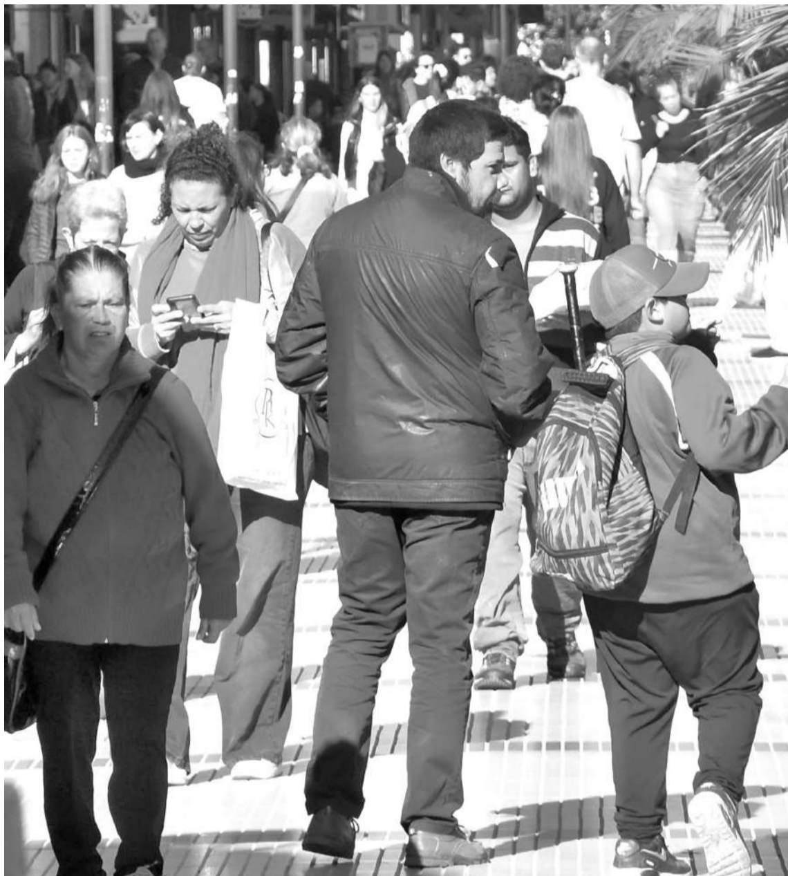
La pérdida de un niño es una tortura para su entorno familiar y para la propia víctima.

forma que, durante el año 2022, se recibieron 1.935 búsquedas de paradero de niñas, niños y adolescentes. Por su parte, en el 2023, la cifra se incrementó, registrando 3.115 búsquedas. Finalmente, hasta el 31 de marzo de 2024, se registraron 687 nuevas búsquedas", explicó Posse.