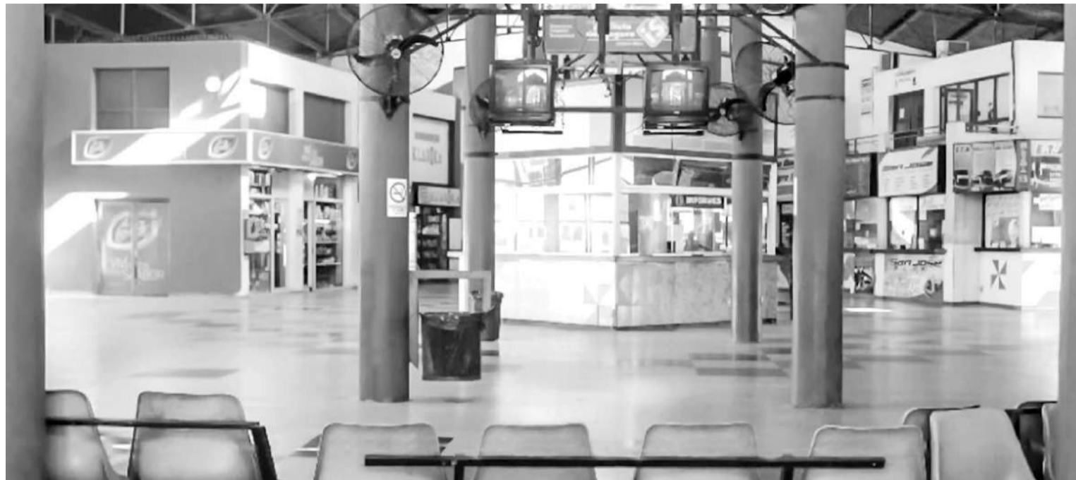
La actual Terminal fue inaugurada en 1995.