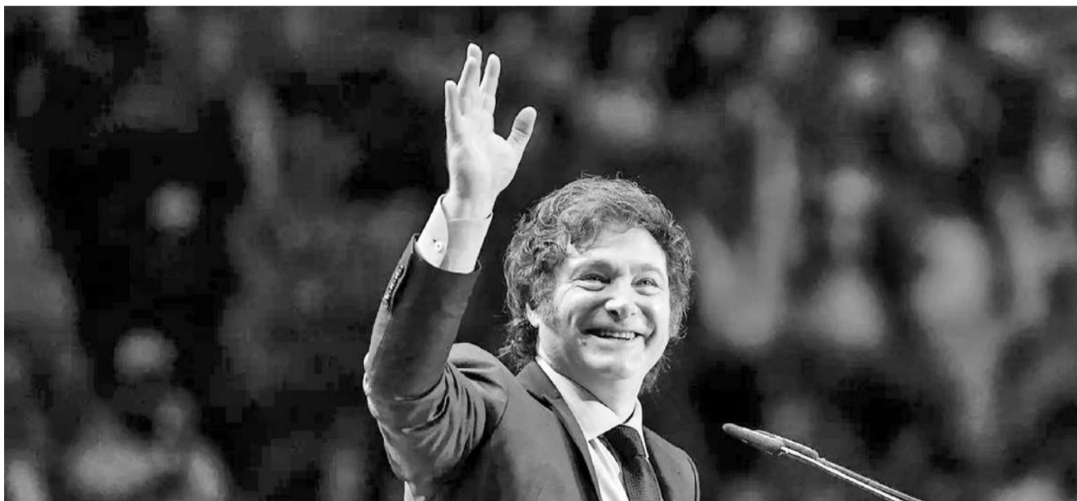
Milei celebró la aprobación de la ley Bases y ya piensa en el Pacto de Mayo que se celebrará 9 de Julio.

El consejo estará conformado por integrantes del Poder Ejecutivo Nacional, las provincias, las cámaras de Diputados y Senadores,