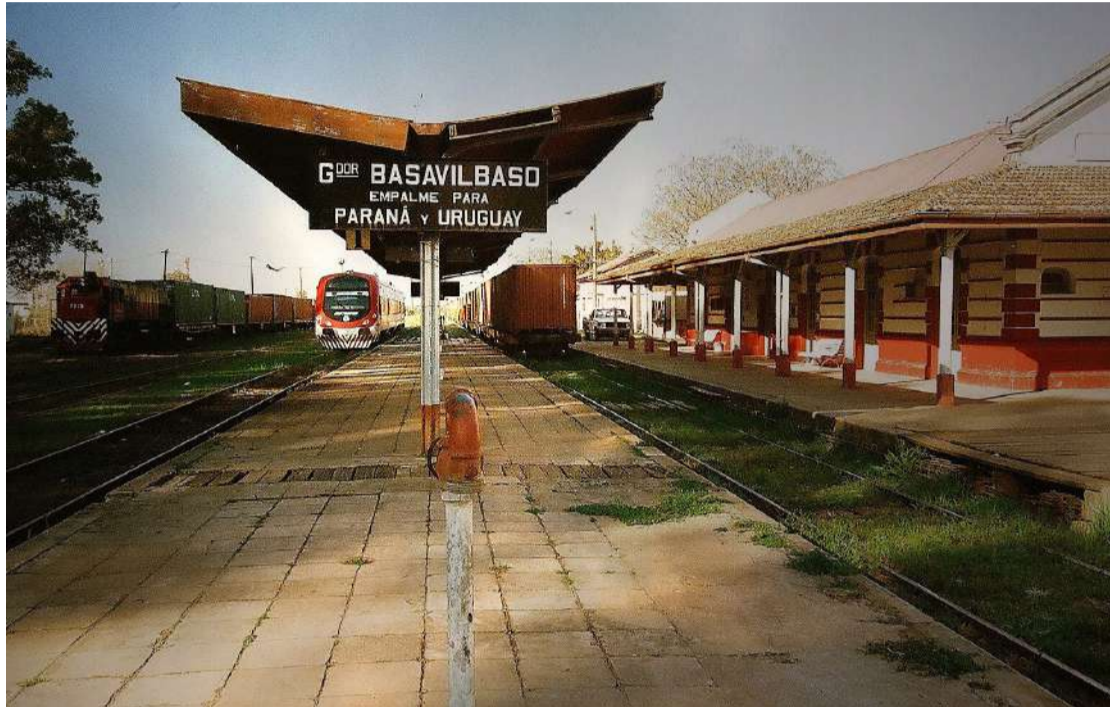
El ferrocarril, motor del crecimiento de Basavilbaso.