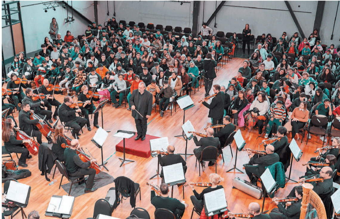
Delegaciones de 10 establecimientos del nivel primario y secundario asistieron al primero de los conciertos didácticos de la Orquesta Sinfónica, en la Vieja Usina.

los conciertos estudiantes y docentes de establecimientos educativos de Paraná, Victoria, La Paz, Ubajay, Villa Elisa, Concordia, Cerrito, Villaguay, Federación, Nogoyá, Oro Verde, Ramírez, Chajarí, Los Charrúas y Concepción del Uruguay.