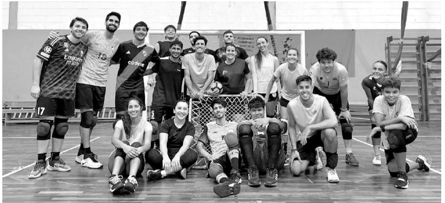
Los elencos 'Charrúas' palpitan un gran torneo en Entre Ríos, que contará además con la presencia de Argentina, Colombia, Uruguay, Chile y México

experiencia, muchas ganas de ir y participar. Estamos disfrutando el proceso de preparación; la verdad ha sido muy cambiante porque se fue sumando gente y pudimos llegar a este número de participantes, que será el mayor número que Uruguay presentará en un Panamericano".