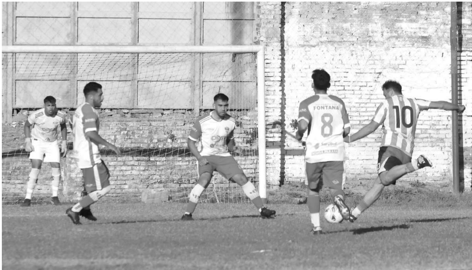
Atlético Paraná quiere defender la punta del campeonato esta tarde cuando reciba a Sportivo Urquiza en el estadio Pedro Mutio.

dad Universitaria, Oro Verde recibirá en el Derby a Atlético Neuquen Club, con dos intenciones claras. La primera buscar revancha de lo sucedido en la primera rueda y segundo lograr una nueva victoria que lo catapulte definitivamente de los últimos lugares.