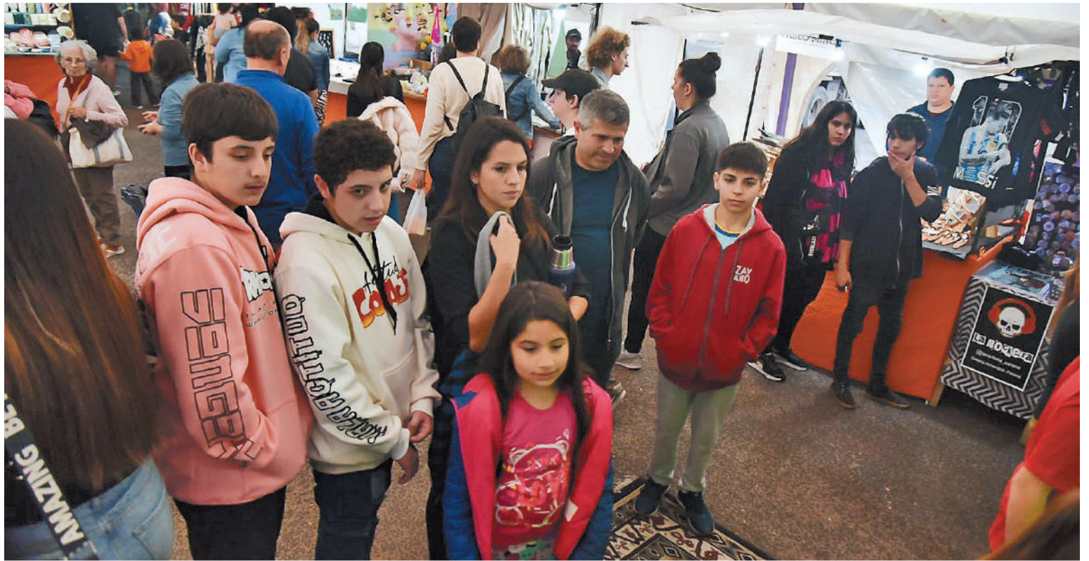
Los niños en general desconocen los riesgos que afrontan.

A nivel nacional existe el Registro Nacional de Información de Personas Menores Extraviadas: esta base oficial da cuenta de 27 menores que