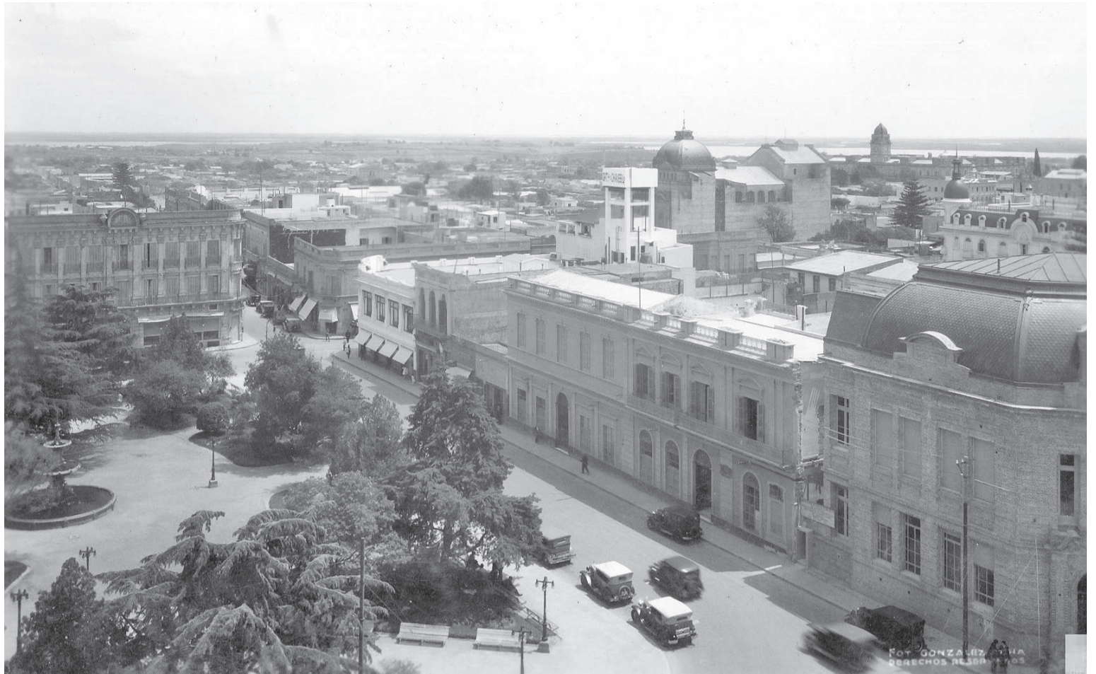
Foto que permite apreciar la primera etapa del edificio actual de la Escuela Normal y parte de la Casa de Gobierno de la Confederación.

dad, también fueron cambiando su perfil, desde el punto de vista cultural, ya que la presencia de profesores y maestras y estudiantes introdujeron una nueva dinámica, nuevos detalles a la vestimenta y a las costumbres e impulsaron nuevos temas y tonos de debate, algunos muy fuertes como el de la educación laica.