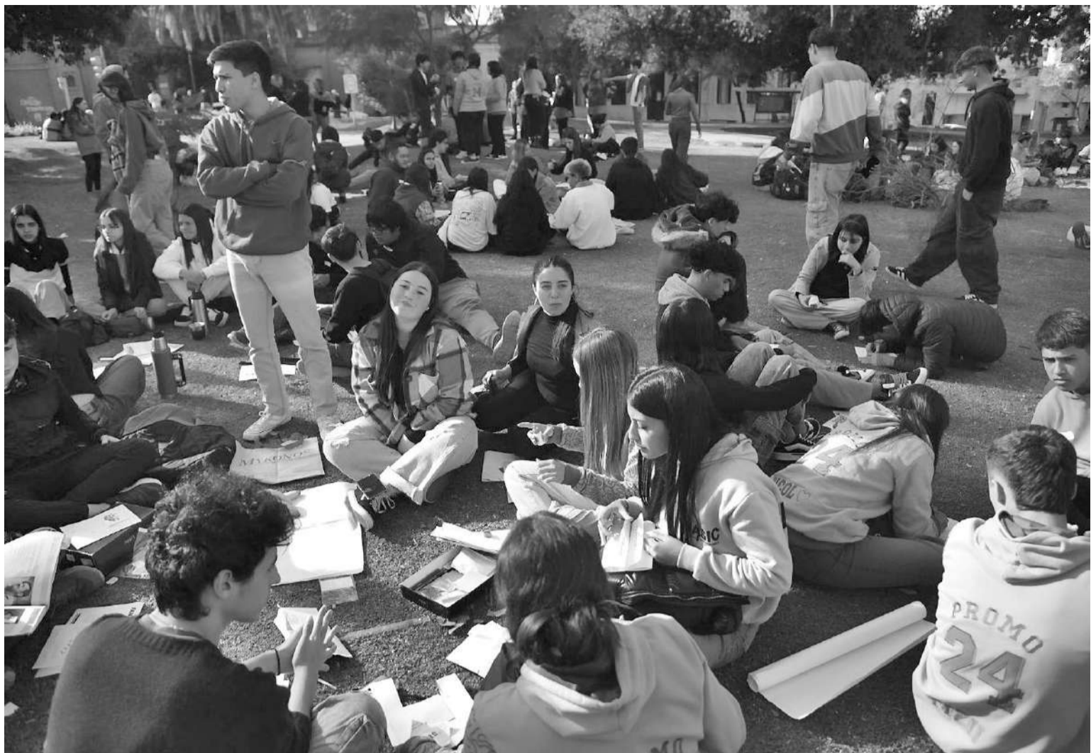
Las mujeres encuentran estrategias de vida no atadas al tradicional proyecto familiar.

Para la experta, “los programas de concientización deberían orientarse a educar y hacer visible las li-