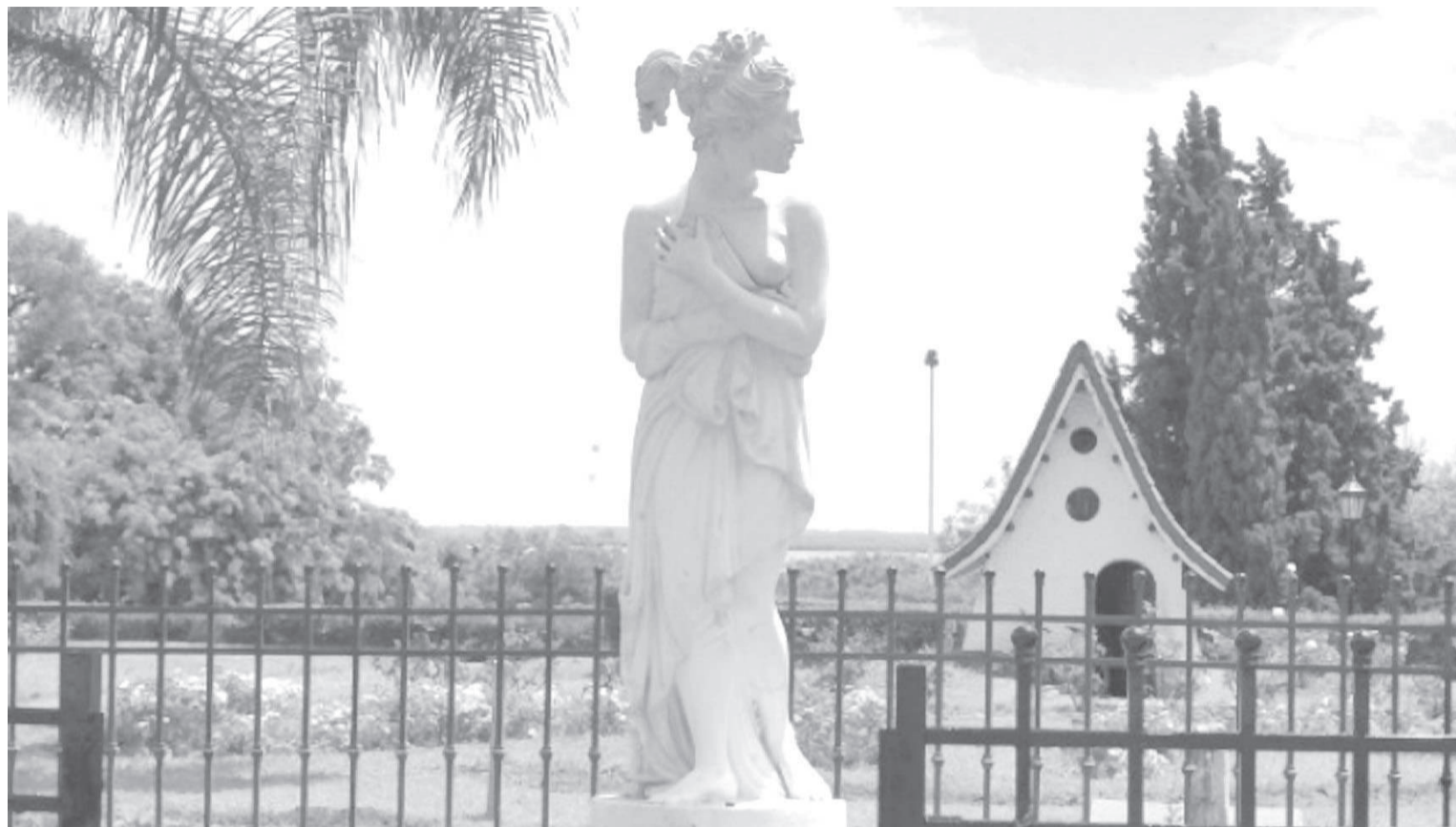
Réplica de la Venus saliendo del baño, emplazada en el rosedal (Parque Urquiza). Fue realizada por Amanda Mayor luego del robo, en 1989, de la esculpida por el italiano Pietro Bazzanti.