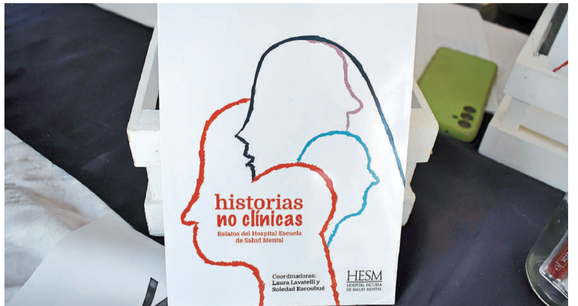
El libro se realizó a propuesta del área de Comunicación del HESM. En 150 páginas reúne escritos de más de 40 autores y autoras que forman parte de la comunidad hospitalaria.

Con feria de emprendedores, música en vivo y chocolate caliente, la presentación fue el lugar pa-