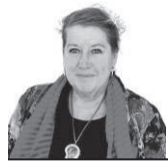
Griselda De Paoli Especial para EL DIARIO

La celebración por los 211 años de elevación a Villa de la Bajada del Paraná, brindan motivos para rescatar más de dos siglos de historia de la ciudad a partir de reconocer el legado histórico en las edificaciones ubicadas en torno a la plaza 1 de Mayo, como la Casa de Gobierno de la Confederación, en el predio que ocupa la Escuela Normal José María Torres.