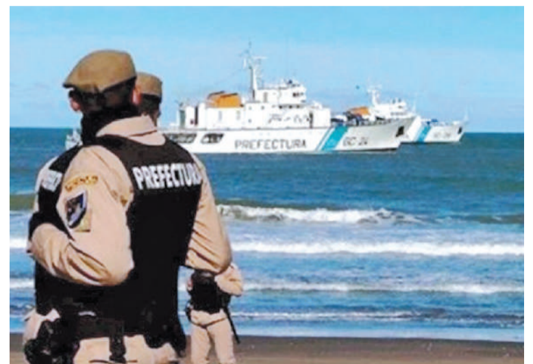
Se celebra el día de la Prefectura Naval Argentina.

PREFECTURA NAVAL. Se celebra el Día de la Prefectura Naval en conmemoración de la fecha del decreto de 1810 de la Primera Junta redactado por Mariano Moreno que designa al coronel Martín Jacobo Thompson como primer capitán de puerto del Virreinato del Río de la Plata.