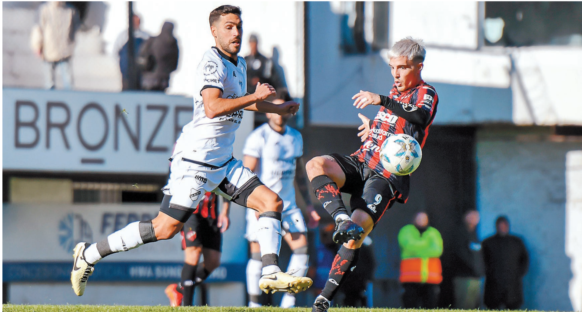
Patronato no jugó un buen partido y terminó perdiendo 1 a 0 en su visita a All Boys, por una nueva fecha de la Zona A de la Primera Nacional.