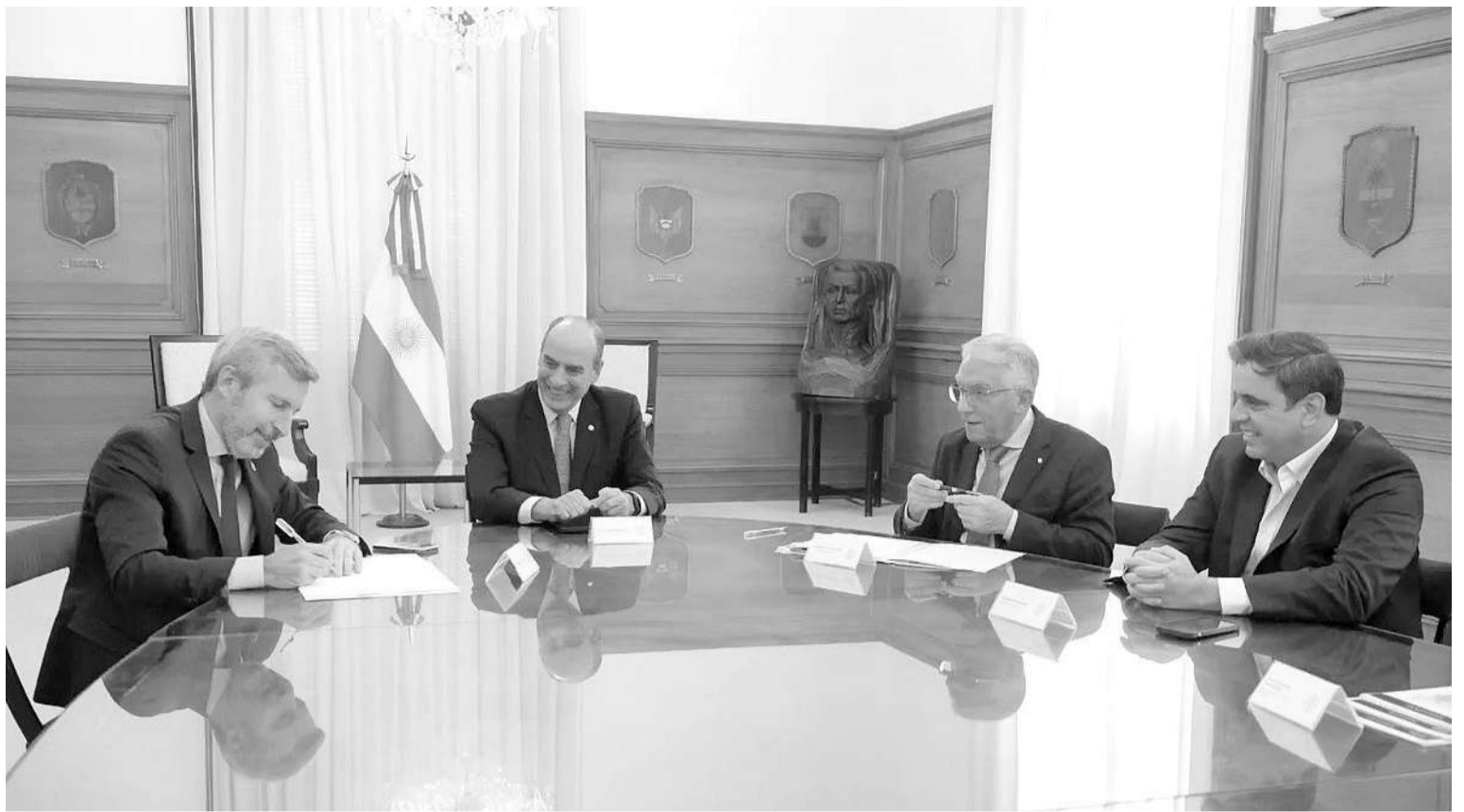
Guillermo Francos recibió de forma individual a varios gobernadores en búsqueda de consensos para que la ley Bases se apruebe y se calmen las aguas en el oficialismo.