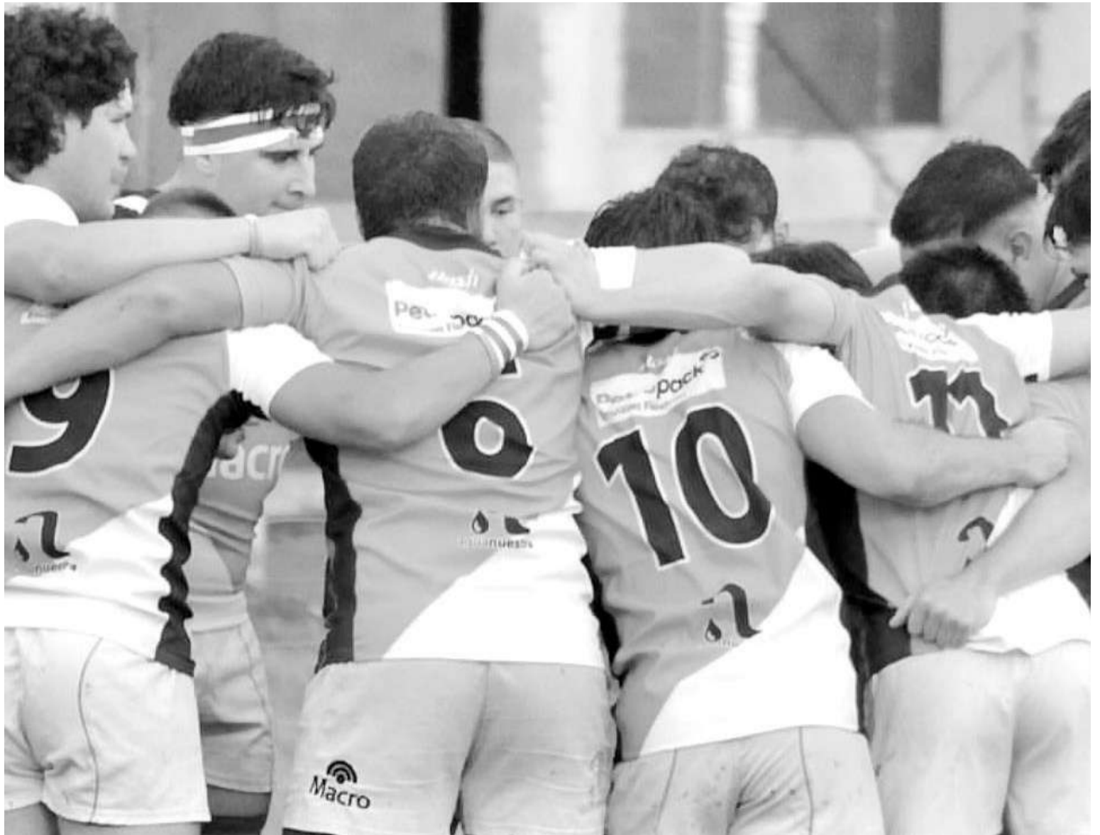
Rowing se adjudicó una valiosa victoria ante Universitario de Rosario en Paraná, para seguir sumando.

El Torneo Regional del Litoral le dio lugar ayer a su duodécimo capítulo, que ofreció la caída de Estudiantes en el Parque Urquiza ante el CRAI y el triunfo de Rowing en El Plumazo sobre Universitario de Rosario.