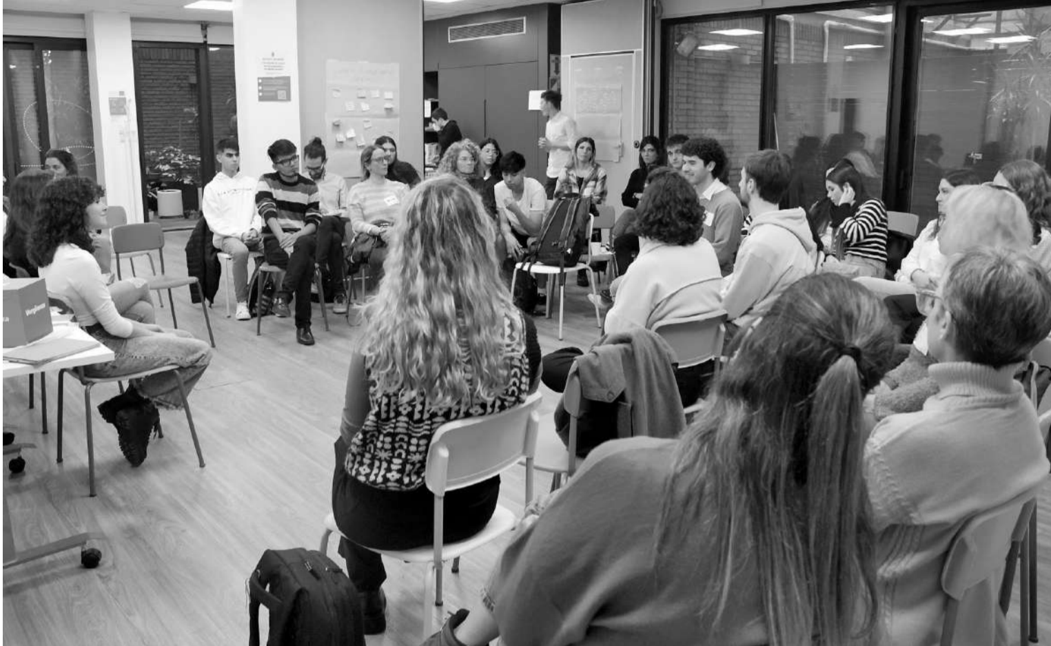
La participación de jóvenes fue una de las características de los podcasts.