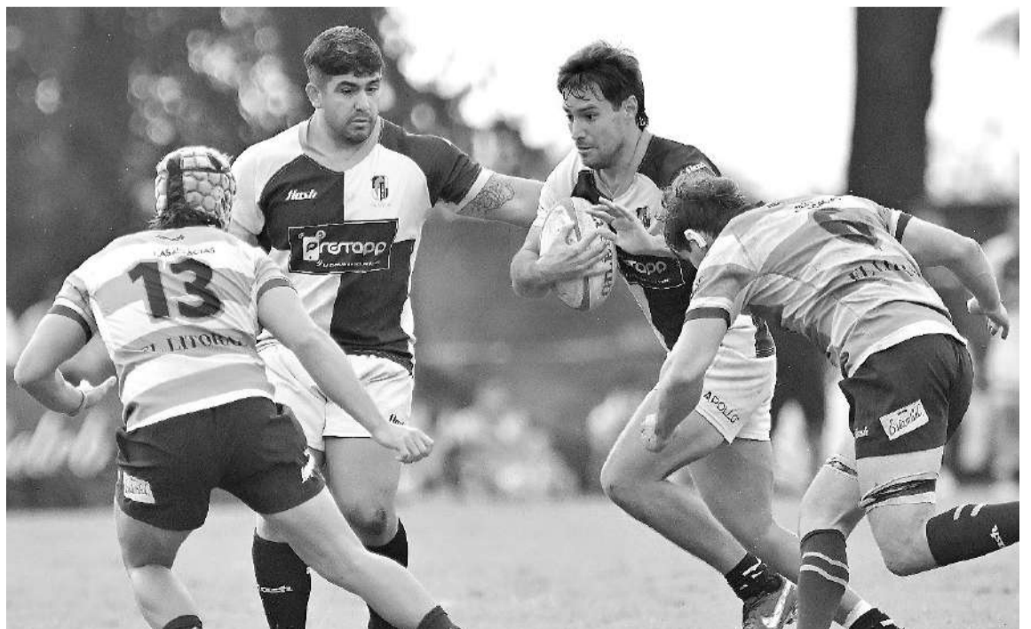
En el último minuto se le escapó al CAE ante CRAI.

En la próxima fecha chocarán: Universitario (SF)-CUCU; At. Brown-Querandí RC; Gimnasia (P)-Regatas/Belgrano (SN). Libre: Cha Roga Club.