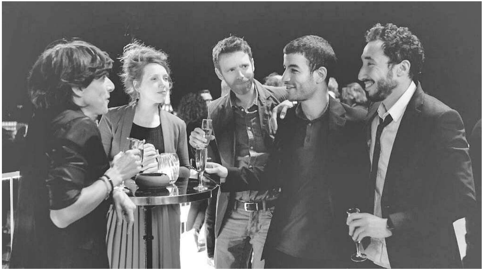
En su último filme, Arthur Rambo, Cantet se cuestiona la cultura de la superficialidad.

cumental aunque no deja de ser ficción, basada, eso sí, en un lenguaje plano, directo que exhibe la relación nada serena y apacible entre profesor y alumnos. Cantet ha confesado que "buscaba los momentos de tensión dentro del aula y ver cómo se resolvían. Los adolescentes son bastantes más listos de lo que yo era a su edad. La agresividad del profesor es una forma de reconocer que los alumnos merecen ser tratados como iguales. Al provocarles les permite pensar. Aunque yo no diría que es agresividad lo que aplica con ellos, sino ironía y verdad".