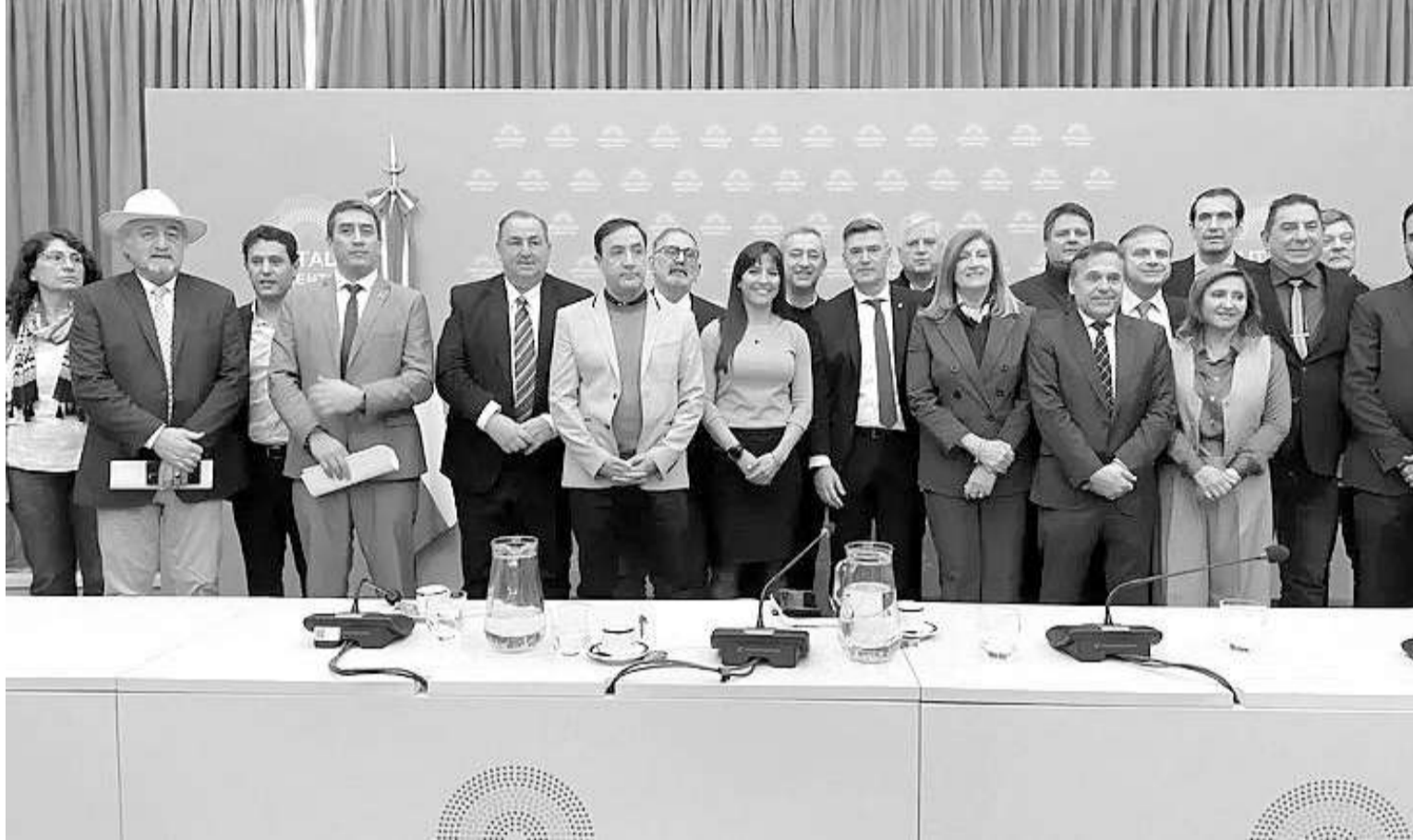
La Red Federal de Intendentes se hizo presente en el Congreso de la Nación para reclamar por los subsidios al transporte público del interior del país.