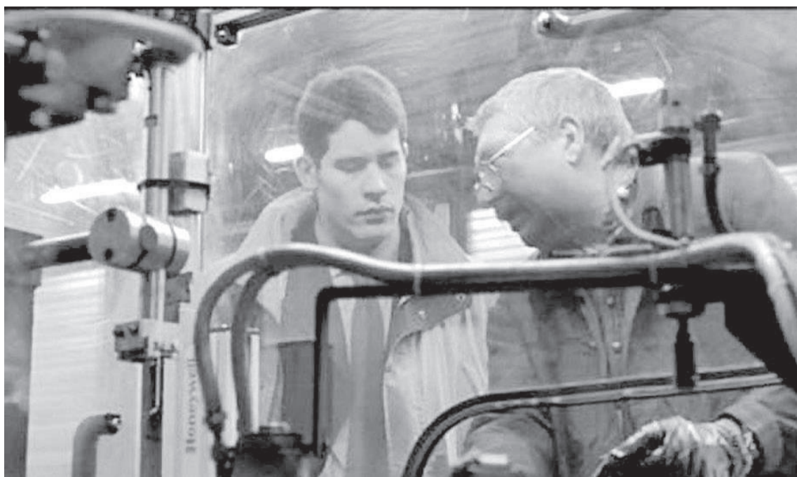
En Recursos Humanos, su primera película, Cantet le dio profundidad humana a un conflicto sindical.

“A mí lo que me interesa en la vida es el mundo que me rodea, y este mundo me plantea preguntas constantemente”