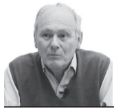
Rubén Bourlot Especial para EL DIARIO

El 7 de junio se celebra el Día del periodista. La fecha se estableció en el calendario de actividades anuales en 1938, durante el Primer Congreso Nacional de Periodistas -realizado en la provincia de Córdoba-, recordando la fundación del primer periódico nacional: la Gazeta de Buenos Ayres .