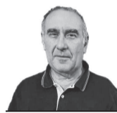
Gustavo Labriola Especial para EL DIARIO

El francés Laurent Cantet ha sido un director preocupado por el destino del ser humano en una sociedad alienante, deshumanizante y discriminadora. Deja una filmografía que refleja las preocupaciones contemporáneas. “El cine que me gusta es el que da espacio para plantear preguntas complejas”, legó.