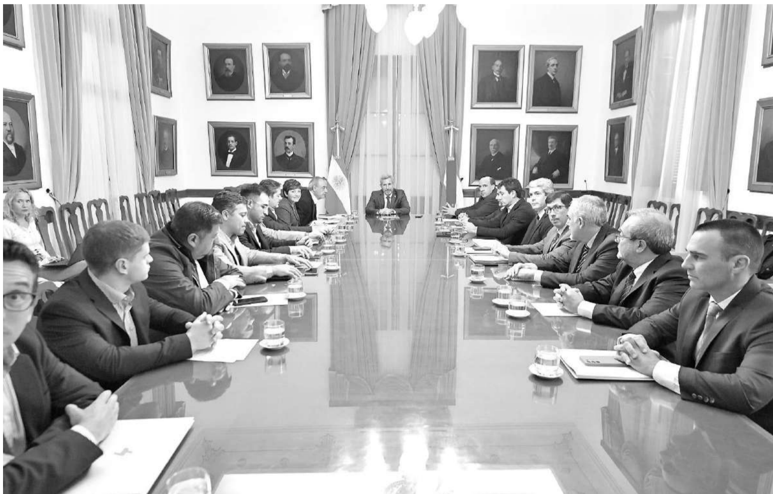
Quedó conformado el Comité Energético de Entre Ríos, con el objetivo de plantear posibles soluciones a la alta demanda que existe.