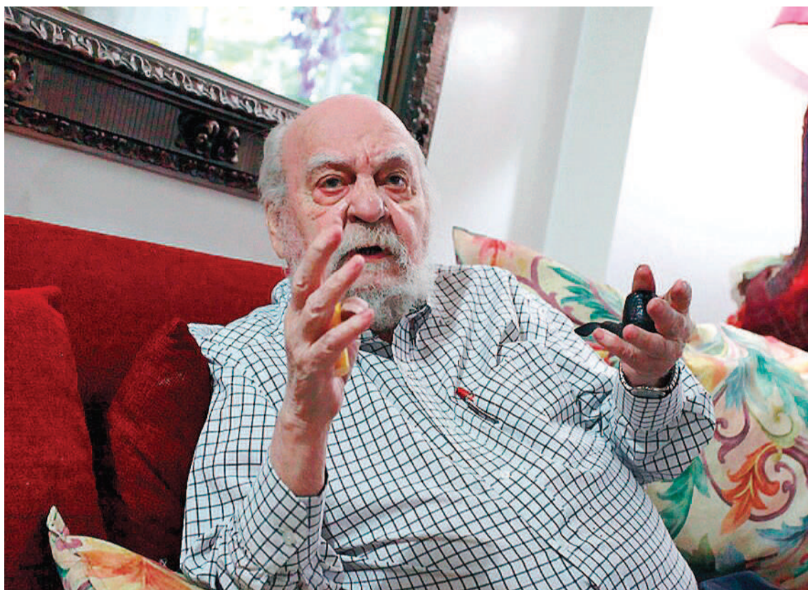
Roberto Cossa falleció el jueves, a los 89 años.

Su producción excede esa compilación, quedaron por fuera muchos más textos: Final del juicio (2015), así como Un hombre equivocado (adaptación del guion de la película El arreglo , de 1983, escrito con Carlos Somigliana, bajo la dirección de Fernando Ayala). Podría hacerse un tomo IV, que sume además la juvenil pieza titiritesca Una mano para Pedrito , una versión teatral de Martín Fierro escrita con Somigliana en los 60; la pieza en colaboración El viento se los llevó , estrenada en Teatro Abierto 1983, con Francisco Ananía, Eugenio Griffo y Jacobo Langsner; Aquellos gauchos judíos , escrita con Ricardo Halac, más canciones de Mauricio Kartun; o De cirujas, putas y suicidas , otra colaboración con varios autores. Habría que sumar su adaptación de Un guapo del 900 , de