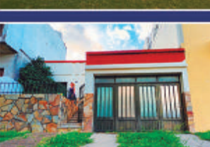
FRENTE A PATRONATO GRELLA 915 Casa. Living, cocina comedor, 3 dormitorios, balcón, cochera, baño, quincho y fondo. USD 62.000