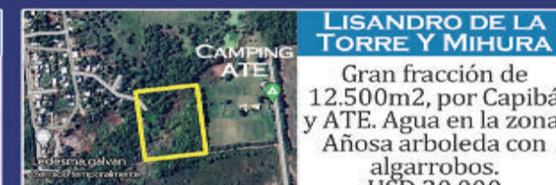
LISANDRO DE LA TORRE Y MIHURA Gran fracción de 12.500m2, por Capibá y ATE. Agua en la zona. Añosa arboleda con algarrobos. USD 20.000