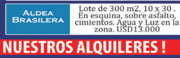
ALDEA BRASILEIRA Lote de 300 m2, 10 x 30. En esquina, sobre asfalto, cimientos. Agua y Luz en la zona. USD 13.000