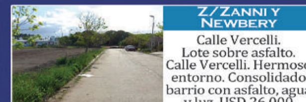
Z/ZANNI Y NEWBERY Calle Vercelli. Lote sobre asfalto. Calle Vercelli. Hermoso entorno. Consolidado barrio con asfalto, agua y luz. USD 26.000

Bellísima zona con un entorno natural hermoso. A cuadras de Blas Parera. Zona de sólido y sofisticado crecimiento. 1.057 m2. USD 38.000