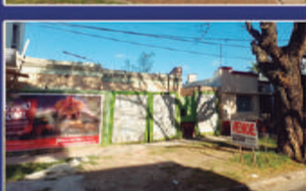
LA RIOJA 546 TERRENO EN VENTA 10x46. Sobre asfalto, agua, luz, gas. Ubicación excelente! USD 170.000