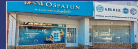
ALEM CASI RAMIREZ

Monoambiente. Sector de cocina comedor, y patio cparrilla. Luz y gas conect. $110.000 +tasas + imp