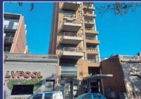
ALAMEDA DE LA FEDERACIÓN 421

Piso 12. Espectacular Piso. Sofisticado. Quincho. Ingreso ppal y de servicio. 3 baños. 3 dorm. Gran Living con balcón. Calefacción por radiadores. Cochera. USD 420.000