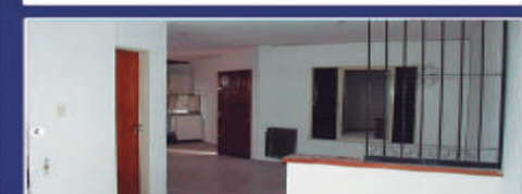
DON BOSCO Y ANTONIO CRESPO

Coc-com, cocina 4 hornallas, 1 dorm c/placard balcón, área lavadero. $180.000 +tasas+ exp