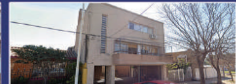
Z/HIPÓDROMO. BOULOGNE SUR MER

2 locales comerciales linderos. excelente ubicación. Amplia vidriera. $230.000 más tasas cada uno