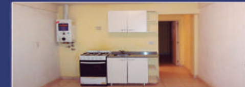
SAN LUIS 735

Cocina comedor, 1 dormitorio, baño, balcón y terraza de uso en común. $150.000 más tasas y exp