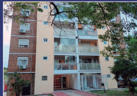
SAN MARTIN Y PELLEGRINI COMPLEJO ALTOS DE ITUZAINGÓ.

Piso 12. Espectacular Piso. Sofisticado. Quincho. Ingreso ppal y de servicio. 3 baños. 3 dorm. Gran Living con balcón. Calefacción por radiadores. Cochera. USD 420.000