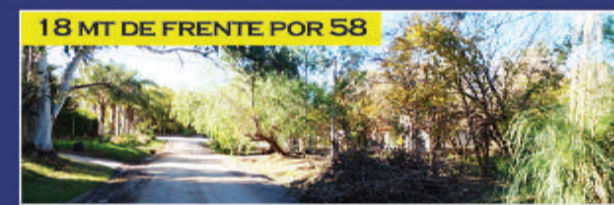
EL GUAYACÁN. TOMA VIEJA

Bellísima zona con un entorno natural hermoso. A cuadras de Blas Parera. Zona de sólido y sofisticado crecimiento. 1.057 m2. USD 38.000