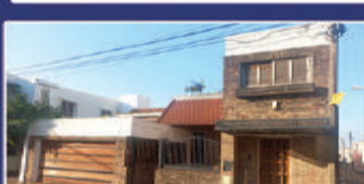
ROSARIO DEL TALA 441 Living, cocina comedor, 2 dorm, baño, cochera para 2 vehículos, patio + Depto de 2 dorm. Medidas 10 x 21,25 USD 120.000

Living comedor, cocina, 2 dormitorios con placar, baño, balcón y cochera. $280.000 más tasas