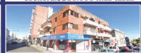
PELLEGRINI Y BAVIO

Departamento sobre calle Mejico-cocina separada, liv-com, baño, 2 dorm. $250.000 +tasas + exp