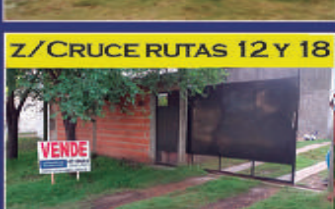
Z/CRUCE RUTAS 12 Y 18 CATAMARCA 1.861 SAN BENITO Living comedor, cocina, 2 dormitorios, baño, patio de luz y fondo, cochera descubierta. Gas env. 11,30x40. USD 40.000

Monoambiente c/sector de cocina y baño. Gas envasado. Terraza accesible. $130.000 + tasas + exp