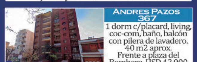
ANDRES PAZOS 367 1 dorm c/placard, living, coc-com, baño, balcón con pileta de lavadero. 40 m2 aprox. Frente a plaza del Bombero. USD 42.000