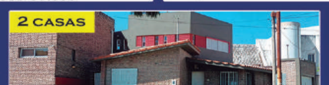
2 CASAS ZONA CLUB ESTUDIANTES USD 60.000 + 10 CUOTAS DE USD 6.000 Osinalde esq. Panamá. 2 casas independientes. 1º casa: 1 dorm, living, cocina comedor, patio. 2º casa: 3 dorm, cocina comedor, ambas tienen jardín y cochera. USD 60.000 + cuotas