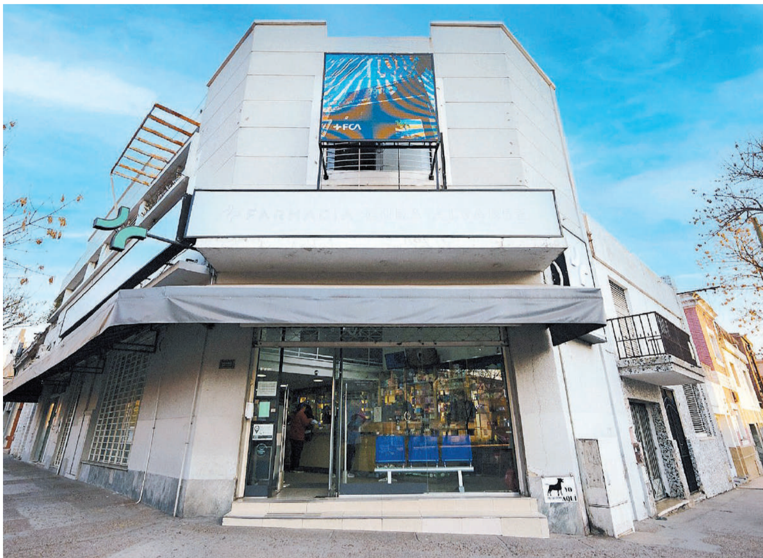
La sede central de Farmacia Cura Álvarez, en Carbó y Perón.

hemos ido expandiendo nuestra presencia en la ciudad, con nuevas sucursales que nos permiten llegar a un mayor número de vecinos. Esta expansión es un reflejo de nuestra misión de brindar atención de calidad, y estamos emocionados de crecer y servir cada vez a más personas.