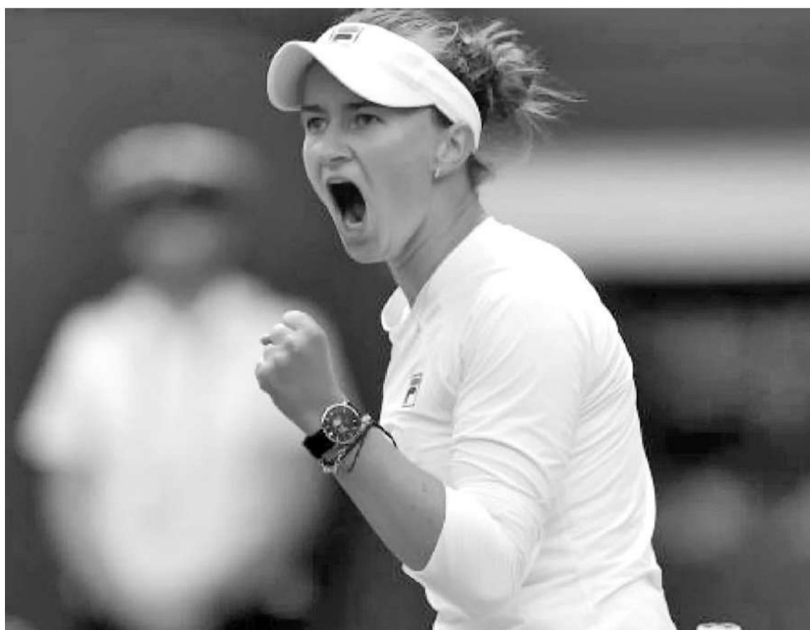
La tenista checa Barbora Krejčíková le ganó en tres sets a la italiana Jasmine Paolini en la final de Wimbledon y obtuvo su segundo título de Grand Slam.

El joven español viene de ganar Roland Garros el mes pasado y apunta a pelear por el N°1 del mundo en los próximos meses.