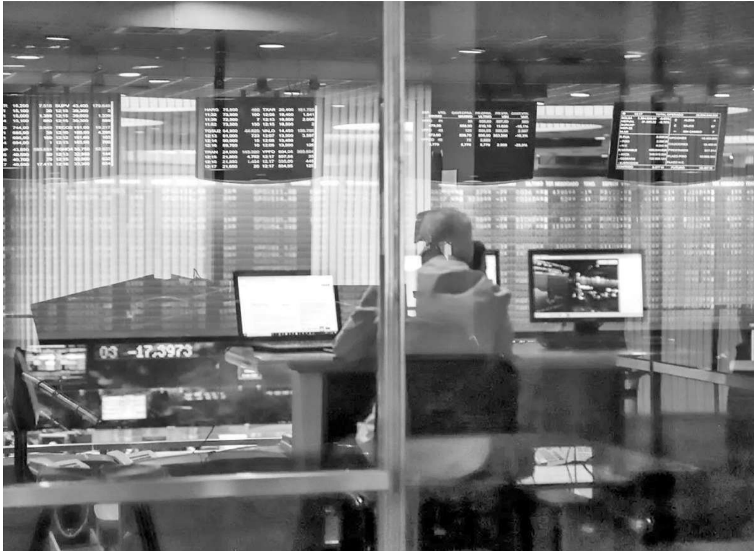
El nuevo paso en la política monetaria genera dudas entre los economistas.