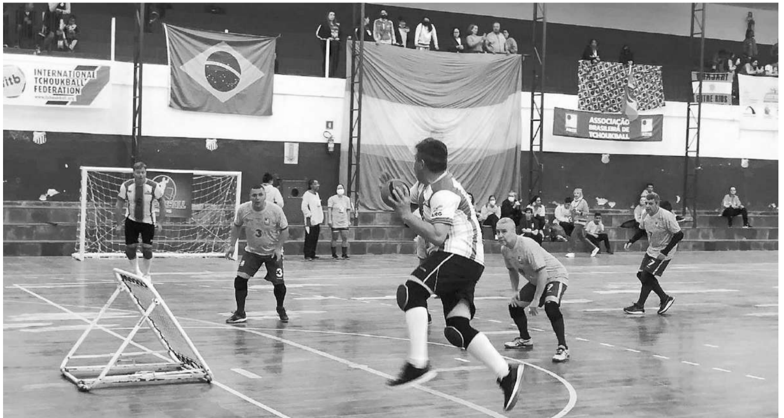
El Tchoukball, un deporte que crece desde el norte entrerriano y sur de corrientes, expandiéndose hacia el resto del país.

El VI Campeonato Panamericano de Tchoukball se pondrá en marcha este domingo, extendiéndose hasta el miércoles. Distintos seleccionados continentales animarán el evento que contará con acción desde las categorías Sub 13 hasta Masters.