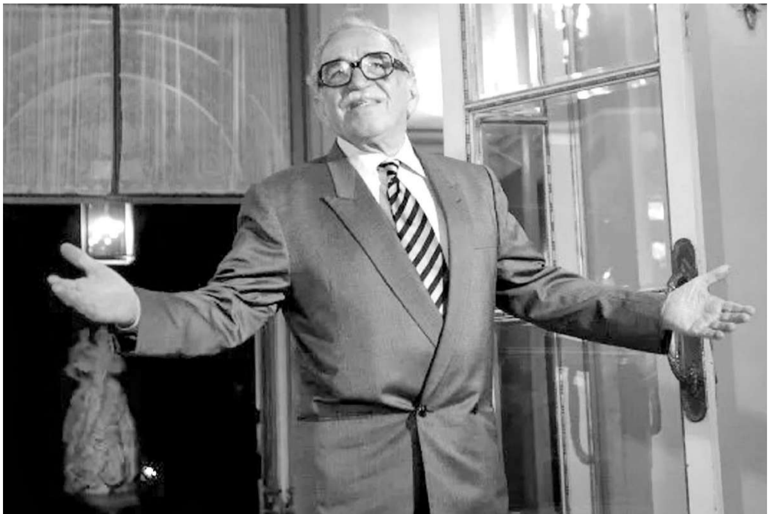
Sus seguidores dirán si En agosto nos vemos está a la altura de la obra de García Márquez.

tá a disposición de los lectores. En Agosto nos vemos es la historia de una mujer que en agosto de cada año toma el transbordador que la acerca a una isla donde está enterrada su madre, para así visitar su tumba, en el día del aniversario de su muerte. Había sido voluntad de su madre ser enterrada en esa isla, que el autor no identifica, en la que conviven hoteles lujosos con personas vulnerables viviendo en condiciones de pobreza extrema.