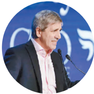
Luis Caputo, ministro de Economía

“A la inflación le estábamos ganando por puntos pero ahora le daremos un nocaut”