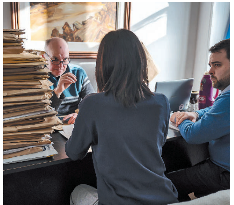
El viernes 25 de octubre se sabrá quién es el ganador del Fray Mocho edición 2024, dedicada al cuento.

tos que, de acuerdo al artículo número 5° del reglamento, para concursar se debe presentar un conjunto de cuentos, originales e inéditos, -es decir que no podrán registrar difusión total o parcial por los medios de comunicación masiva con anterioridad o mientras dure el trámite del concurso-, se-