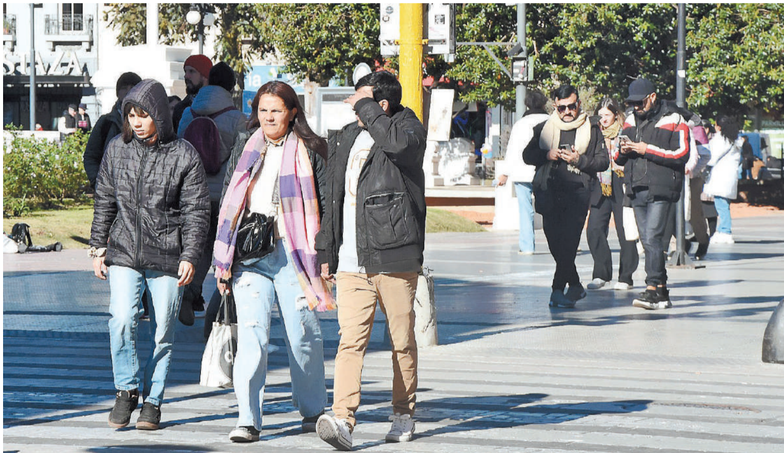
El nivel de consumo de los sectores asalariados se redujo a lo indispensable.