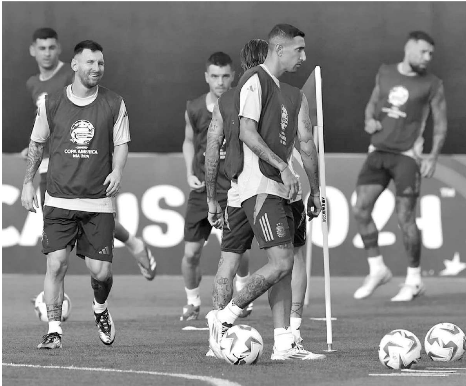
Lionel Messi jugará una nueva final con la Selección Argentina, en el que será el último partido de Ángel Di María con la Celeste y Blanca.

do fueron organizadores y le ganaron a México en la final.