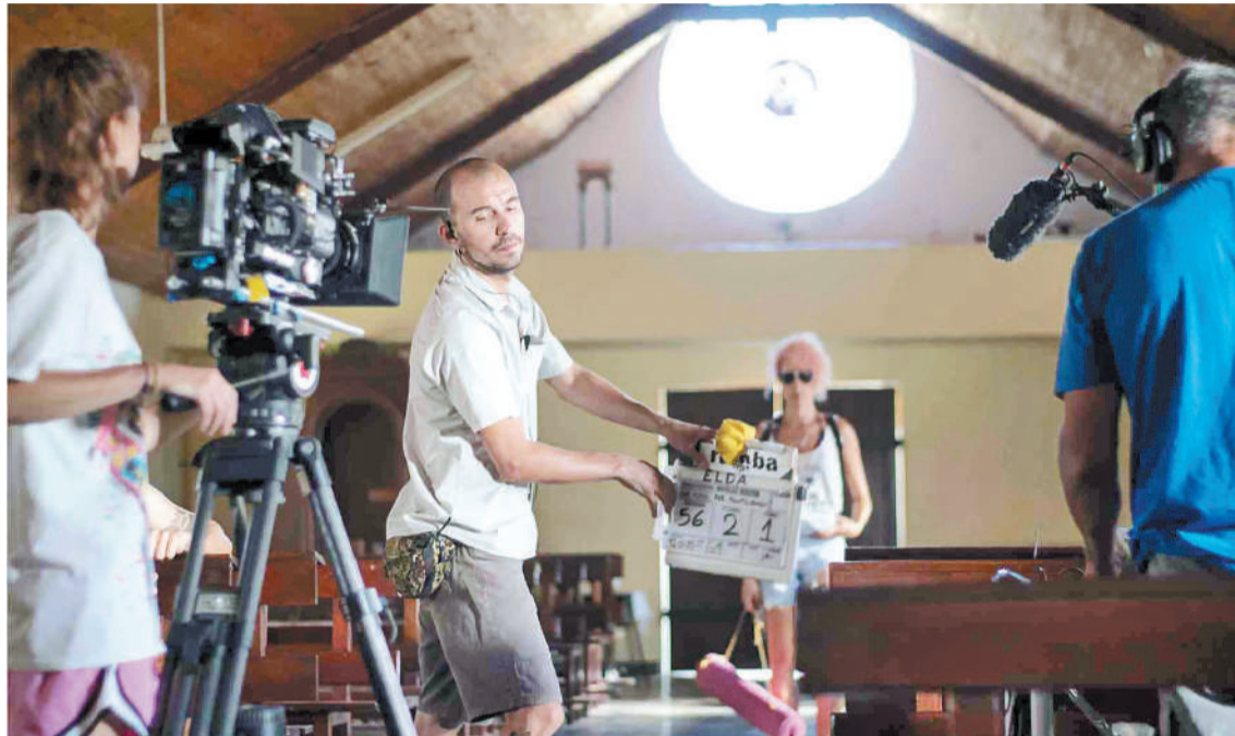
Entender las gramáticas es básico para producir mensajes con sentido.

Esos saberes son útiles tanto para que el que realiza como para el que lo consume, lo que en los hechos es la cara y ceca de un mismo proceso, gracias a que muchos medios de co-