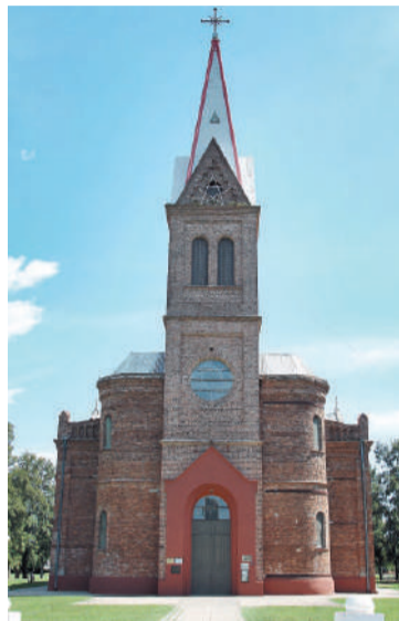
Vista exterior del templo de Santa Ana, en Santa Anita.