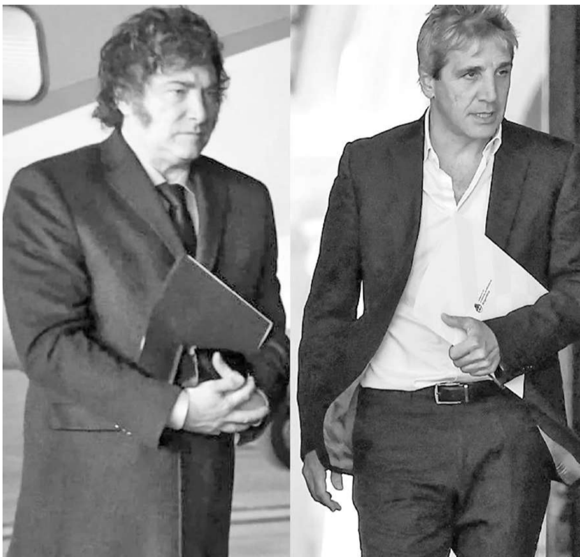
El Presidente y el ministro siguen minuto a minuto las variables de la realidad económica argentina.

El mercado estará muy atento a los primeros pasos de esta etapa de "recrudescimiento monetario" anticipada por el Gobierno, que necesitará mostrar resultados rápidos, para que la "mano de nocaut" no termine siendo una disputada pelea por puntos