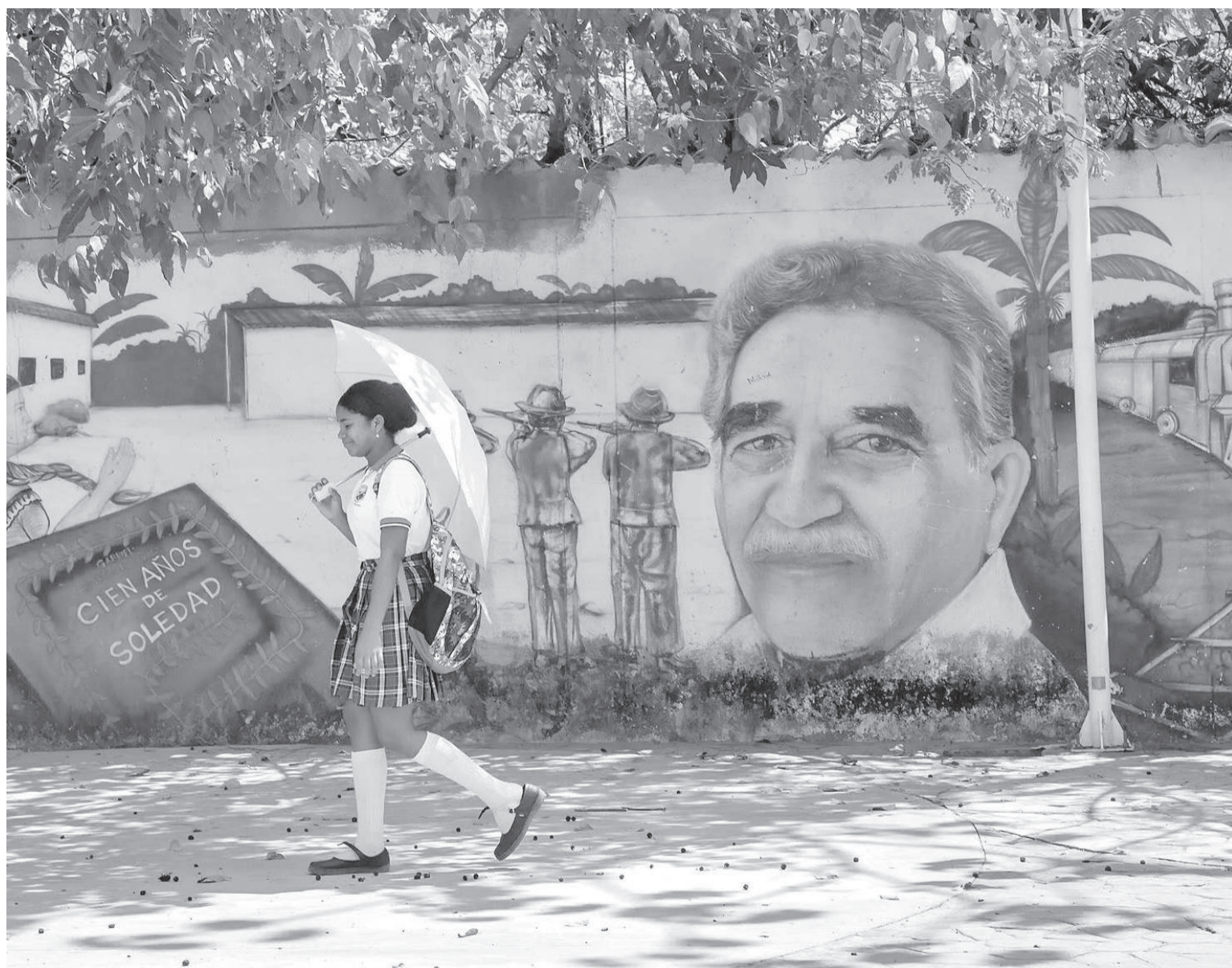
La influencia de García Márquez sigue encendida en la memoria de sus lectores.

a la novela que nos referimos, titulada En agosto nos vemos . El proyecto, que lo acompañó en sus últimos meses de vida, se edita de manera póstuma, con anuencia de los hijos del escritor, confiados en que si los lectores celebran esta nueva publicación ellos recibirán, por fin, el perdón paterno.