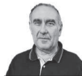
Gustavo Labriola Especial para EL DIARIO

La publicación de una novela que Gabriel García Márquez había propuesto destruir, puso en el tapete el debate respecto a si sus seguidores la compararán con el resto de su producción o, por fuera de los resultados concretos, la asumirán como un testimonio de la laboriosidad que sostuvo al colombiano, incluso cuando la enfermedad lo empezó a limitar física e intelectualmente.