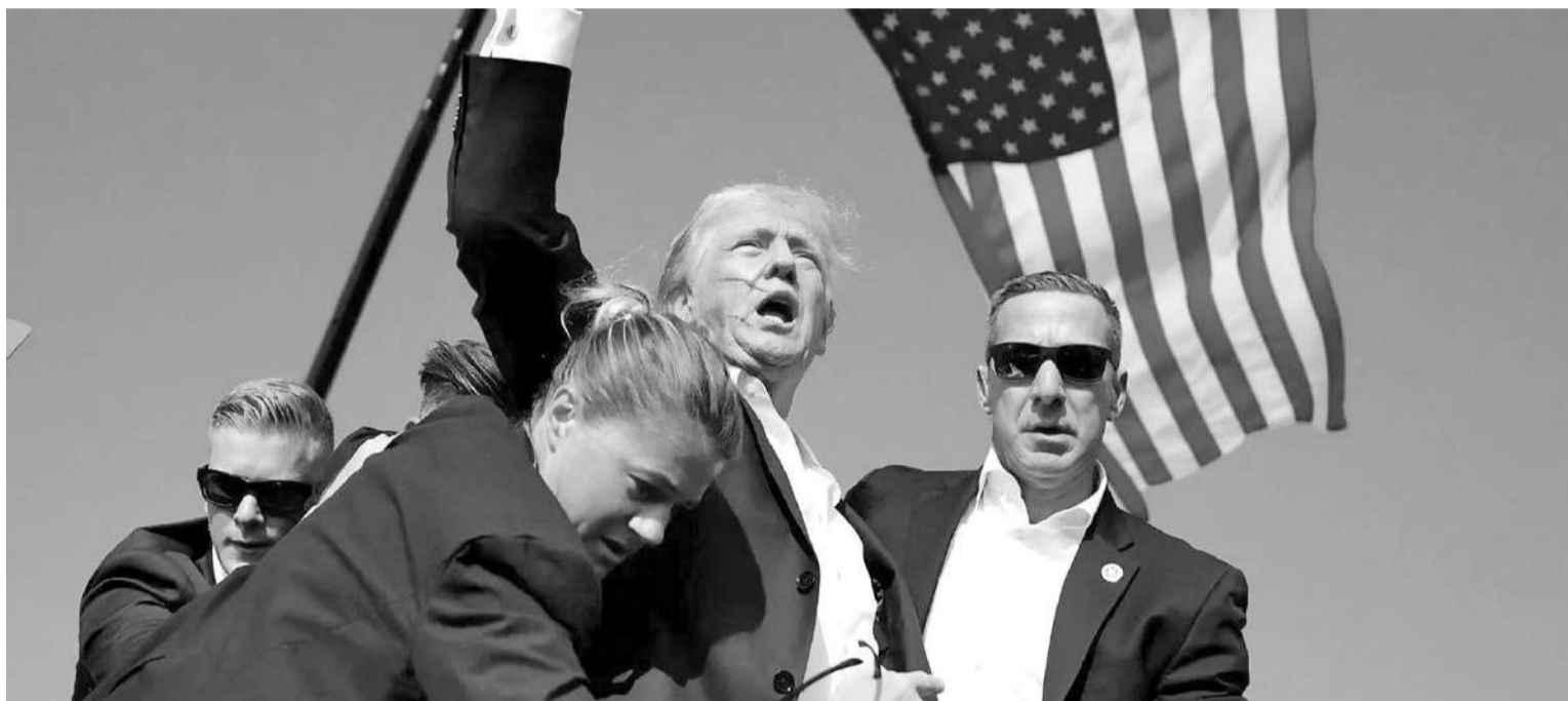
Un disparo rozó a Trump a la altura de la oreja derecha, pero está fuera de peligro.

ABATIDO. Además, se supo que el tirador del acto del ex presidente Donald Trump durante el acto de campaña que encabezaba en Pensilvania fue abatido por las fuerzas de seguridad, según confirmó el fiscal del distrito del condado de Butler, Richard A. Goldinger.