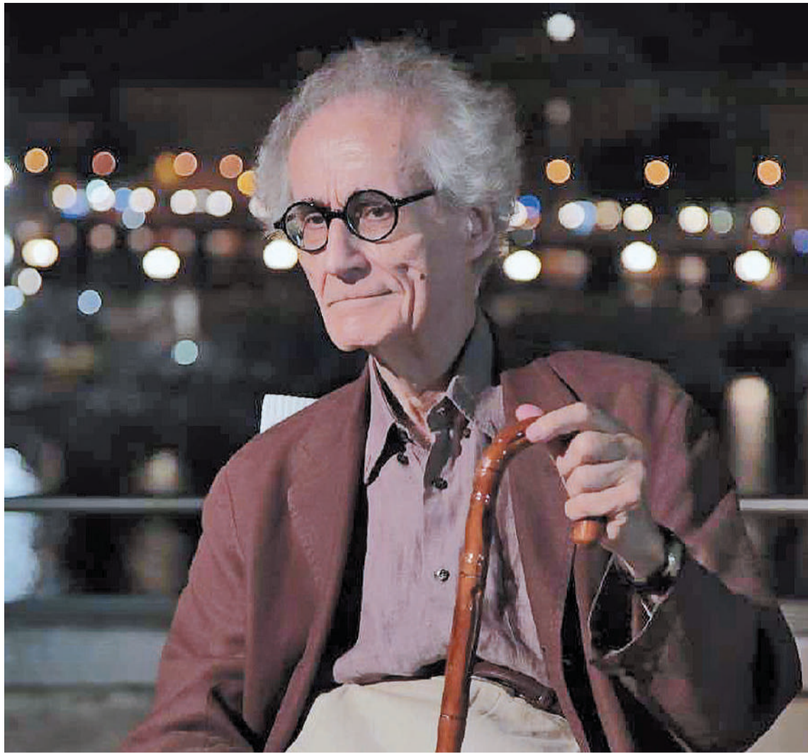
Para Canfora, al mundo lo gobierna un "fortísimo poder supranacional, no electivo, de carácter tecnocrático y financiero".

Durante un breve período la UE pareció ser independiente, pero