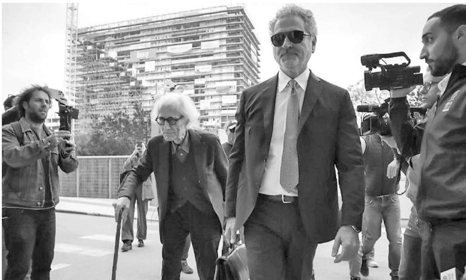
El nazifascismo “nunca murió” asegura el académico italiano Luciano Canfora.

1945), una suerte de protectorado nazi en el norte italiano, gobernado por Mussolini, antepasado directo de Meloni. Allí rigió el terror. Dicen los que apoyan a Canfora: “Ese terror es al que los italianos se refieren cuando comúnmente hablan de ‘nazifascismo’. No se puede negar esta conexión”.