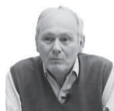
Rubén Bourlot Especial para EL DIARIO

EL DIARIO, en su edición del 7 de julio de 1938, anunciaba la presentación en el teatro 3 de Febrero de Paraná de la “artista eximia” Camila Quiroga. El 9 de julio en tanto se presentaría con una obra en la velada de gala en conmemoración de la independencia.