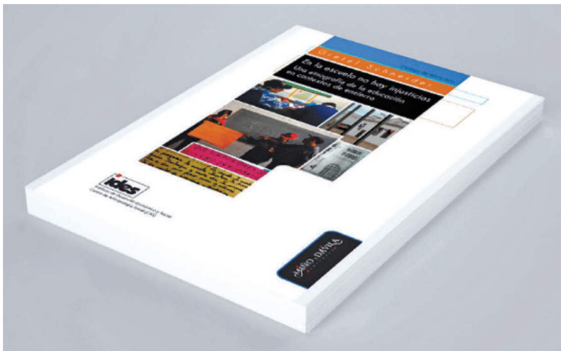
El 14 de agosto a las 18, en el auditorio Rodolfo Walsh, se presentará el libro “En la escuela no hay injusticias”, de Gretel Schneider.

torial Miño y Dávila el cual lanza una apuesta más allá de la dicotomía rehabilitación/ enfoque de derechos.