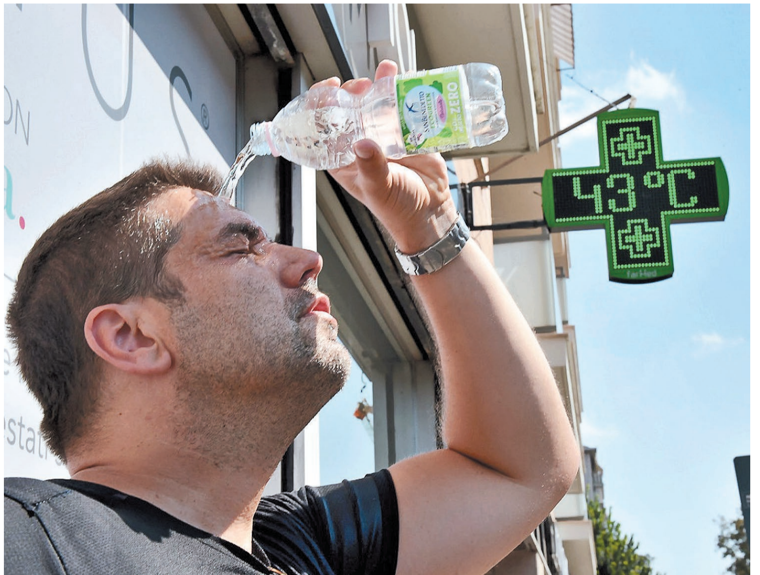
Las olas de calor son cada vez más recurrentes y con mayor intensidad en todo el mundo.

“En 2015 comenzamos esta línea de investigación, ya que no había datos o estudios sobre esta relación entre la temperatura ambiente y la fertilidad masculina en la región, salvo un dato aislado de Chile. Tomando datos del Servicio Meteorológico Nacional entre 2005 y 2023, encontramos una