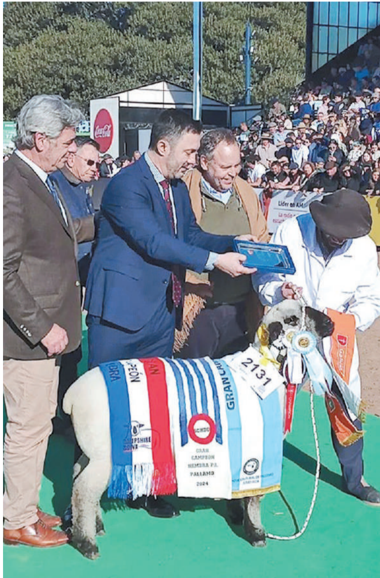
El ministro de Defensa Luis Petri ingresó a la pista central para participar de la ceremonia de premiación de los grandes campeones.

Si bien la eliminación a los derechos de exportación están en el