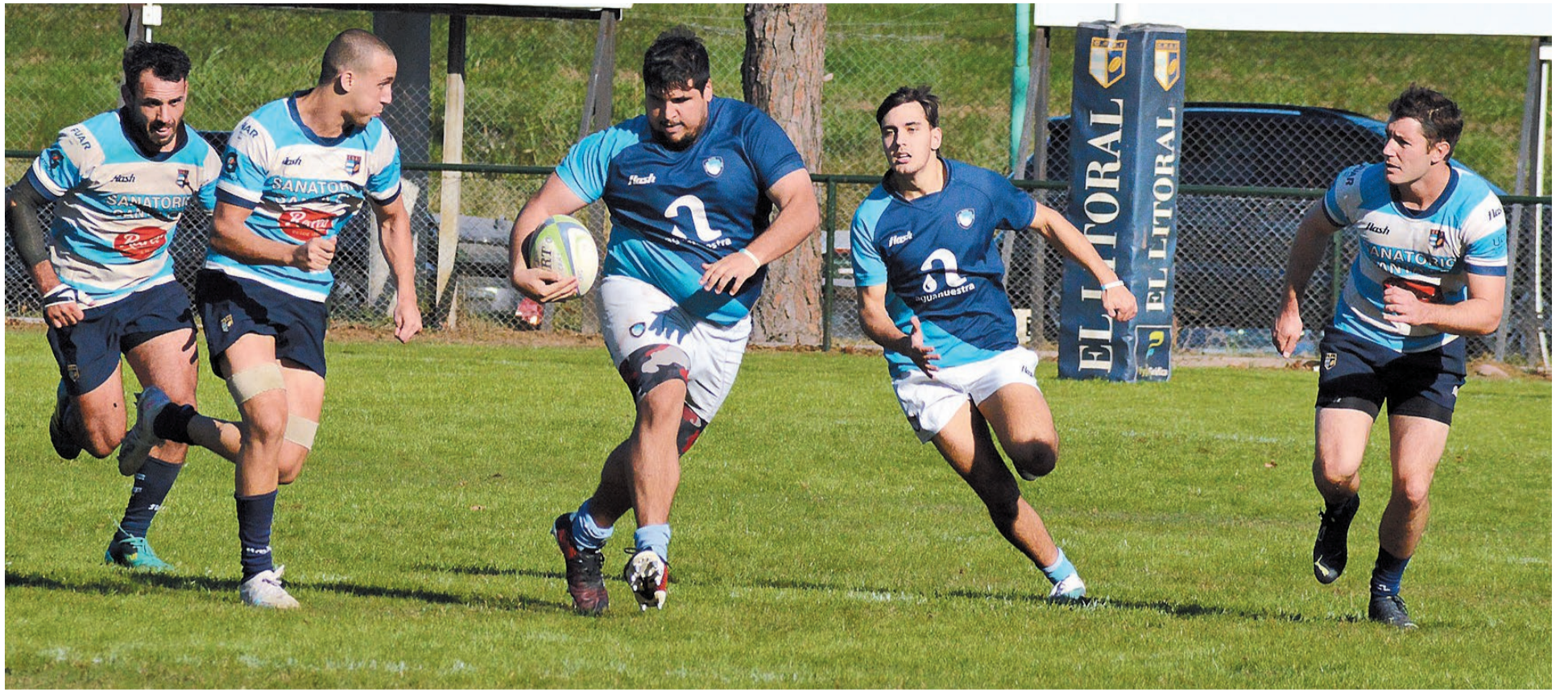
Rowing, de ganar, posibilitará el ingreso del CAE a semifinales del 24° Torneo Regional del Litoral.