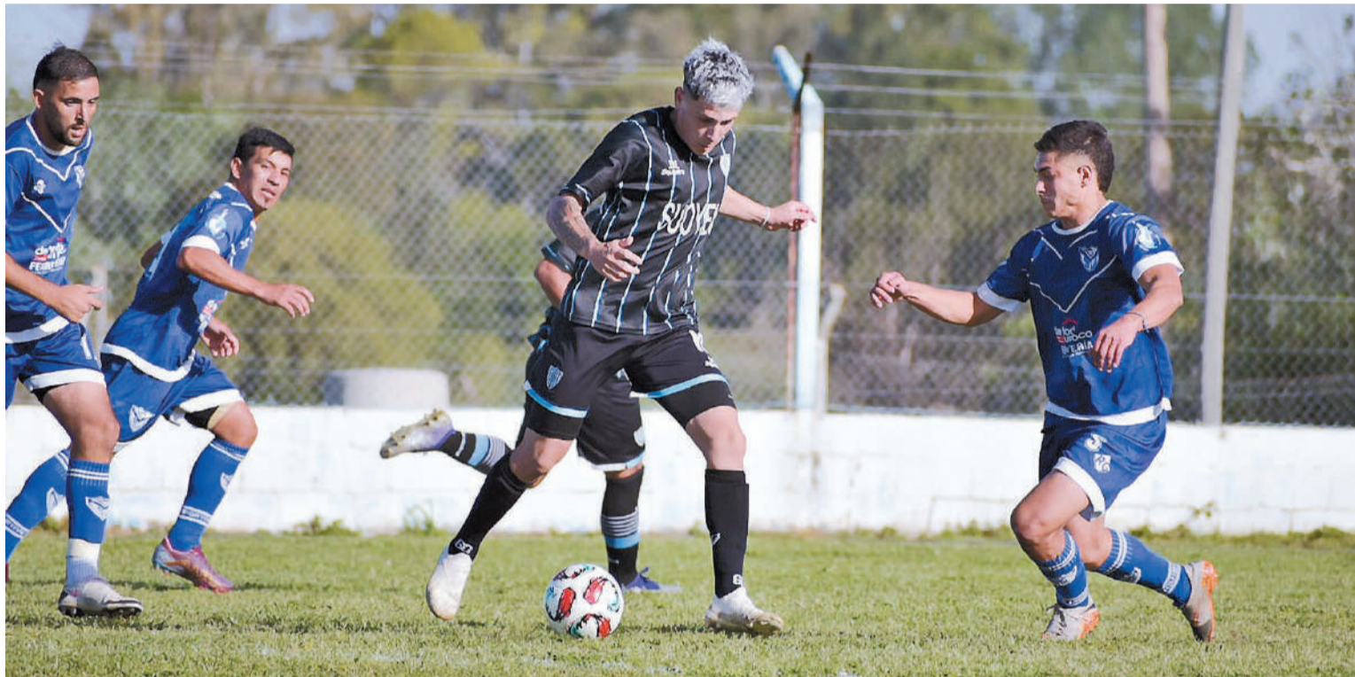
Sportivo Urquiza y Peñarol se verán las caras este sábado desde las 15,30 en La Floresta, reeditando el denominado clásico "más popular".