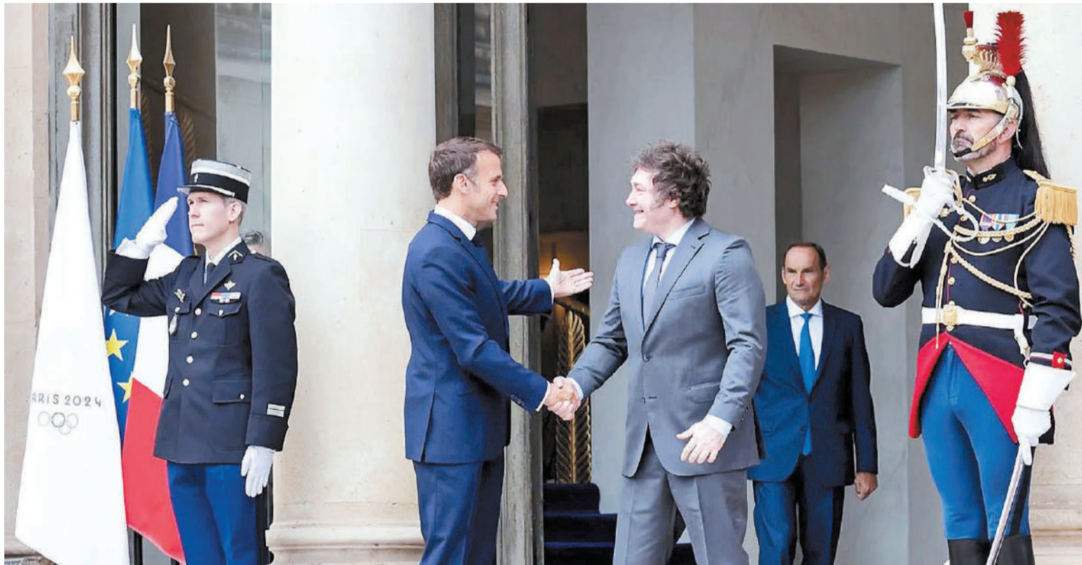
Los mandatarios se reunieron durante más de una hora en el Palacio del Eliseo.