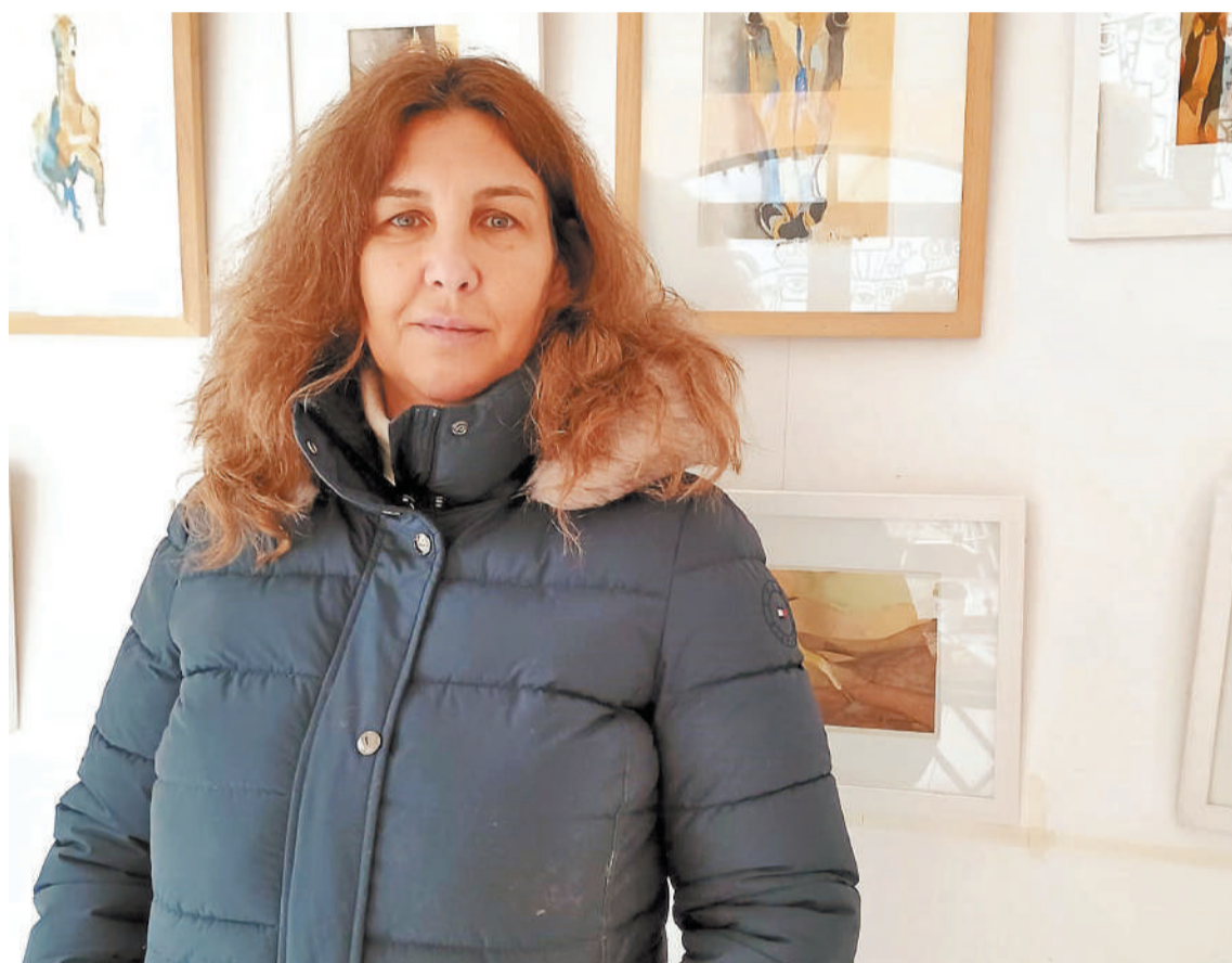
La artista cordobesa, trabaja en acuarela, técnica que prefiere porque abre a la posibilidad -que se introduce azarosamente en la obra- de crear también a partir "del error".

La artista cordobesa, nacida en Sacanto, donde reside, estuvo en Paraná para participar en la apertura de Facetas, una muestra en la que expone acuarelas y óleo. Los trabajos pueden apreciarse en la galería GAP 18.