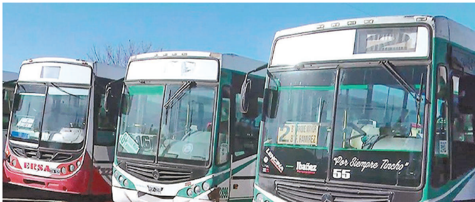
Los colectiveros continúan realizando medidas de protesta.

reclamo que está haciendo el gremio hacia la empresa de un acuerdo salarial que teníamos firmado el 23 de mayo".