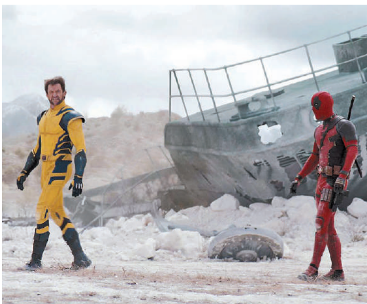
Deadpool & Wolverine, estreno, diariamente en Cine Círculo.

Hoy desde las 19:30, Vinos con libros y cuentos. Presentación de libros y narradoras. En la Alianza Francesa (Andrés Pazos 156). Contribución al arte $6500. Reservas al 3435125808.