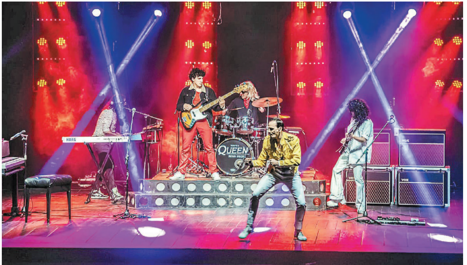
Reina Madre, tributo a Queen se presentará hoy en el Teatro 3 de Febrero.

Los sábados 27 de julio y 3 de agosto, se podrá disfrutar de la obra Parodia. Bilogía en dos colores. Dirección: Raúl Eusebi. En el marco de la Muestra Talleres del Teatro del Callejón 2024 (Alameda de la Federación 453). Reservas