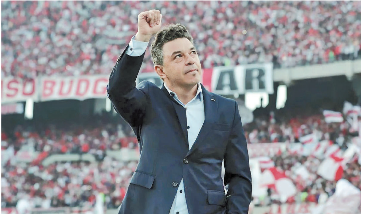
Marcelo Gallardo estuvo un año y medio fuera de River Plate y todo indica que volvería para dirigir al equipo, que hasta ayer fue conducido por Martín Demichelis.

Pero estos logros no parecen nada al lado de lo que hizo como director técnico, ya que llevó al "Millonario" al título en dos Copas Libertadores, una Copa Sudamericana,