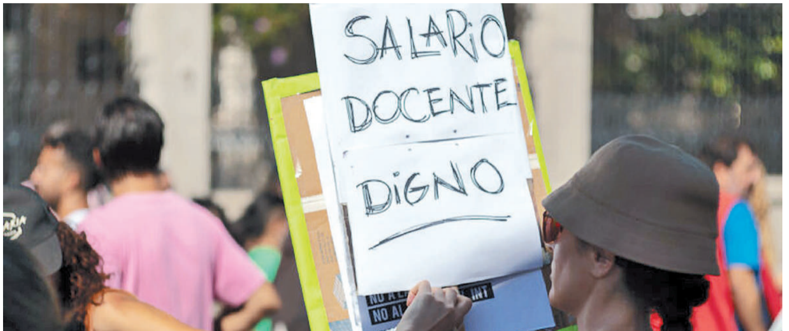
Se vienen cuatro días de paro docente en Entre Ríos.

mó y no estuvo en la oferta. El segundo tema es que toda oferta salarial no puede tener sumas no remunerativas y no puede excluir a los jubilados. El tercer planteo que hacemos es que no hay problema que la pauta sea bimestral, el tema es que debe respetar el proceso inflacionario. La propuesta del Gobierno no respeta el proceso inflacionario, claramente la inflación había sido 4,6% en junio, y el Gobierno pone 5% de recomposición, pero aumentar el 3% el aporte jubilatorio. Entonces, queda un poco menos que 2%. En el cuarto punto, sobre lo cual el Gobierno había dado parcial respuesta, tiene que ver con el aumento del salario mínimo inicial del cargo testigo, hoy en $379 mil. Se lo lleva a ese monto a $418 mil. Nosotros entendemos que debe ser elevado un poco más».