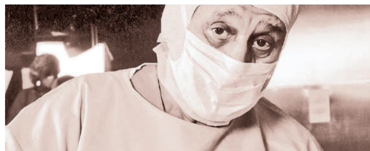
René Favaloro, médico, cardiocirujano y docente.

RENÉ FAVALORO. A la edad de 77 años, se suicida en Buenos Aires, el médico, cardiocirujano y educador René Favaloro, reconocido en todo el mundo por haber desarrollado el bypass coronario con empleo de la vena safena. "En este último tiempo me he transformado en un mendigo. Mi tarea es llamar, llamar y golpear puertas para recaudar algún dinero que nos permita seguir" en la Fundación Favaloro, había dicho.