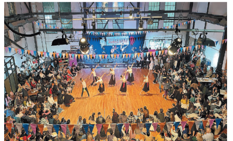
La próxima edición de Usina en Peña será el 23 de agosto.