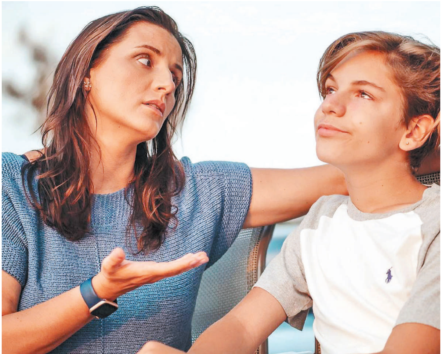
Los expertos coinciden en que la culpa puede ser un motor de responsabilidad en niveles aceptables, pero su exceso causa sufrimiento y autorreproches.

Y con respecto a la culpa que aparece en estas situaciones, enfatizó: “La culpa es un sentimiento complejo que tiene varias dimensiones, aunque la más conocida es la que puede sentir cualquiera respecto a otras personas en relación con una deuda. La culpa es constitutiva y aparece en todas las estructu-