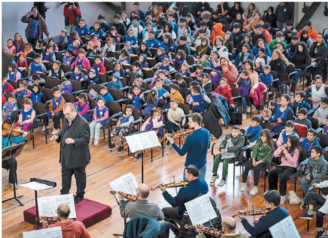
Continúa el ciclo de conciertos didácticos A Toda Orquesta.