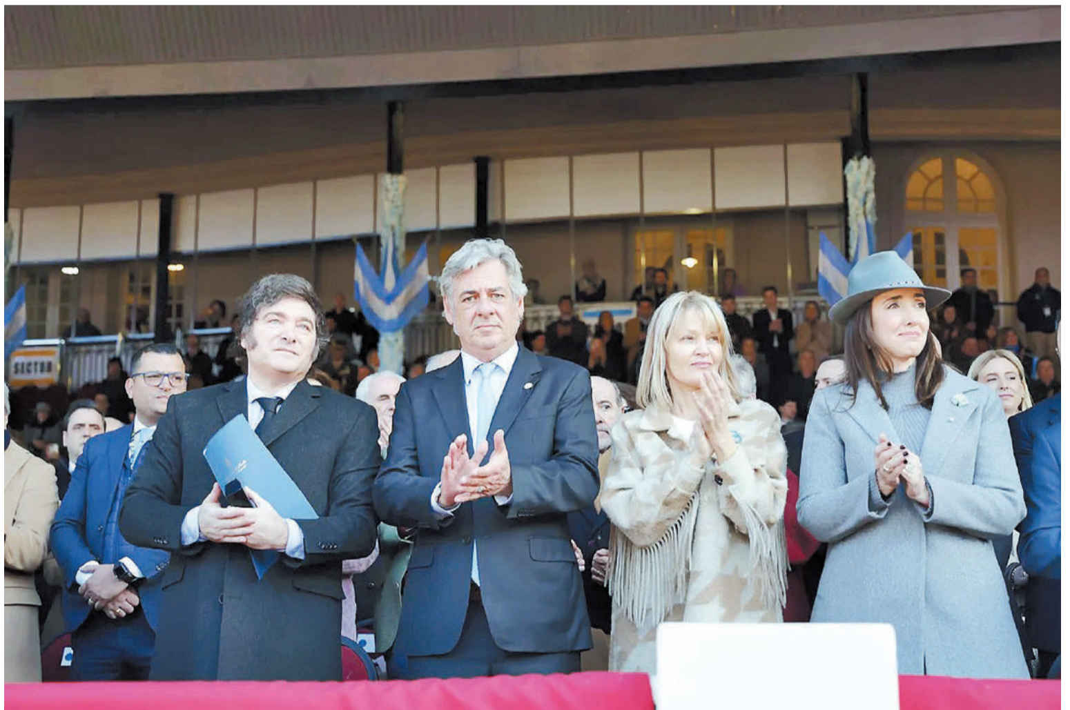
La vicepresidenta Victoria Villarruel se ubicó en el palco, separada de los hermanos Milei por Nicolás Pino y su esposa.

PARCHES. “También debemos saber que quitar los parches sin antes solucionar el problema de fondo sería agravar la crisis que heredamos. Por eso, no nos importa cuánta presión haya ni de dónde venga, nosotros no vamos a apresurarnos demagógicamente. Vamos a respetar el logro del equilibrio macroeconómico y vamos a avanzar conforme sea logrado”, explicó además.