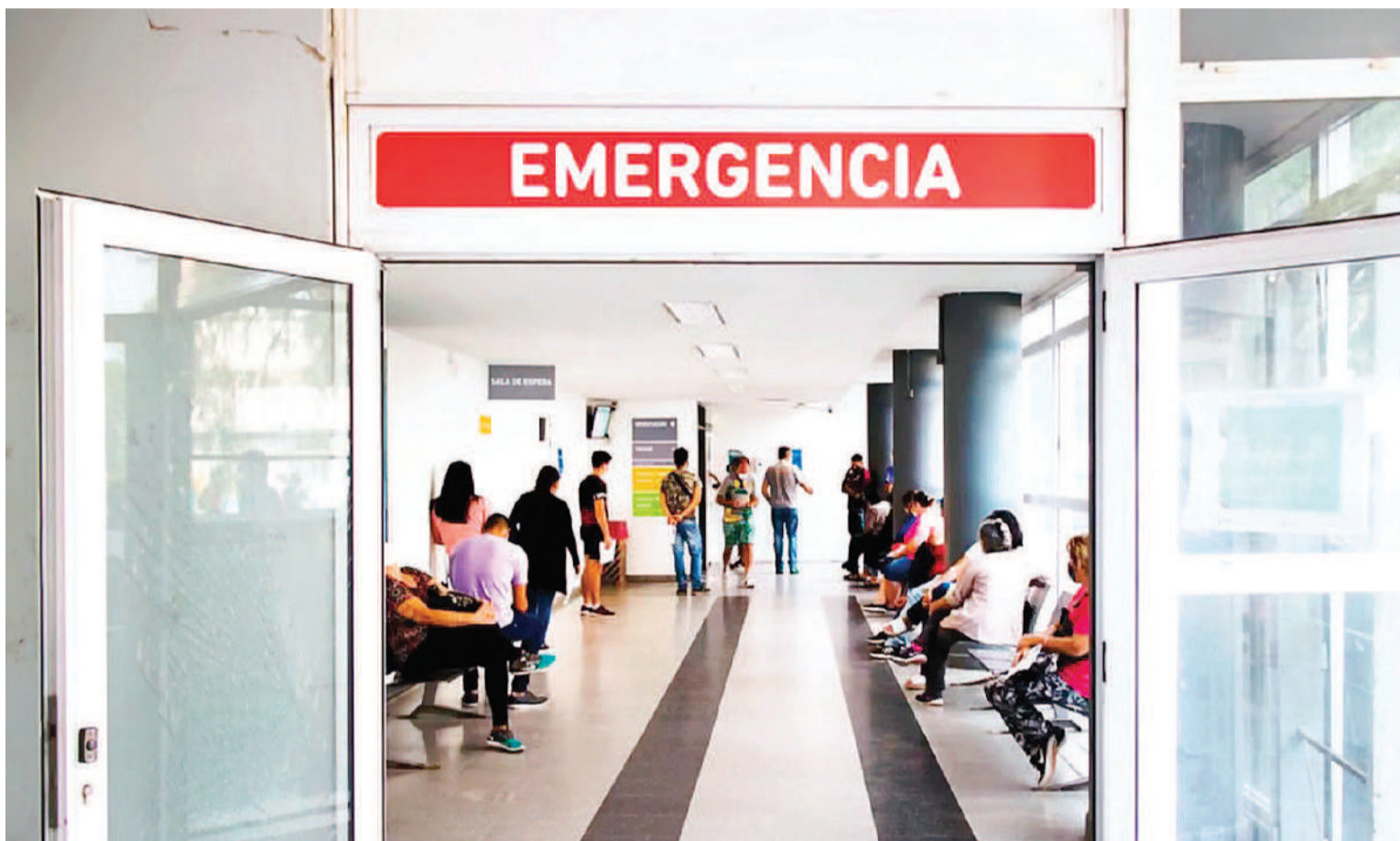
Actualmente, el SIDA se ha convertido en una patología crónica, como puede ser una diabetes.

mamá por algunos años. Misteriosa, independiente, brillante y severa. Sus logros profesionales me los enteré de grande, ella prefiere mantenerlos escondidos y sacarse