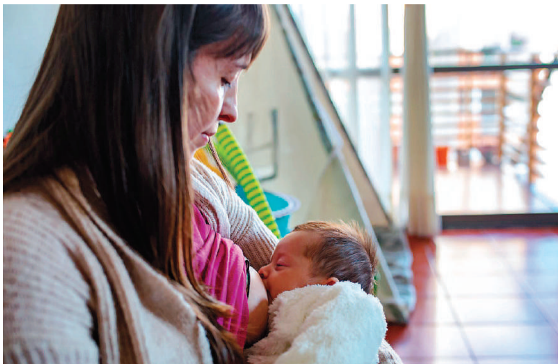
Espacios amigos de la lactancia, un ámbito cómodo y seguro para la extracción de leche materna.

Hasta el momento han sido certificados en forma conjunta por los Ministerios nacional y provincial, 19 de estos lugares, tanto en el ámbito público como privado. Además, se trabaja en la acreditación del vigésimo y en la construcción y habilitación de otros nuevos.