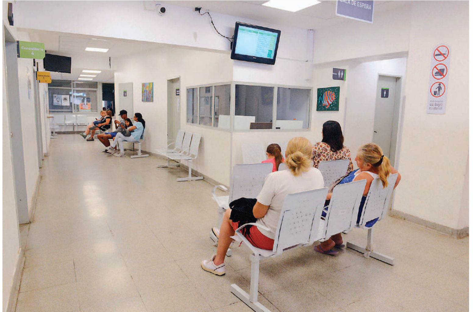
El número de infectados de sífilis ha aumentado ampliamente y en el servicio de Infectología del Hospital San Martín reciben un nuevo paciente todas las semanas.

Por otra parte, hace algunas semanas en el Hospital Escuela de Concepción del Uruguay le negaron la atención médica a una paciente con VIH luego de una intervención quirúrgica. No pudo hacer