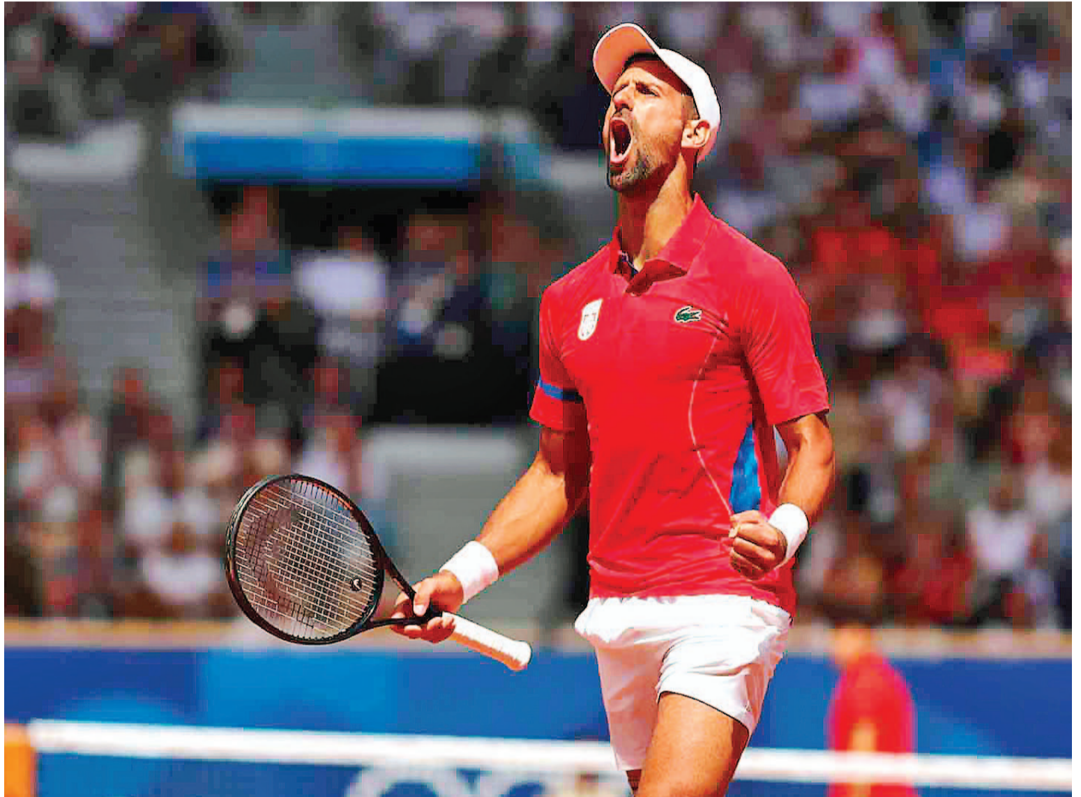
El serbio Novak Djokovic superó al español Alcaraz y logró la medalla de Oro en París 2024.

El segundo tuvo un desarrollo parecido, quizás con menos in-