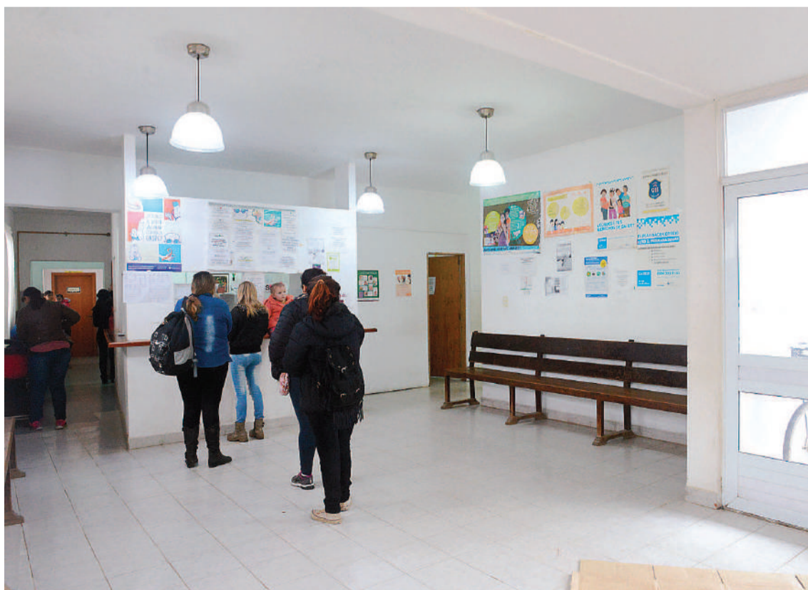
En el Servicio de Infectología del Hospital San Martín se realizan dos estudios a los pacientes: carga viral y CD4.