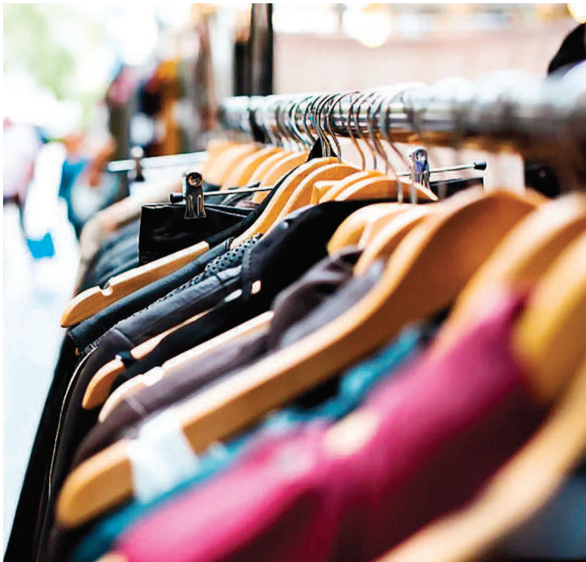
En el rubro textil e indumentaria las ventas cayeron 3,8 % anual en julio.

Ante este panorama, desde CAME sostienen que “las pymes están intentando mantenerse a flote en un contexto económico financiero muy complejo” y revelan que