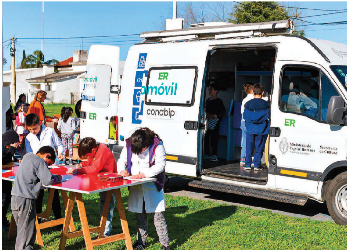
El Bibliomóvil visita localidades entrerrianas, llevando historias, actividades artísticas y lúdicas de promoción de la lectura.

En esa instancia, el ministro de Gobierno y Trabajo, Manuel Troncoso, expresó que "ésta es una muy linda manera de fomentar el acceso a la cultura porque una comunidad que tiene acceso a los libros es más libre, estimula su imaginación y su pensamiento. Así que estamos muy contentos de que el bibliomóvil llegue con sus historias y actividades lúdicas a cada rincón de la provincia, construyendo ciudadanía por encima de cualquier dife-