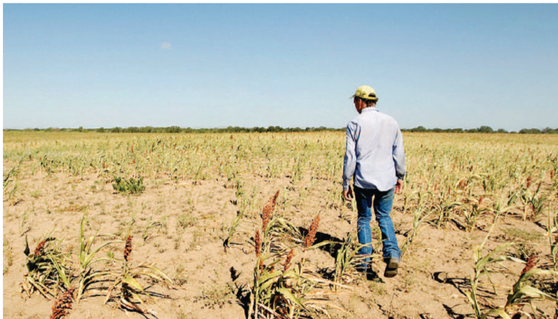
Los fondos son destinados a recuperar las pérdidas por sequía mediante la compra de insumos básicos para la producción.

El gobierno provincial transfirió, en el marco de la Emergencia Agropecuaria 2023 por Agricultura Familiar, 354 millones de pesos en Aportes No Reembolsables a 707 productores entre ganaderos -bovinos de carne y leche, caprinos y ovinos-, horticultores y apicultores.