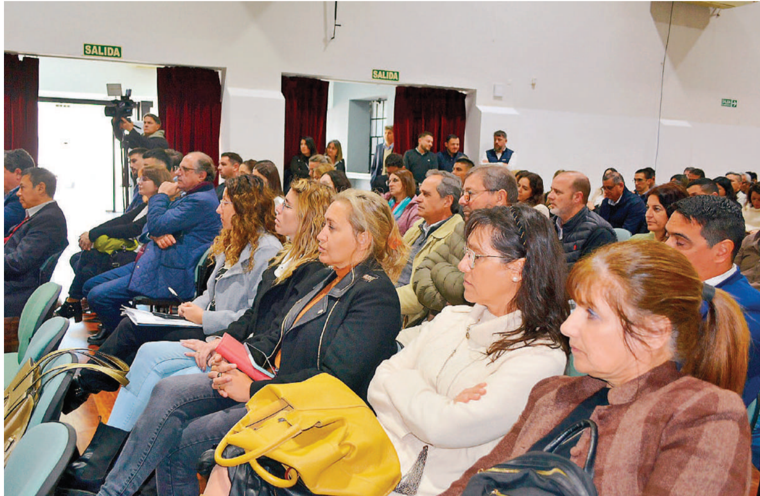
En la Vieja Usina de Paraná se realizó una jornada para analizar el tema de la IA.