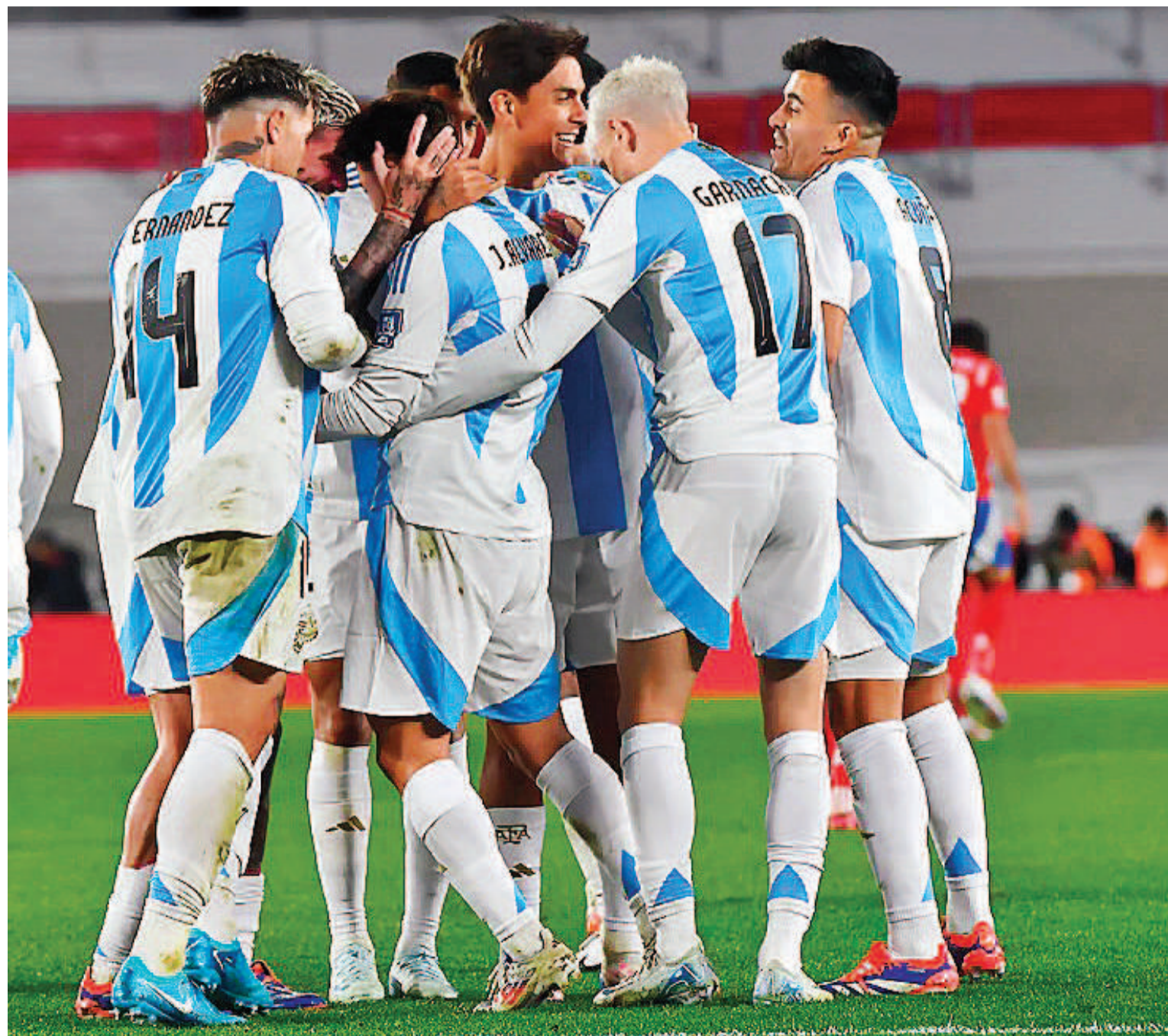
El plantel argentino buscará seguir sumando en su camino al próximo mundial, donde lidera las posiciones en las Eliminatorias.

El equipo de Lionel Scaloni, campeón del mundo y bicampeón de América, enfrentará al seleccionado cafetero desde las 17,30 en el estadio Metropolitano de Barranquilla, en un duelo que contará con el arbitraje del chileno Piero Maza y es válido por la octava fecha de las Eliminatorias.