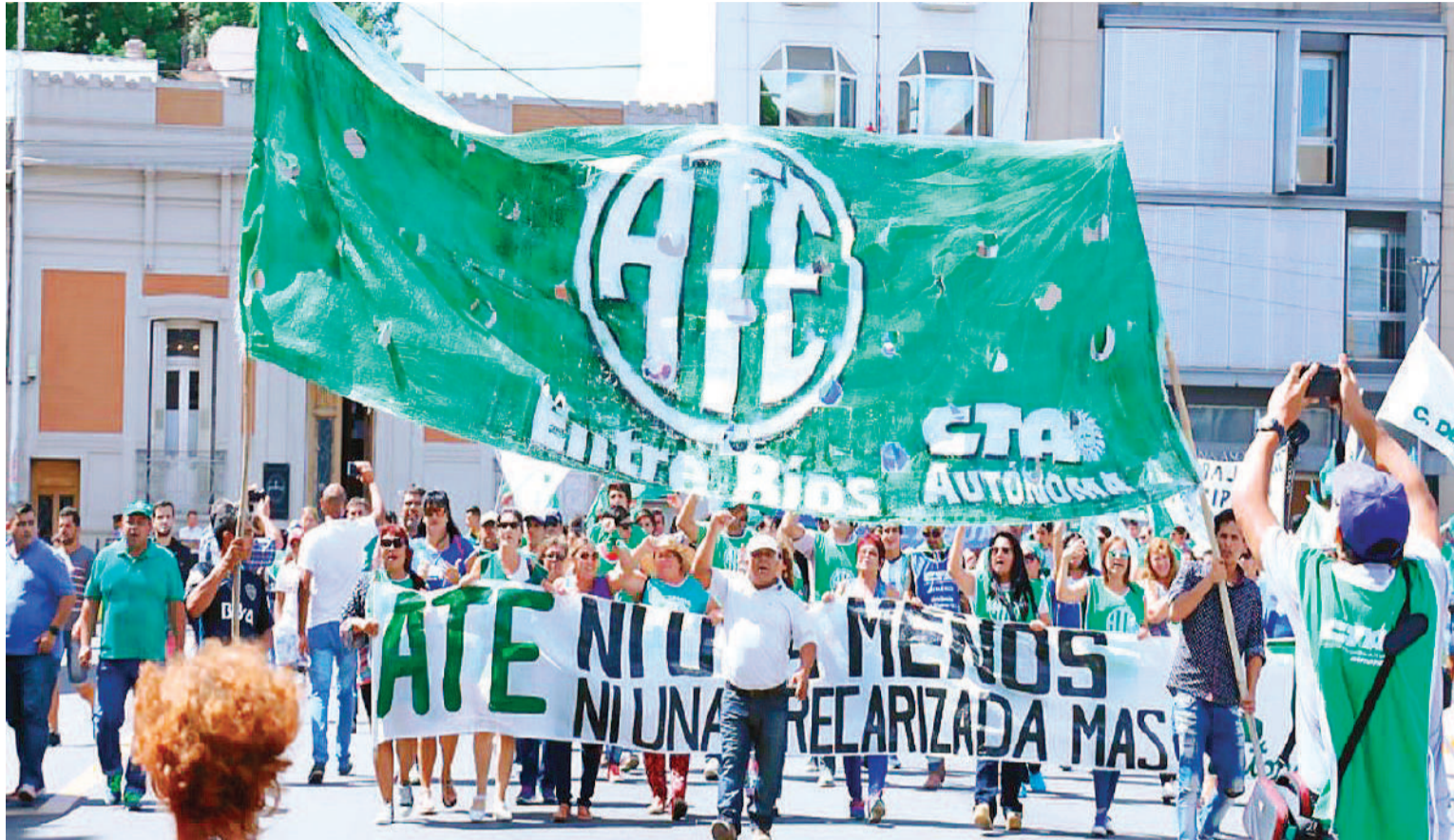
Se espera para mañana un paro y movilización de ATE a nivel nacional, mientras se sesionará en el Congreso por el veto a la movilidad jubilatoria.