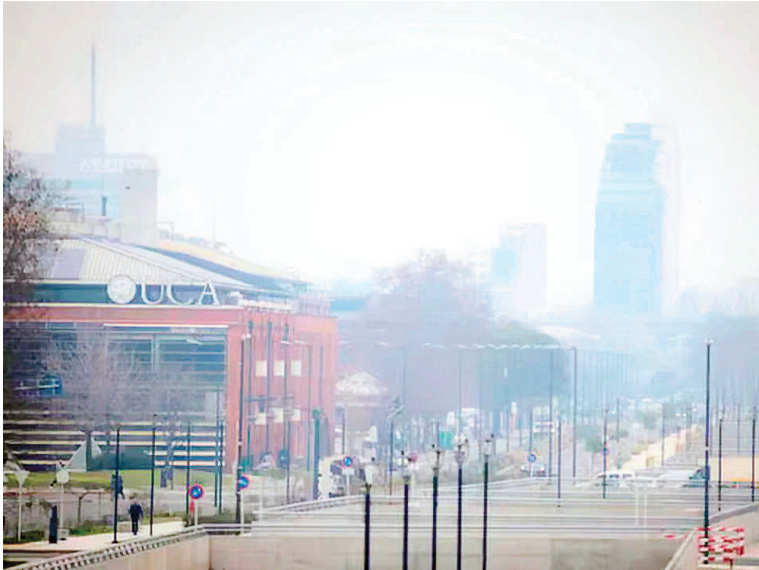
El humo llegó a zonas como Puerto Madero.