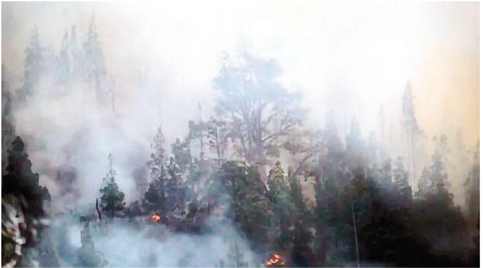
El Servicio Meteorológico Nacional advirtió por reducción de la visibilidad y mala calidad del aire.

Desde la Asociación Argentina de Medicina Respiratoria expresaron su preocupación por los incendios recurrentes en las distintas geografías del país, y el impacto en la salud respiratoria en particular, y consideraron necesaria la concientización del problema, la priorización del mismo y la toma de decisiones en las esferas que correspondan para contener esta situación que enferma a la sociedad.