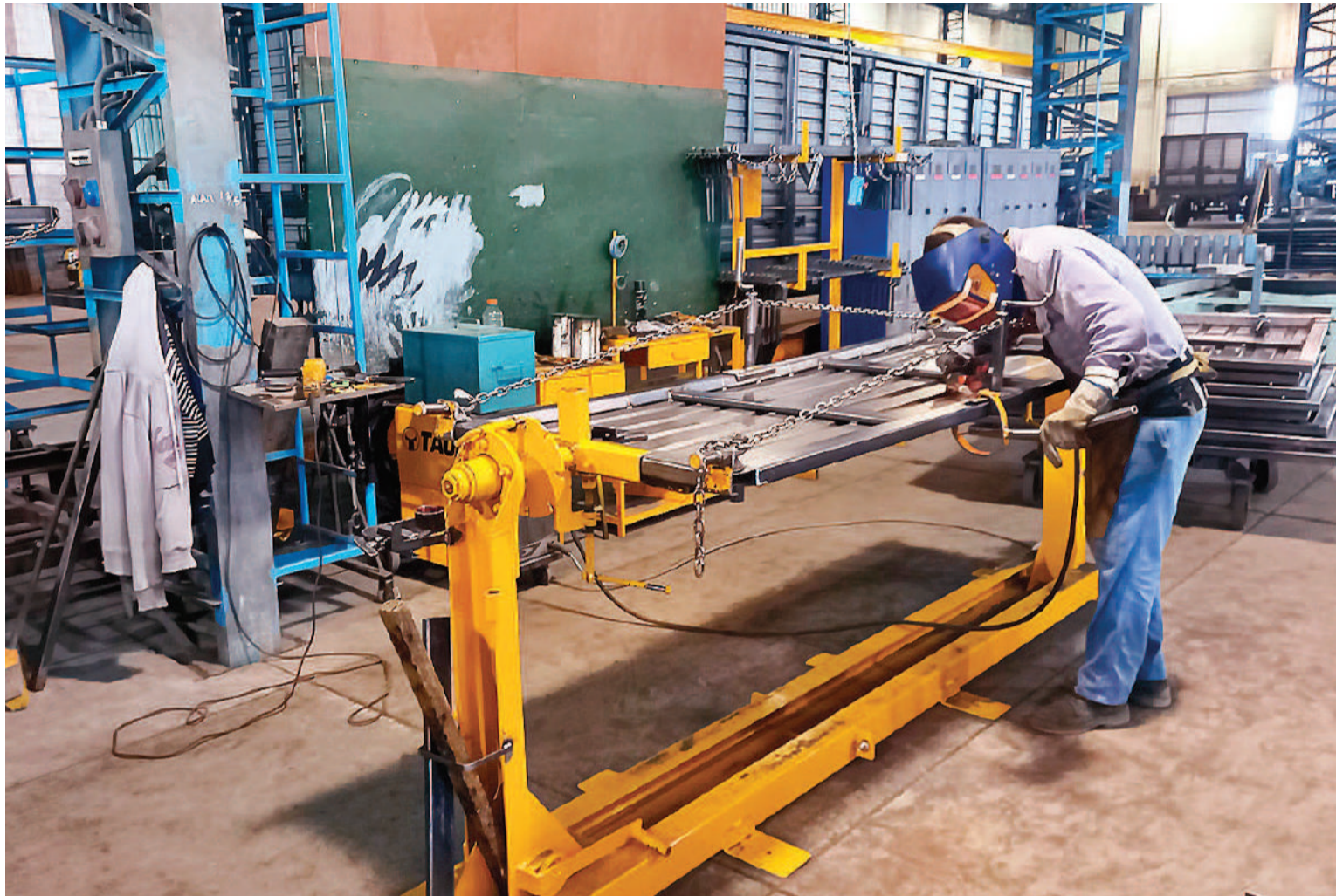
La metalmecánica entrerriana genera miles de empleos privados.

La Unión Industrial de Entre Ríos y el Consejo Empresario de Entre Ríos, en sendas notas enviadas al gobernador, expresaron su apoyo al Régimen de Incentivo para Nuevas Inversiones (RINI). Aseguran que “favorecerá el desarrollo y el crecimiento de las industrias locales”.