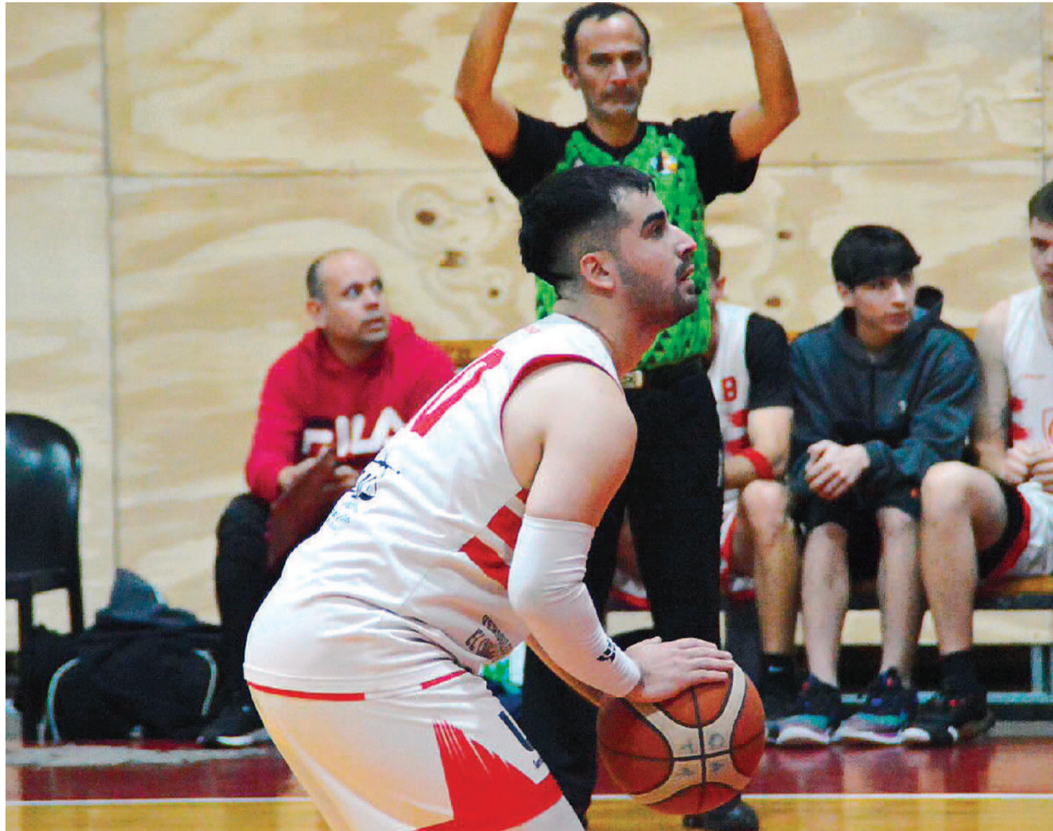
El Quique Club superó a Ciclista y dio qué hablar, en el cuarto capítulo de la APB.

El Quique Club derrotó a Ciclista, en el resultado más resonante de la cuarta fecha del Torneo Clausura de la Asociación Paranaense de Básquet.