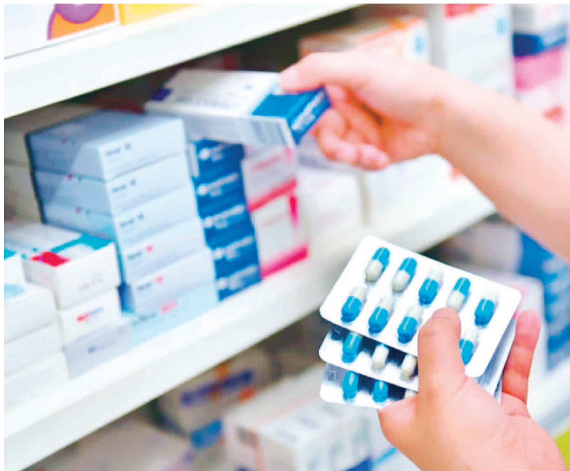
La concentración máxima habilitada para la venta libre de omeprazol, esmaprazol, pantoprazol y lansoprazol, en su presentación de monodroga, será de 40 mg.

De acuerdo con lo que establece la normativa publicada en el Boletín Oficial en las primeras horas del jueves, las presentaciones de expendio en las formas farmacéuticas orales sólidas de los Ingredientes Farmacéuticos Activos (IFAs) no podrán exceder los 30 comprimidos y/o cápsulas.