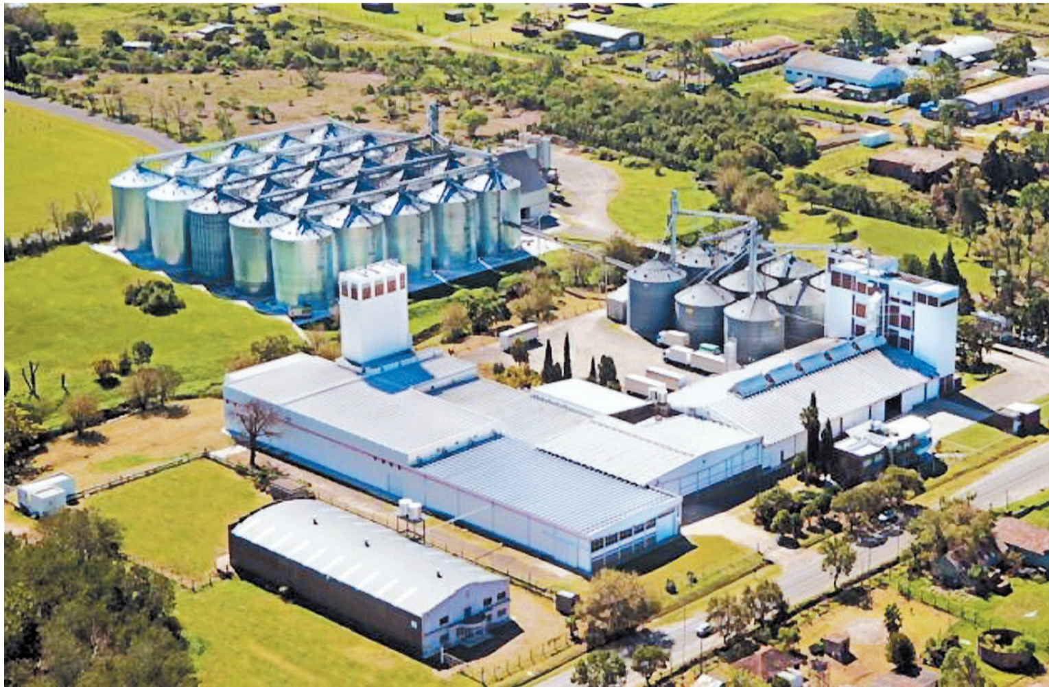
La industria perdió el 1,8 de puestos de empleo en la provincia.

CAMBIO DE PARADIGMA. Para Bourdin, “es un cambio de paradigma” y reconoció que en los sectores de productos, bienes y servicios “no están acostumbrados a trabajar con estabilidad”. “La estabilidad hace que uno sepa que, si compró determinado producto a tal precio, se sorprenderá si está más caro o más barato”, acotó