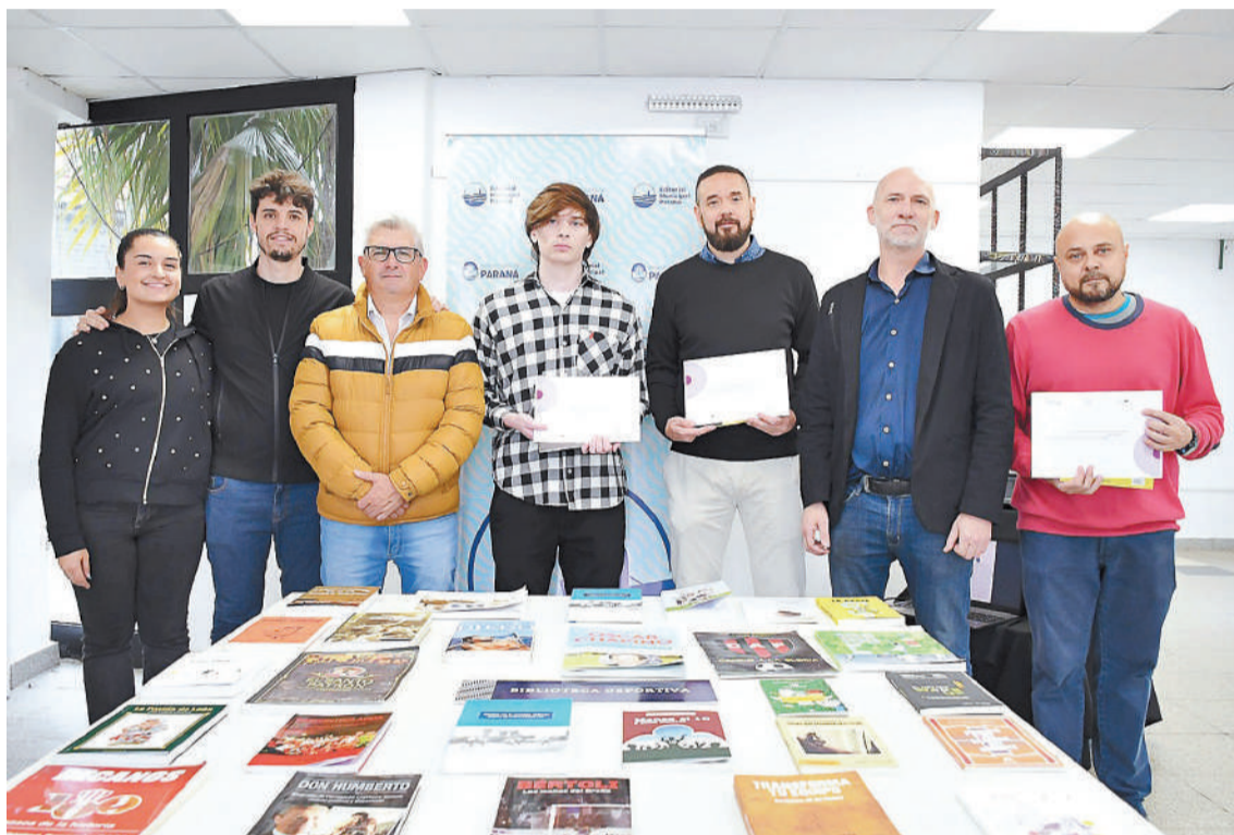
Los participantes distinguidos destacaron, junto a los jurados, el valor de la iniciativa.

mucho más que la competencia; es un espacio donde se entrelazan el sacrificio, la perseverancia, el compañerismo; y donde muchas veces se escriben historias que merecen ser contadas. Esta fue una oportunidad para reconocer el valor de las historias que habitan en nuestra memoria colectiva".