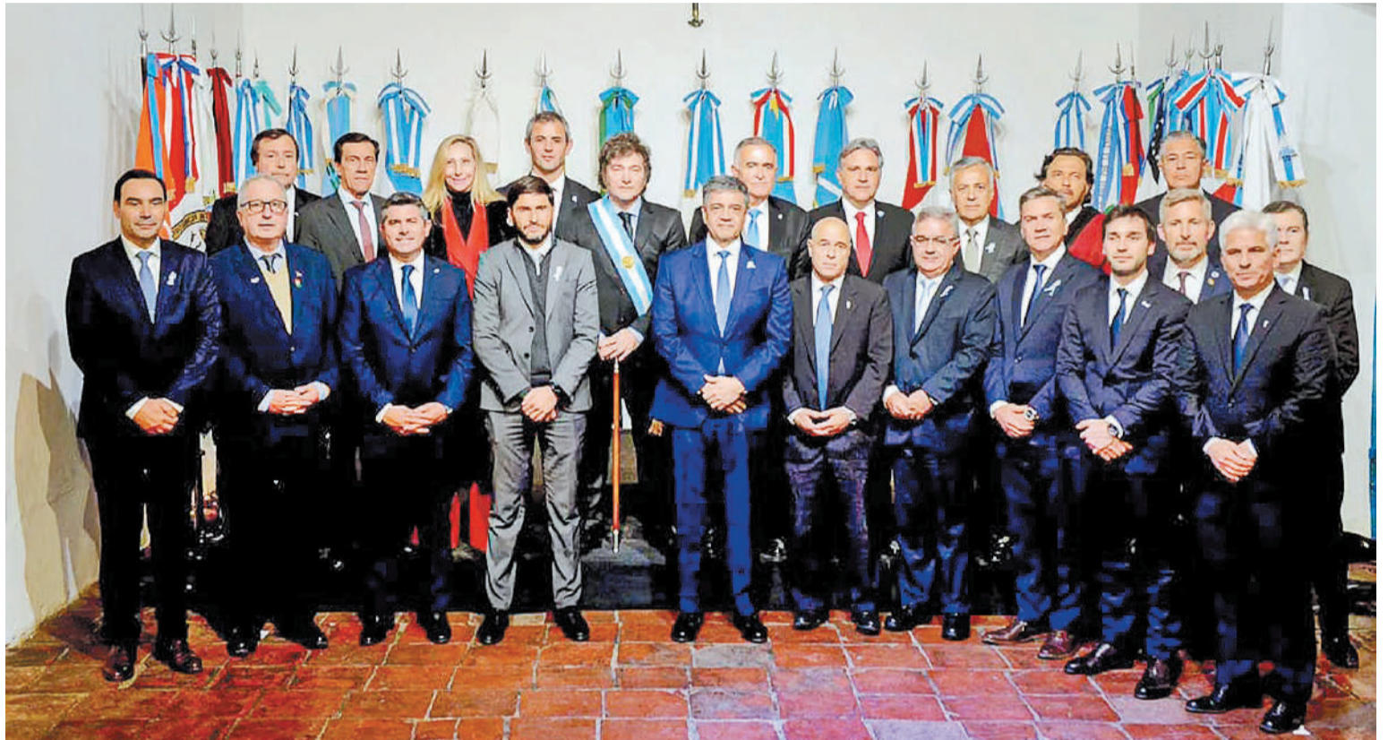
En su discurso en el Congreso, el Presidente instó a los gobiernos provinciales y municipales a “reducir gastos en vez de aumentar tasas e impuestos”.

BAJAR LA PRESIÓN FISCAL. Ese logro, prosiguió, “implicará menor presión fiscal futura sobre los contribuyentes, lo que significará mayor incentivo para invertir. En una economía globalizada, y aún más