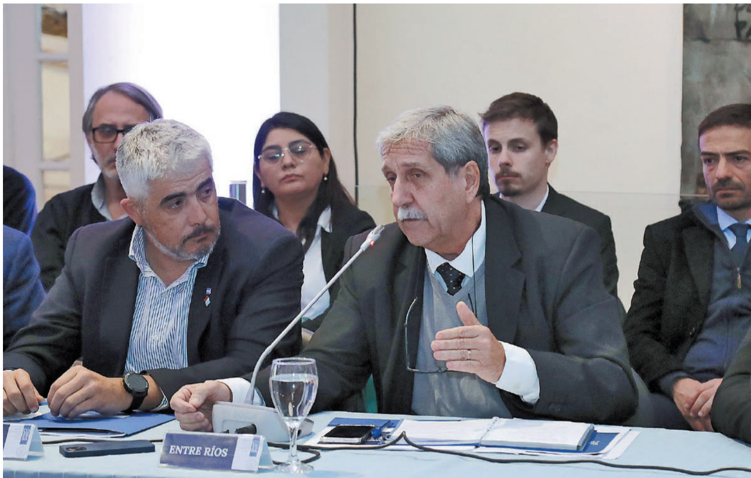
El ministro entrerriano participó del encuentro