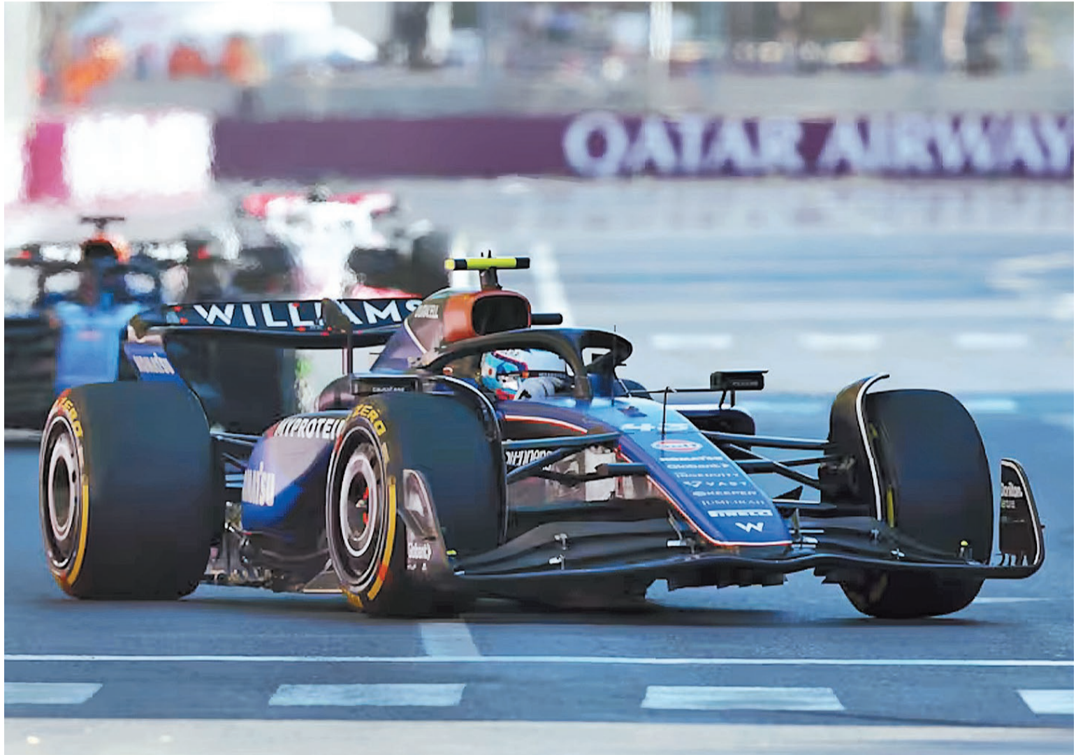
«Estamos en Fórmula 1 y vamos a trabajar para quedarnos, es el objetivo número uno y el más claro. Estamos aquí y vamos a trabajar día a día para quedarnos aquí», indicaron desde el equipo de Colapinto.