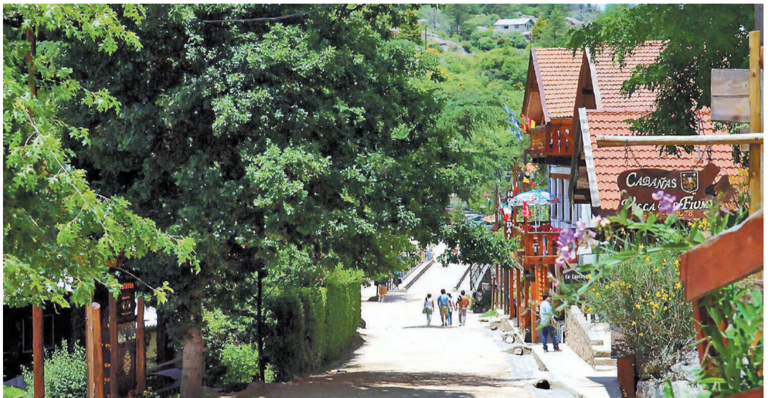
En nuestro país, La Cumbre (Córdoba) se propone como el mejor destino para los interesados en recorrer sin automóvil.

dibles para los amantes del “slow travel” e invita a los viajeros a descubrir lugares a pie alejados de la contaminación y el ruido de las grandes urbes.