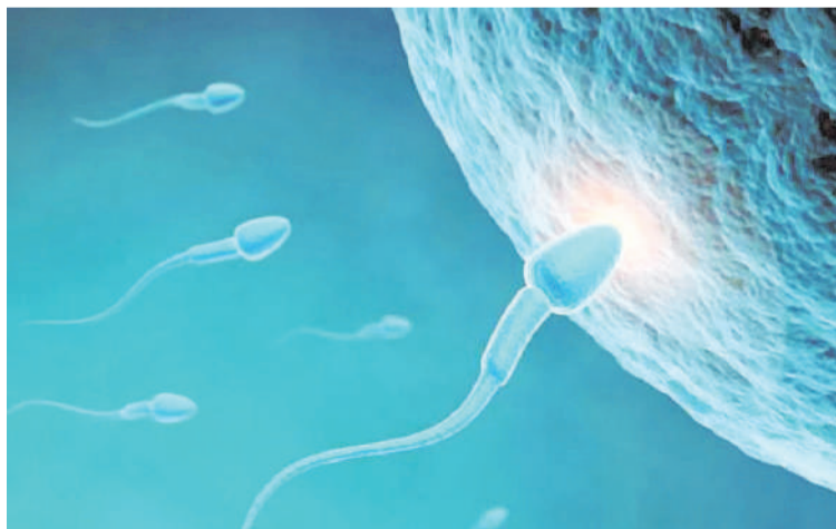
El análisis se realizó con más de 900.000 adultos de entre 30 y 45 años.

El grupo de Sørensen anotó que investigaciones anteriores han encontrado vínculos entre la contaminación atmosférica local y la calidad del espermatozoide, además de unas tasas de éxito tras los tratamientos de fertilidad.