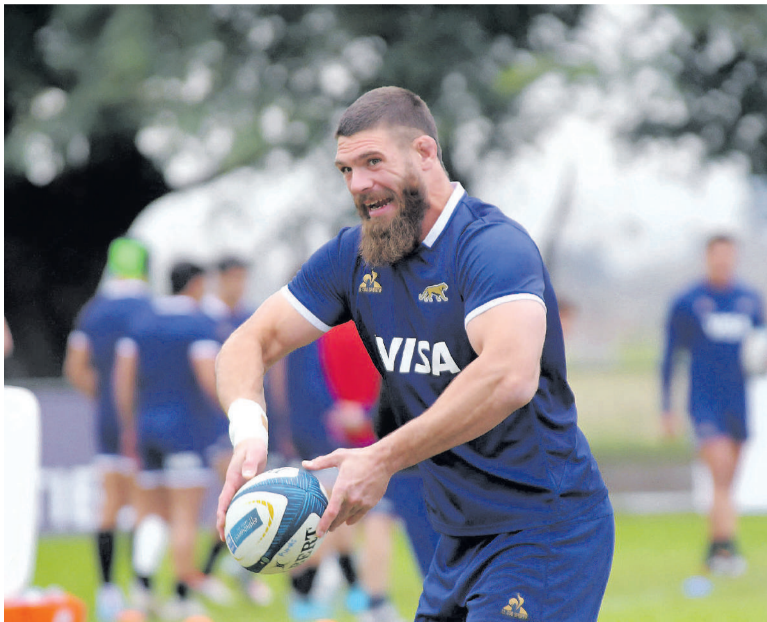
El concordense Marcos Kremer, una fija en el seleccionado argentino que irá por su cap 70 con Los Pumas.

Con la presencia del entrerriano Marcos Kremer, Los Pumas se medirán este sábado a partir de las 16 con Australia en el estadio de Colón, por la cuarta fecha del Rugby Championship. Un considerable número de fanáticos paranaenses estará en las tribunas.