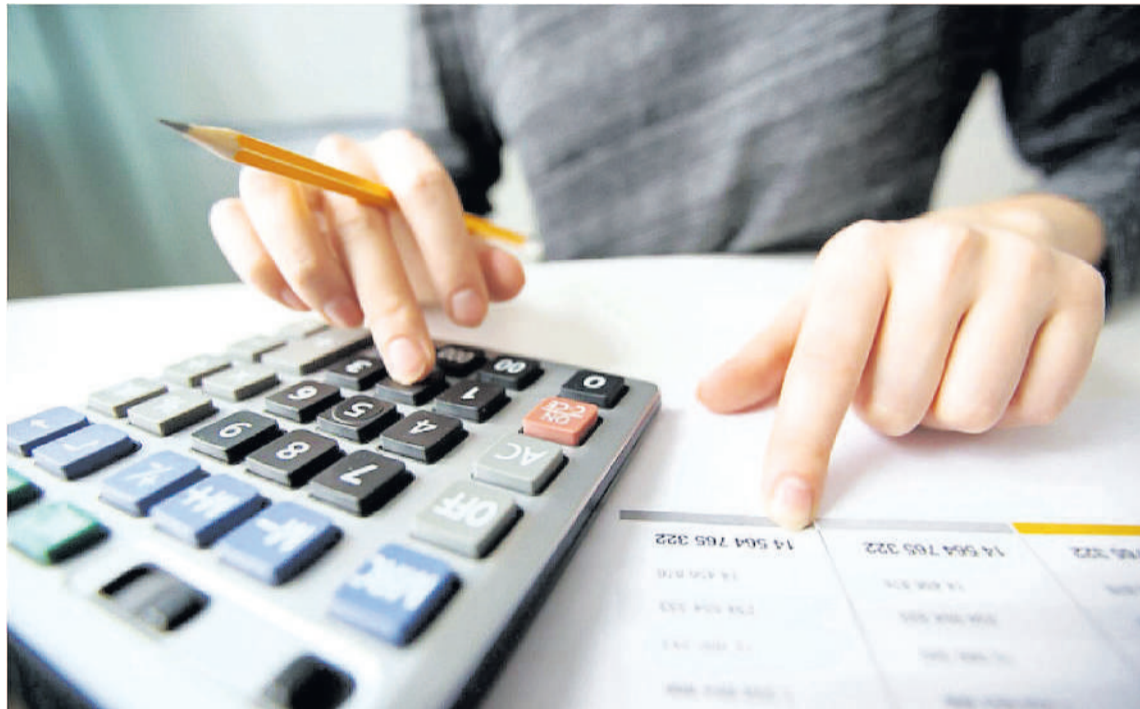
En agosto, el crédito al sector privado continuó su sólida trayectoria de recuperación.

La recuperación del crédito al sector privado muestra una dinámica robusta, con aumentos significativos en ambos tipos de financiamiento. Esta tendencia sugiere una mejora general en la confianza económica y un entorno más favorable para los prestatarios tanto en moneda local como extranjera.