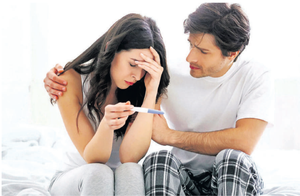
La contaminación del aire puede reducir la fertilidad en los hombres.

El equipo también rastreó los niveles de ruido del tráfico rodado en