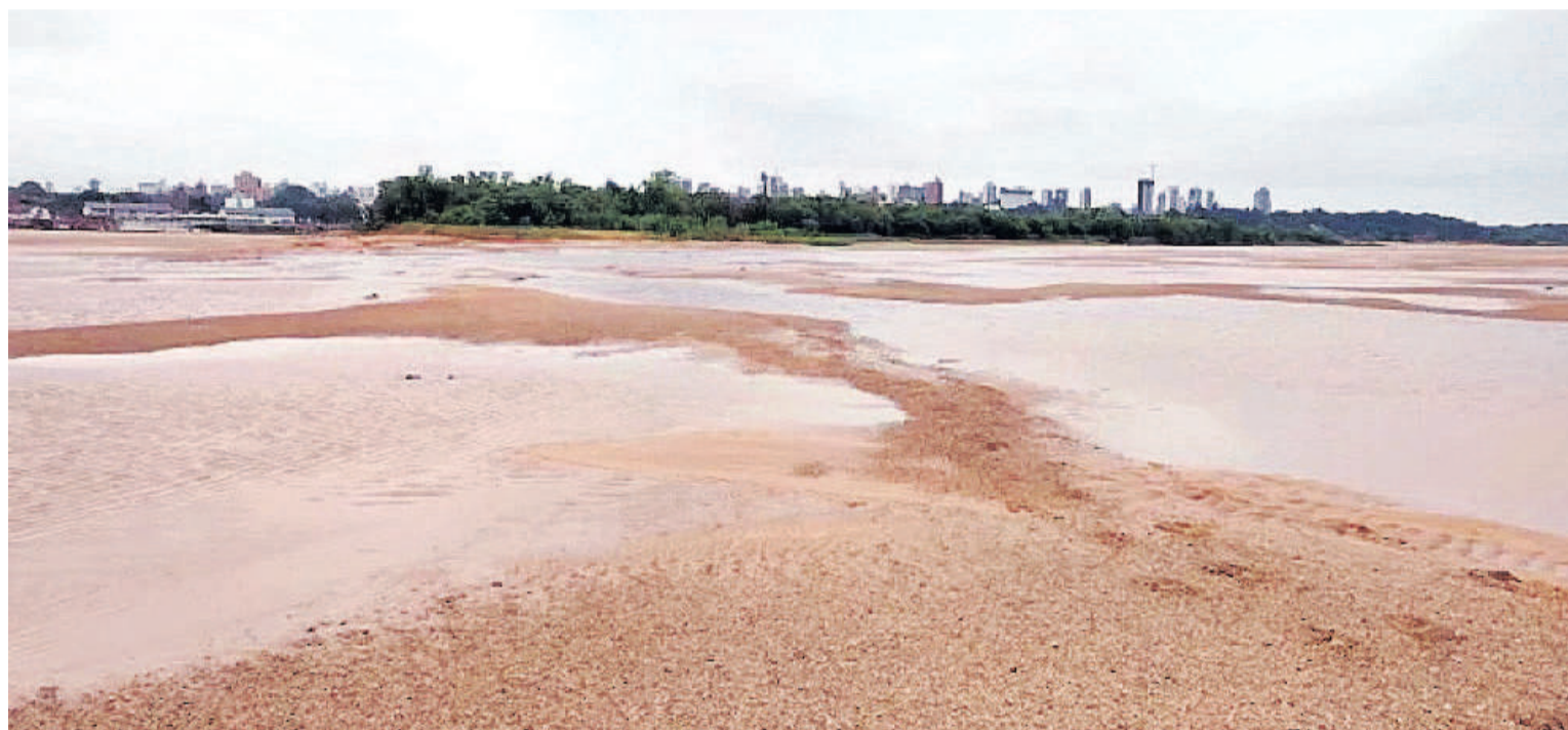
Frente a la costa de la capital provincial se observa la aparición de bancos de arena.

El Instituto Nacional del Agua descarta alturas normales en lo que queda de 2024. Un especialista opinó sobre la supuesta llegada del mar hasta territorio entrerriano.