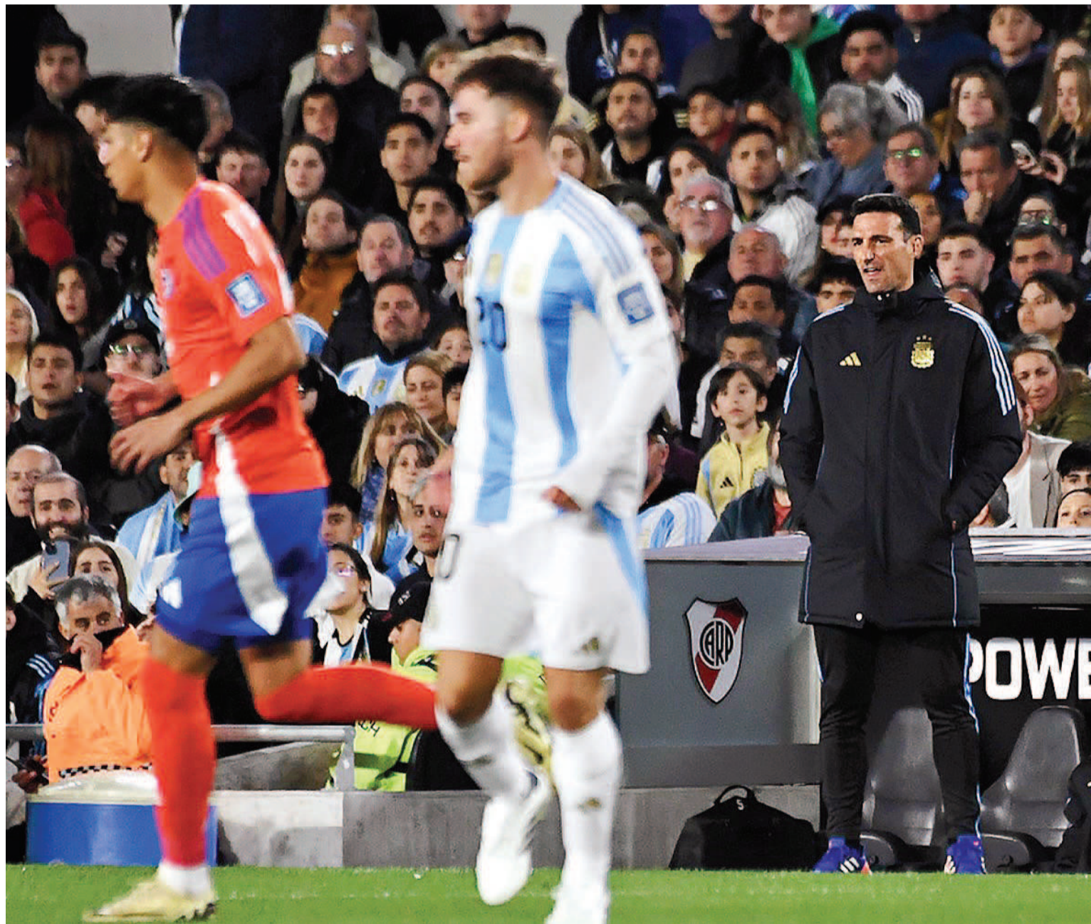
“Se jugó bien, pero siempre hay algo para corregir”, dijo Lionel Scaloni.

El entrenador de la Selección Argentina, Lionel Scaloni, se expresó tras la victoria sobre Chile, conseguida el jueves.