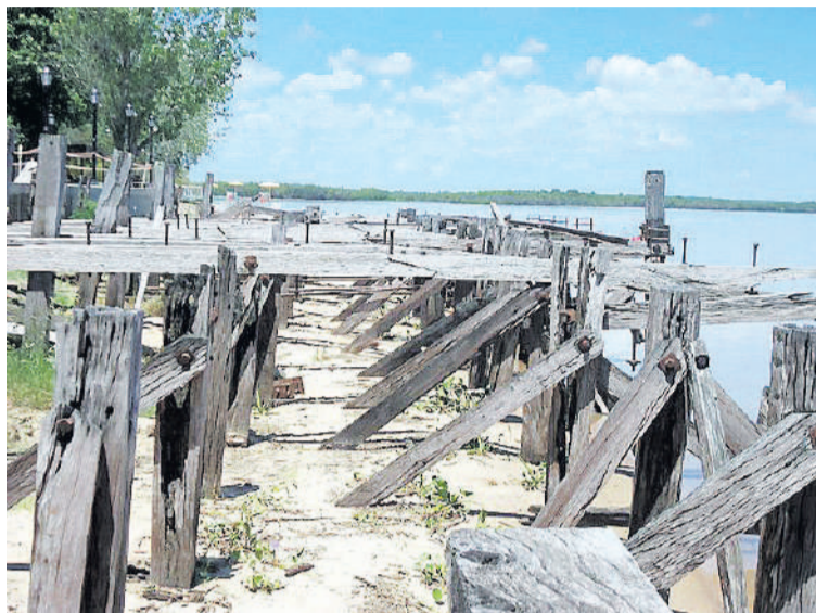
Antiguo puerto de Villa Urquiza.